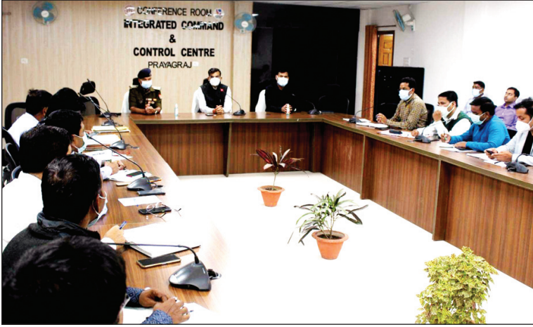
समीक्षा बैठक करते मंडलायुक्त व अन्य अधिकारी

मेला क्षेत्र में सफाई व्यवस्था एवं श्रद्धालुओं हेतु सभी मूलभूत सुविधाएं सुनिश्चित करने के निर्देश दिए, महाशिवरात्रि के स्नान हेतु 6 स्नान घाटों की व्यवस्था की गई है जिन स्थानों पर शौचालयों की उपलब्धता नहीं है वहां पर आवश्यकता अनुसार नगर निगम के मोबाइल टॉयलेट्स लगाने की व्यवस्था करने के निर्देश