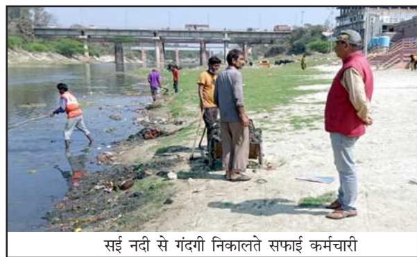
सई नदी से गंदगी निकालते सफाई कर्मचारी

सई नदी से भी गंदगी निकालने का हुआ प्रयास