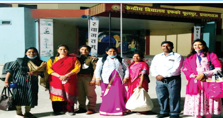
मतदान के लिए रवानगी के समय भी पोलिंग पार्टी के कर्मचारियों ने ली सेल्फी

पोलिंग कर्मचारियों में रहा सेल्फी व फोटो लेने का उत्साह