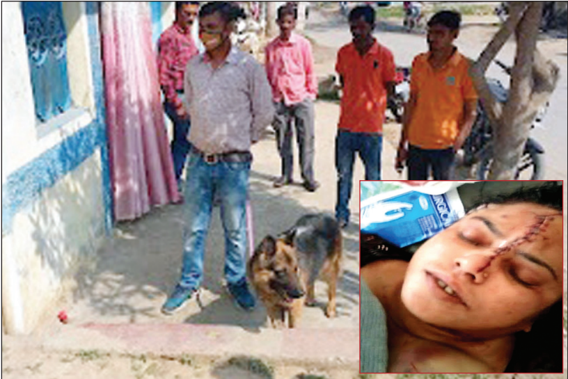
घटना स्थल पर फील्ड यूनिट की टीम के साथ एसटीएफ तथा इन्स्पेक्ट में घायल अवस्था में पीड़ित महिला