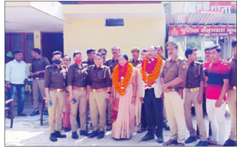
उपनिरीक्षक के सेवानिवृत्त के बाद विदाई समारोह में मौजूद उनकी पत्नी कोतवाल और पुलिस स्टाफ