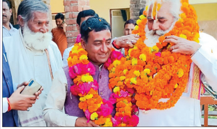
विदाई समारोह में मौजूद प्राचार्य और शिक्षक