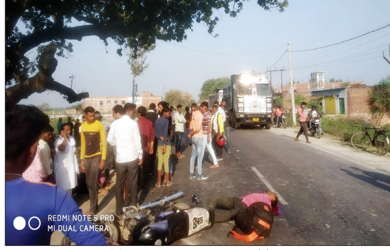
हादसे के बाद घटनास्थल सड़क पर लगी लोगों की भीड़

कौशांबी। मंझनपुर कोतवाली क्षेत्र के टेवा टिकरी पुलिस लाइन के पास सोमवार की शाम 4 बजे दर्दनाक हादसा हुआ है ईट भट्टे में मजदूरी करने बाइक से तीन मजदूर भट्टा जा रहे थे सामने से आ रहे डंपर टुक ने बाइक सवारों को रौंदा दिया है जिससे घटनास्थल पर एक मजदूर की मौत हो गई है और हादसे में एक महिला और उसका पुत्र गंभीर घायल है हादसे की जानकारी मिलते ही घटनास्थल पर आसपास के ग्रामीणों की भीड़ लग गई है मामले की सूचना मिलते ही स्थानीय पुलिस भी घटनास्थल पर पहुंच गई है मृतक के शव को पुलिस ने कब्जे में लेकर पोस्टमार्टम के लिए भेज दिया है और हादसे में घायल दोनों लोगों को इलाज के लिए जिला अस्पताल में भर्ती कराया गया है हादसे के शिकार मजदूर चित्रकूट जनपद के मऊ थाना अंतर्गत मंडौरा गांव के रहने वाले हैं। घटनाक्रम के मुताबिक