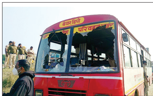
उपद्रवियों द्वारा ईट पत्थर से क्षतिग्रस्त हुई रोडवेज बस एवं मौके पर जांच पड़ताल करती थाना थरवई व थाना सराय इनायत पुलिस।

प्रयागराज। शहीद चंद्रशेखर आजाद पार्क में लाइट एंड साउंड शो और सुंदरीकरण का काम शुरू कर दिया गया है। कार्यदायी एजेंसी तालाब की सफाई कर रही है। स्मार्ट सिटी के तहत लाइट एंड साउंड शो के लिए तालाब के पास कंट्रोल रूम बना दिया गया है। पार्क को और भी खूबसूरत बनाने की योजना है। लाइट एंड साउंड के संदर्भ में एजेंसी योजना तैयार करेगी। एजेंसी तय करेगी कि लाइट एंड साउंड शो में क्या दिखाया जाएगा। इससे पहले इस शो में मेगा स्टार अमिताभ बच्चन की आवाज शामिल करने की योजना थी। प्रयागराज स्मार्ट सिटी लिमिटेड के एक अधिकारी ने बताया कि अमिताभ बच्चन की आवाज और शो के थीम पर कार्यदायी एजेंसी निर्णय लेगी।