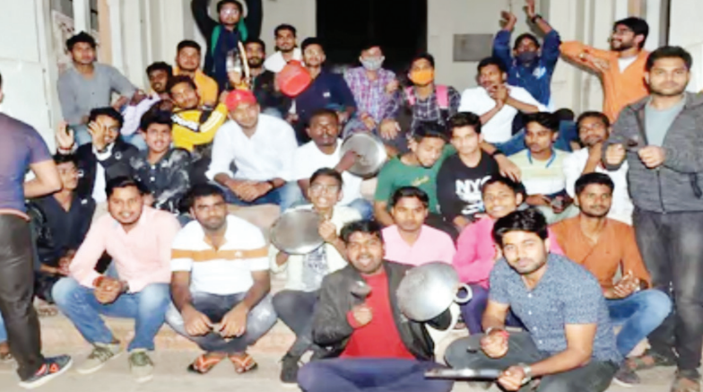
ऑफलाइन परीक्षा की मांग को लेकर छात्रों ने बजाई थाली

प्रयागराज। इलाहाबाद विश्वविद्यालय (इविवि) में ऑफलाइन परीक्षाओं के विरोध में छात्रों ने सोमवार को ताली-थाली बजाते हुए परिसर में मार्च निकाला और यूजीसी को पत्र लिखकर ऑनलाइन परीक्षाएं कराए जाने की मांग की। कुछ छात्र कर्नलगंज थाने भी पहुंचे और सकेतिक रूप से अपना विरोध दर्ज कराते हुए कुलपति की गुमशुदगी दर्ज कराने के लिए प्रार्थनापत्र दिया। इस मुद्दे पर को परीक्षा नियंत्रक कार्यालय के सामने छात्रों का धरना जारी है। छात्रों का कहना है कि परीक्षाओं के मुद्दे पर लगातार आंदोलन चल रहा है, लेकिन कुलपति ने अब तक सीधे तौर पर छात्रों से कोई वार्ता नहीं की। छात्र इस इस बात से भी नाराज है कि कुलपति की ओर से गठित कमेटी के सदस्यों ने छात्र प्रतिनिधियों से वार्ता तो की, लेकिन इसके बाद भी इविवि प्रशासन परीक्षाओं पर अपना रुख स्पष्ट करने को तैयार नहीं है छात्र मांग कर रहे हैं कि जब कमेटी ने अपनी रिपोर्ट कुलपति को सौंप दी है तो विश्वविद्यालय प्रशासन छात्र हित में तत्काल निर्णय ले। विश्वविद्यालय एक मार्च तक बंद है। दो मार्च से विश्वविद्यालय खुलने पर इस मसले पर हंगामा