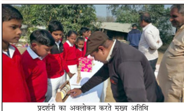
प्रदर्शनी का अवलोकन करते मुख्य अतिथि

सरस्वती शिशु मंदिर चिलबिला में लगी प्रदर्शनी