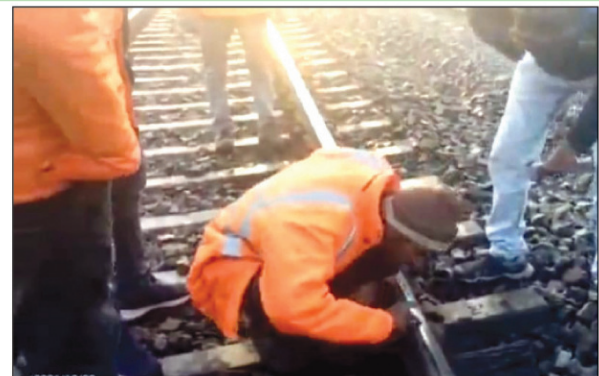
टूटी रेल पटरी बनाते रेलवे कर्मचारी

अजुवा कौशाम्बी। दिल्ली हावड़ा रेल मार्ग के कनवार अटसराय रेलवे स्टेशन के बीच संकरा बावा देवस्थान के पास रेलवे ट्रैक टूट गया लेकिन रेलवे कंट्रोल अधिकारी और स्टेशन मास्टर को ट्रैक टूटने की जानकारी नहीं हो सकी रेलवे के अधिकारियों ने यात्री ट्रेन गुजरने के लिए सिमल दे दिया लेकिन इसी बीच रेलवे कीमैन की नजर टूटी रेल पटरी पर पड़ गई और उसने मामले की सूचना रेल अधिकारियों को देने के साथ-साथ मौके पर यात्री गाड़ी को रोकने का इंतजाम किया यात्री गाड़ी रुक जाने के बाद हादसा टल गया और टूटे रेलवे ट्रैक को