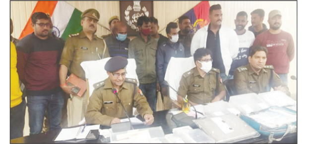
लूट की घटना का खुलासा करते पुलिस अधीक्षक साथ में मौजूद पुलिस अधीक्षक व अन्य

आरोपियों की गिरफ्तारी पर पचास पचास हजार का इनाम पुलिस महानिरीक्षक ने किया था घोषित