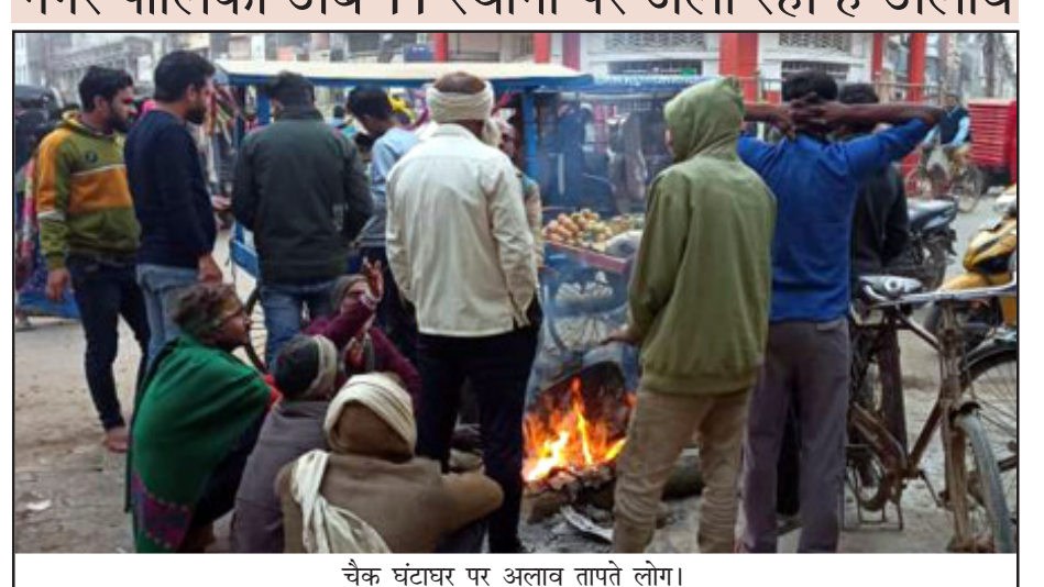
चैक घंटाघर पर अलाव तापते लोग।

नगर पालिका अब 11 स्थानों पर जला रही है अलाव