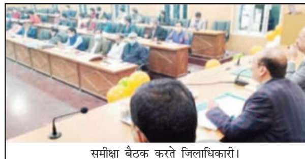
समीक्षा बैठक करते जिलाधिकारी।

मैनपुरी। कोविड 19 से बचाव हेतु संचालित प्रभारी चिकित्सक अधिकारी सुल्तानगंज का वेतन रोकते हुए चेतावनी जारी कर चिकित्सक अधिकारी वेवर, कुचला, किसनी को कारण बताओ और निर्देश दिए कि जिला अधिकारी अविनाश कृष्ण सिंह ने जिला स्वास्थ्य समिति की बैठक