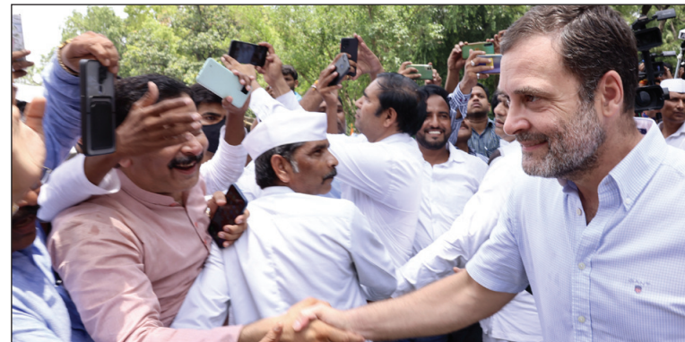
राजनीति और अग्निपथ योजना को लेकर सत्याग्रह कर रही है। राहुल ने कहा कि जिस तरह केंद्र सरकार को कृषि कानूनों को वापस लेना पड़ा था उसी तरह से अग्निपथ योजना को भी वापस लेना पड़ेगा। देश का युवा इसके लिए पार्टी के साथ खड़ा होगा। प्रवर्तन

नई दिल्ली: कांग्रेस के पूर्व अध्यक्ष राहुल गांधी ने बुधवार को कहा कि केंद्र की भारतीय जनता पार्टी सरकार को सेना में जवानों को भर्ती करने से जुड़ी अग्निपथ योजना को आखिरकार वापस लेना होगा। उन्होंने कहा कि देश के युवा जानते हैं कि देश भक्ति का असली अर्थ देश को मजबूत करना है। अग्निपथ से सेना और राष्ट्र दोनों कमजोर होंगे। कांग्रेस पार्टी यह सुनिश्चित करेगी कि सरकार योजना को वापस ले। दिल्ली स्थित पार्टी मुख्यालय में बुधवार को पार्टी के वरिष्ठ नेताओं, सांसदों और विधायकों के सम्मक्ष राहुल गांधी ने प्रवर्तन निदेशालय से जुड़ी पूछताछ और राष्ट्रीय मुद्दों पर अपनी बात रखी। पार्टी पिछले कुछ दिनों से केंद्र सरकार की कथित प्रतिशोध की