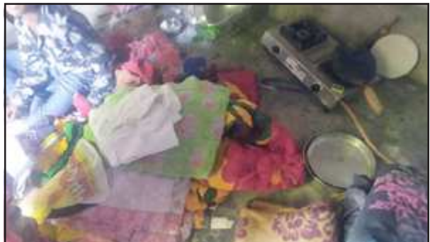
चोरी के बाद बिखरा पड़ा सामान।