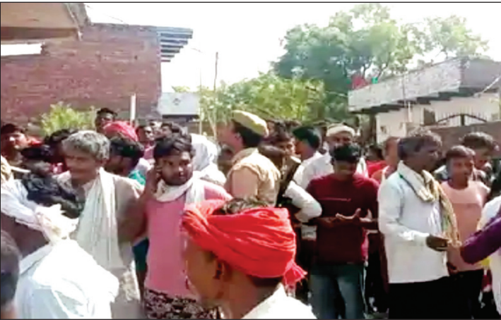
घटनास्थल पर मौजूद ग्रामवासी