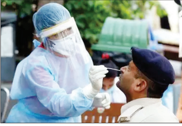
फिलहाल एक्टिव मामले 24,915 हैं। मंगलवार को 39,094 कोविड टेस्ट किए गए और पॉजिटिविटी रेट 9.36% दर्ज किया गया है। एक दिन पहले राज्य में 2,354 नए केस मिले थे और पॉजिटिविटी रेट 10.36% दर्ज किया गया था।

नई दिल्ली: देश में कोरोना केस एक दिन की गिरावट के बाद फिर से बढ़ने लगे हैं। पिछले 24 घंटे में 12,150 नए केस मिले हैं। कुल एक्टिव मरीजों की संख्या 80 हजार के पार पहुंच गई है। मार्च के बाद ये पहली बार है, जब इलाज कराने वाले मरीजों की संख्या में इजाफा हुआ है। 1 मार्च को 85,680 एक्टिव केस दर्ज किए गए थे। सबसे ज्यादा महाराष्ट्र में आए केस: महाराष्ट्र में पिछले 24 घंटे 3,659 केस मिले हैं। यहां 3,356 मरीज ठीक हुए और 1 मरीज की मौत हुई। महाराष्ट्र में