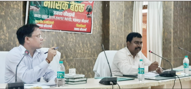
जिला पर्यावरण समिति की बैठक करते जिलाधिकारी कौशाम्बी।

3 हजार 740 नगर विकास द्वारा 17 हजार 920 लोक निर्माण विभाग द्वारा 17 हजार 220 जल शक्ति सिंचाई विभाग द्वारा 10 हजार 220 कृषि विभाग द्वारा 1 लाख 76 हजार 400 पशु पालन विभाग द्वारा 8540 सहकारिता विभाग द्वारा 4200 उद्योग विभाग द्वारा 12 हजार 600 उर्जा विभाग द्वारा 6860 माध्यमिक शिक्षा विभाग द्वारा 9140 बेसिक शिक्षा विभाग द्वारा 12 हजार 40 प्राविधिक शिक्षा विभाग द्वारा 2100 उच्च शिक्षा विभाग द्वारा 5000 स्वास्थ्य विभाग द्वारा 13 हजार 20 परिवहन विभाग द्वारा 1960 उद्यान विभाग द्वारा 1 लाख 15 हजार 80 तथा गृह पुलिस विभाग द्वारा 6300