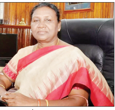
जुलाई को होगी। नामांकन प्रक्रिया शुरू हो चुकी है। अंतिम तिथि 29 जून है। झारखंड की राज्यपाल रह चुकी हैं मुर्मू: ओडिशा की रहने वाली द्रौपदी मुर्मू इससे पहले झारखंड की पहली महिला आदिवासी राज्यपाल भी रह चुकी हैं। उनकी उम्र 64 साल है। भाजपा अध्यक्ष जेपी नड्डा ने मंगलवार को बीजेपी मुख्यालय

नई दिल्ली: देश के सर्वोच्च पद यानी राष्ट्रपति के लिए 18 जुलाई को वोटिंग है। विपक्ष की तरफ से यशवंत सिन्हा को उम्मीदवार बनाया गया है, जबकि भाजपा ने उड़ीसा की आदिवासी महिला नेता और झारखंड की पूर्व गवर्नर द्रौपदी मुर्मू पर दांव खेला है। एनडीए उम्मीदवार द्रौपदी मुर्मू 24 जून 2022 को अपना नामांकन दाखिल करेंगी। वहीं, एनसीपी चीफ शरद पवार के मुताबिक, विपक्ष के उम्मीदवार यशवंत सिन्हा 27 जून को अपना नामांकन दाखिल करेंगे। राष्ट्रपति पद का चुनाव 18 जुलाई को होगा। वोटों की गिनती 21