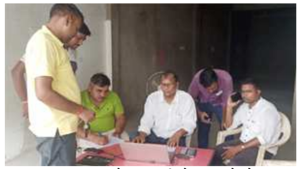
एकमुश्त समाधान योजना का रजिस्ट्रेशन करते लोग।