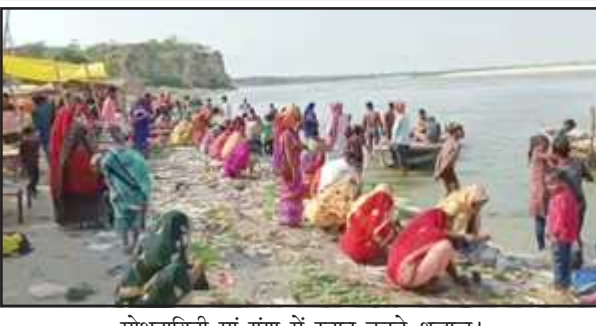
मोक्षदायिनी मां गंगा में स्नान करते श्रद्धालु।

सुरक्षा व्यवस्था का पुलिस अधिकारी लेते रहे जायजा