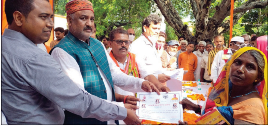
प्रमाण पत्र वितरित करते विधायक व जिलाधिकारी तथा उपस्थित लोग

● विभिन्न विभागों द्वारा संचालित योजनाओं के पात्र लाभार्थियों को आर्थिक सहायता स्वीकृत प्रमाण पत्र किये गये वितरित