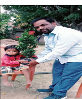
बेटी को पौधा भेंट करते

हुए बेटियों को पढ़ाने एवम आगे बढ़ाने का संकल्प लेने के लिए समाज से आग्रह भी करते हुए यह भी बोले बिन बेटी सब सून इसीलिए बेटियों को आगे बढ़ाने एवम उचित पोषण की आवश्यकता