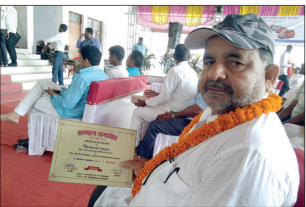
प्रधानों के सम्मान समारोह में सम्मानित प्रधानों का दृश्य