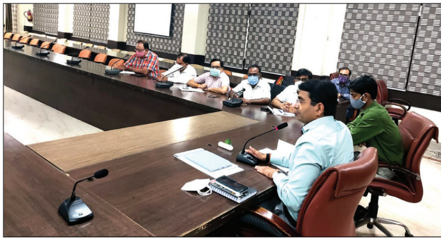
टीकाकरण मेगा अभियान द्वितीय डोज की बैठक की अध्यक्षता करते जिलाधिकारी व अन्य अधिकारी

जायें बैठक में जिला विद्यालय निरीक्षक अनुपस्थित पाये जाने पर स्पष्टीकरण मांगा। उन्होंने कहा है कि