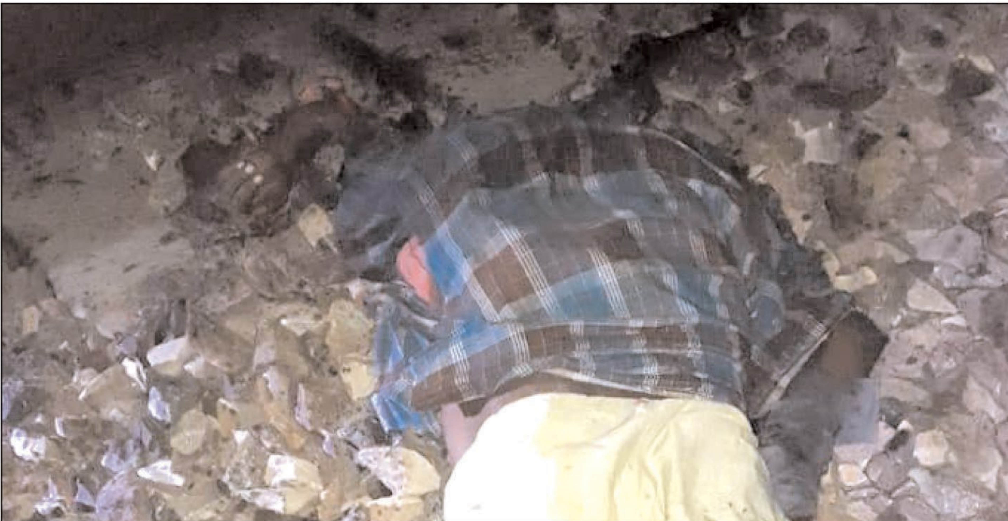
हादसे के बाद घटना स्थल पर पड़ोशकत विक्षत शव।

मृतक की उम्र लगभग 55 वर्ष बताई जाती है काफी प्रयास के बाद मृतक की शिनाख्त नहीं हो सकी है उसके पास से भी पुलिस को कुछ ऐसे अभिलेख नहीं बरामद हुए हैं जिससे मृतक की शिनाख्त हो सके लाश मिलने की सूचना पर आसपास के गांव के तमाम लोग मौके पर जुटे लेकिन किसी ने लाश की पहचान नहीं की है जिससे लगता है कि लाश बाहर से लाकर फेंकी गई है इसके पहले भी हावड़ा दिल्ली रेल लाइन के सैनी और कोखराज थाना क्षेत्र में दर्जनों लावारिस लाशें मिल