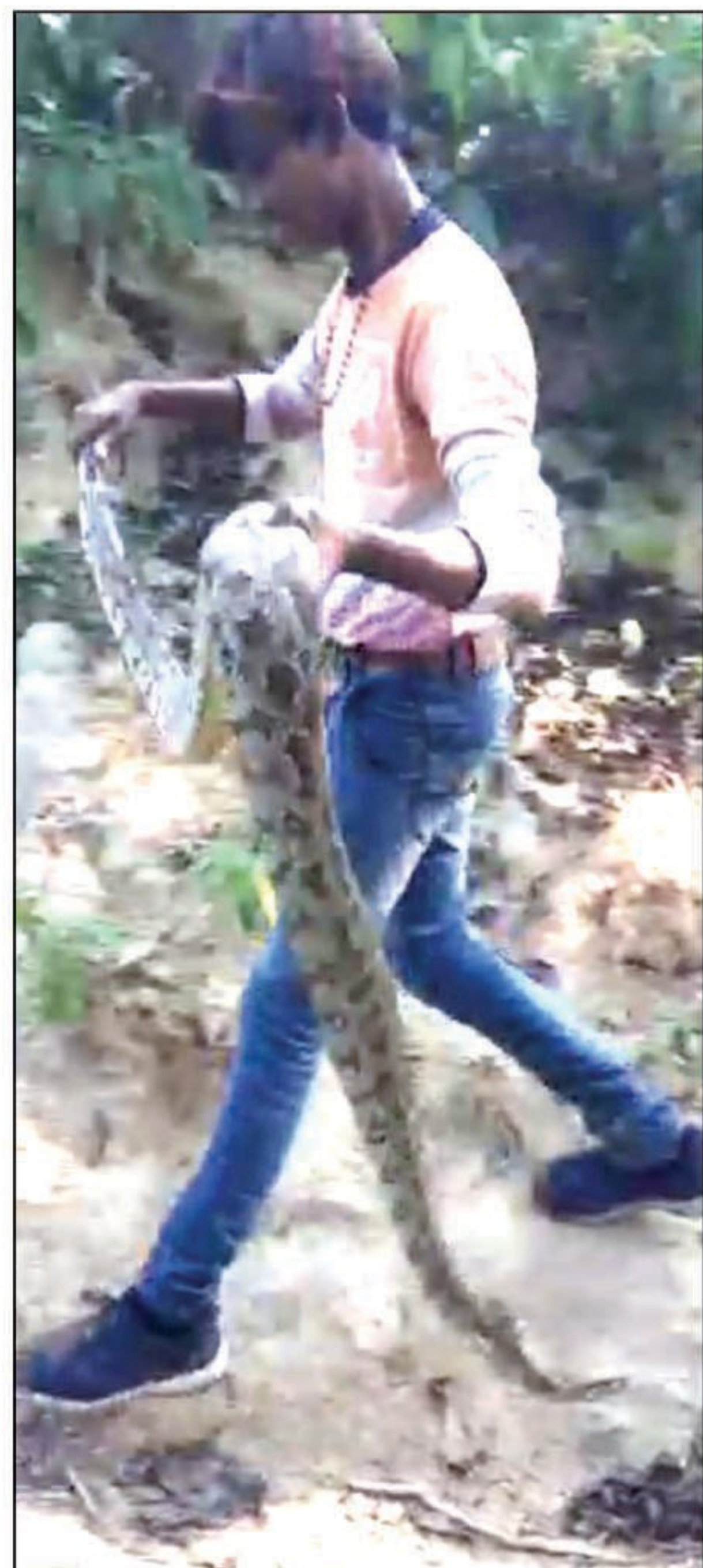
अजगर का दृश्य

नैनी। औद्योगिक क्षेत्र के लवायन कला गांव में सोमवार को अजगर के निकलने से भारी हड़कंप मच गया। ग्रामीणों के अथक प्रयास से उसे पकड़कर 112 नंबर पुलिस को सौंप दिए। जानकारी के मुताबिक सोमवार सुबह लवायन कला गांव के रिहायशी इलाके स्थित एक लगभग 10 फीट का अजगर सड़क से गुजरता हुआ दिखाई पड़ने पर जब लोगों ने उसे पकड़ने का प्रयास किया तो वह एक मंदिर के समीप 15 से लेकर 20 फीट गहरे गड्ढे में चला गया और एक गहरे खिल में प्रवेश करने लगा तो ग्रामीणों ने घंटों प्रयास के बाद उसे हाथों से पकड़ कर बाहर निकाल कर सड़क पर ले आए। जैसे ही उसको बोरे में भरने का प्रयास करने लगे तो उसके मुख से एक मृत जानवर निकला। बताते हैं कि मृत जानवर कब्र बिजु ख था वह जमीन के अंदर रहने वाले जीव जंतु एवं सड़ी गली शवों का सेवन करते हैं। मौका पाते ही अजगर उसे निगल लिया था। हालांकि ग्रामीणों ने अजगर को एक बोरे में भरकर मौके पर पहुंची 112 नंबर की पुलिस को सौंप दिए।