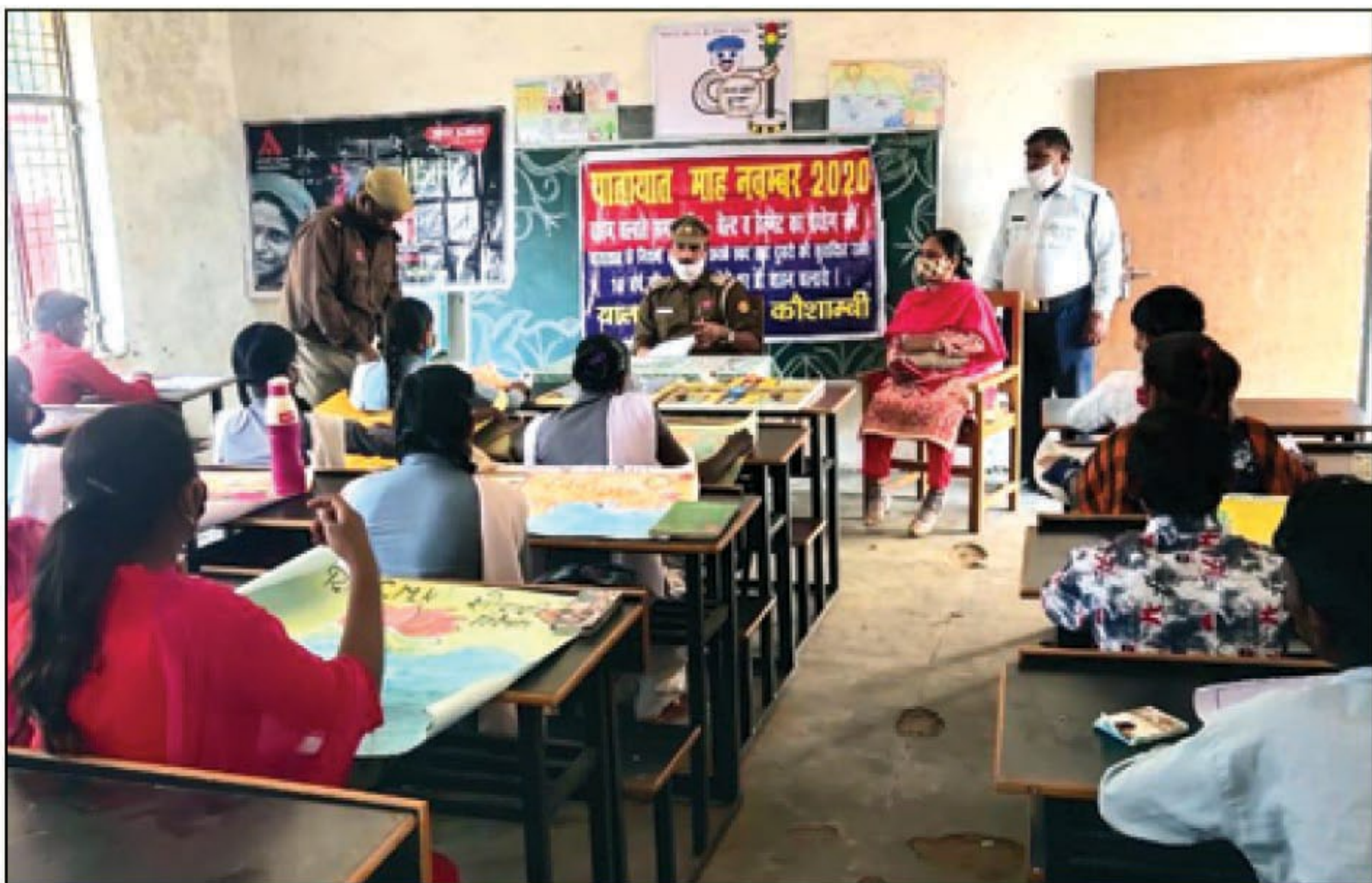
यातायात विषय पर चित्रकला से जागरूक करते।

मंझनपुर में प्राइवेट वाहन विक्रम अप्पे प्राइवेट बस चालक बेलगाम, सड़कों पर लोगों का चलना दुश्वार