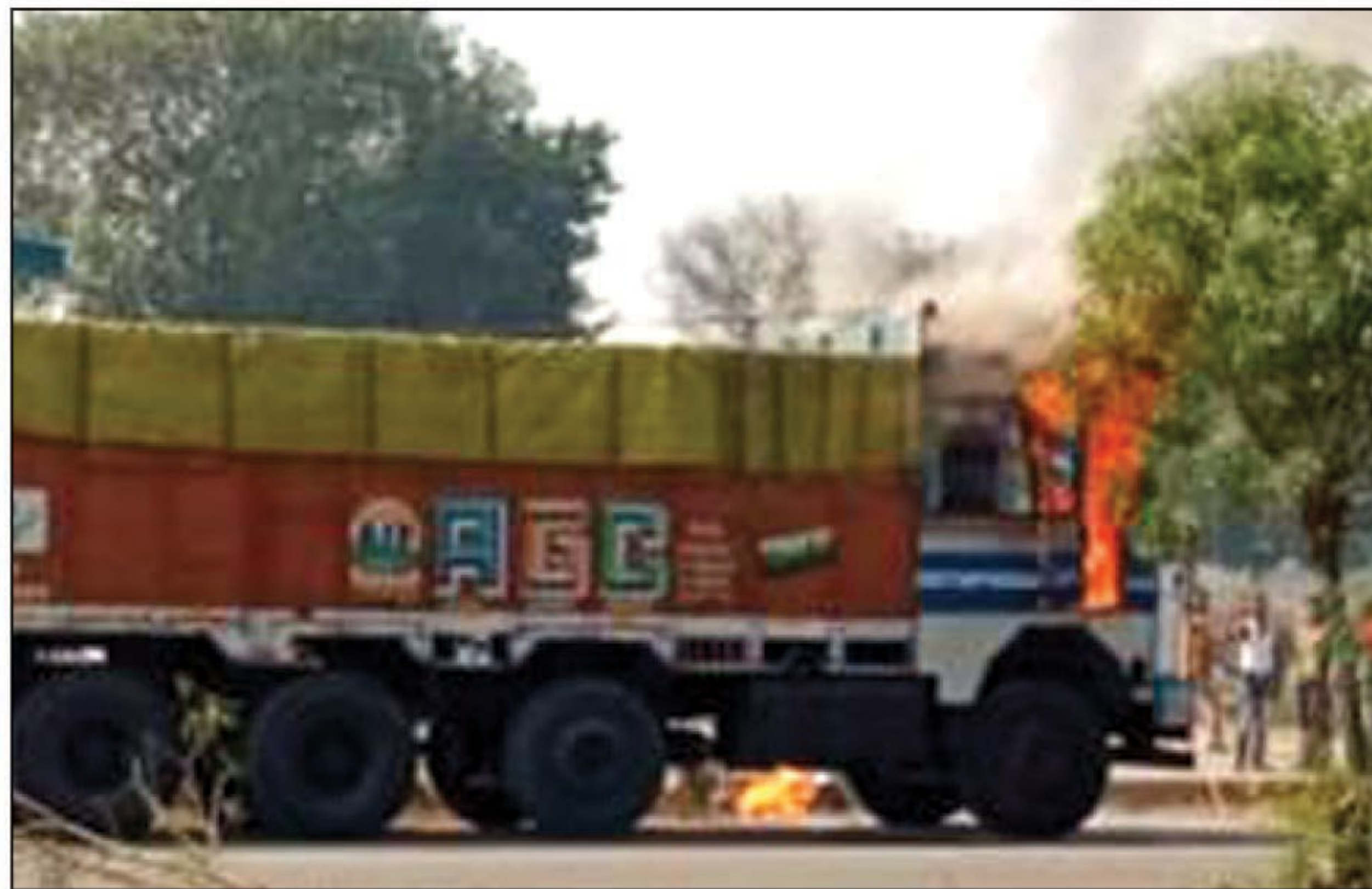
धू-धूकर जलते ट्रक का दृश्य

कल्यानपुर कौशांबी। दिल्ली कोलकाता के राष्ट्रीय राजमार्ग के कोखराज थाना क्षेत्र के कल्यानपुर के पास अचानक एक ट्रक के केबिन में आग लग गई और देखते देखते ट्रक की केबिन तेज लपटों के साथ जलने लगी ट्रक के खलासी और चालक ने ट्रक से कूदकर जान बचाई देखते-देखते ट्रक का आगे का हिस्सा तेज लपटों से जल गया ट्रक में आग लगने की जानकारी मिलते