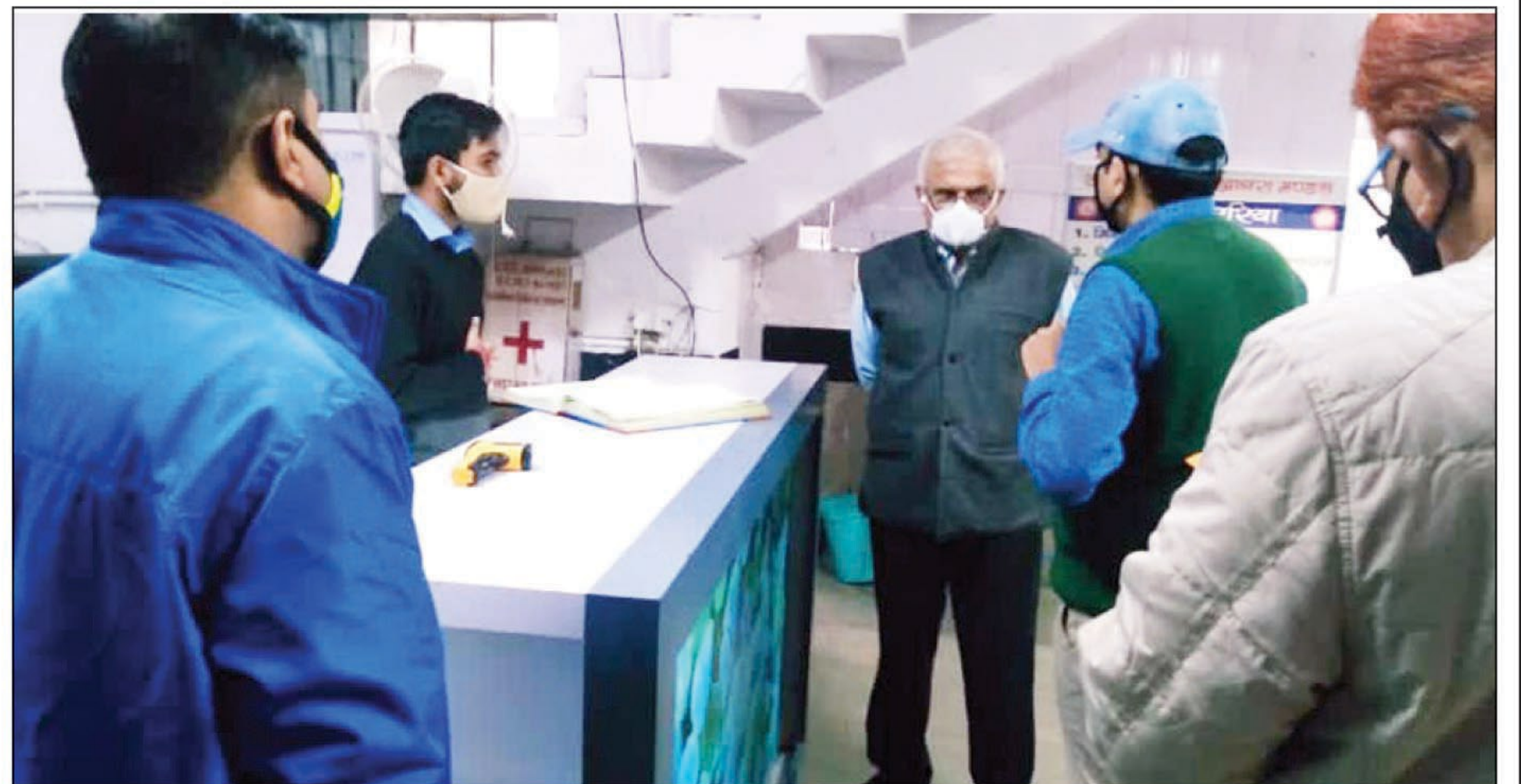
निरीक्षण करते उभरे महाप्रबंधक

निरीक्षण के दौरान महाप्रबंधक के साथ आगरा मंडल के सीनियर डीईई व अन्य अधिकारीगण मौजूद रहे