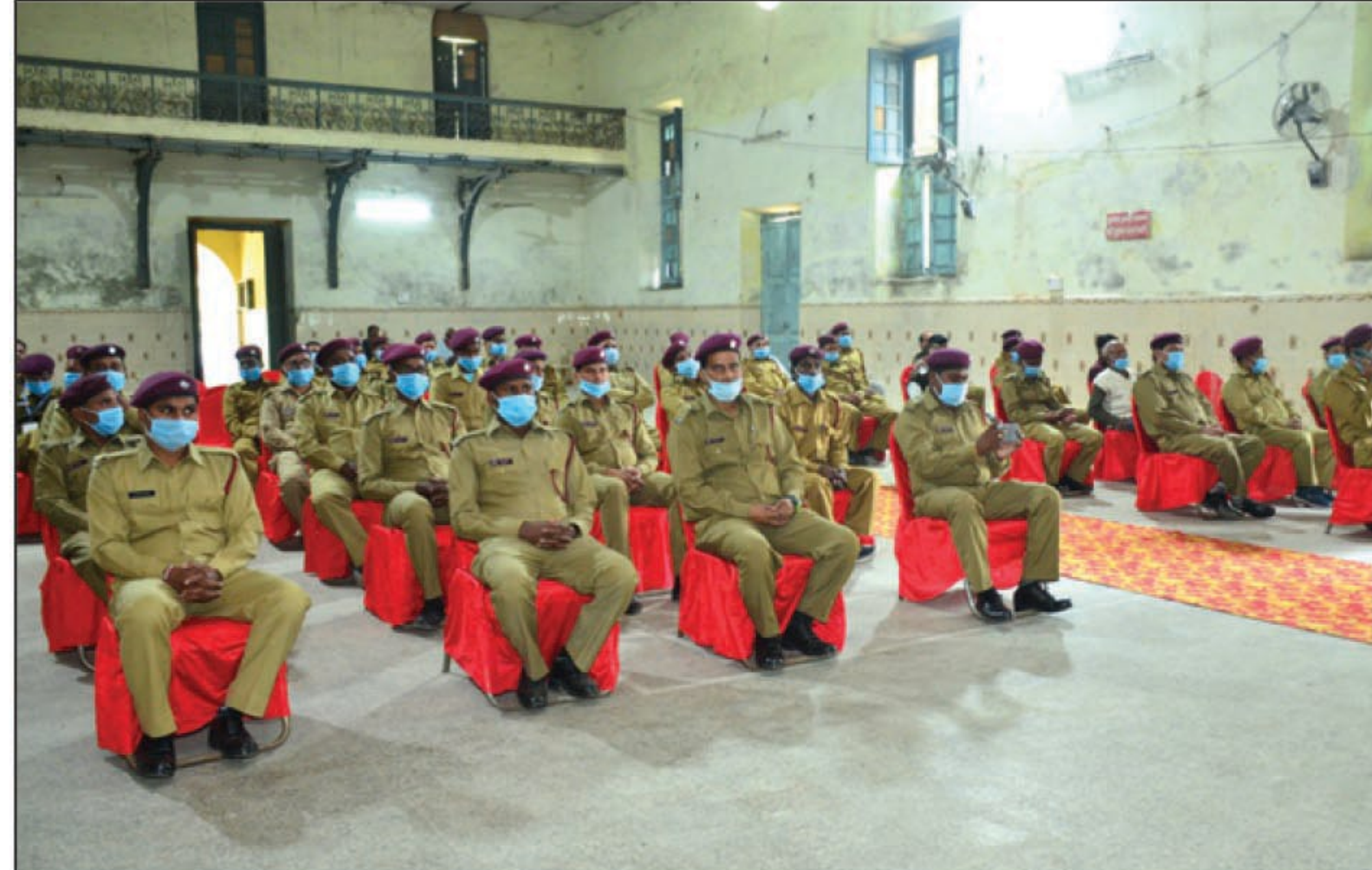
कार्यक्रम में उपस्थित ब्रिगेड के सदस्य व उपस्थित अधिकारीगण