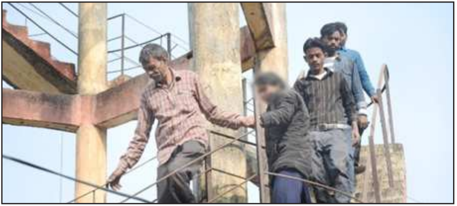
पानी की टंकी पर चढ़ी युवती को उतारते लोग।

बताया जाता है कि युवती का गांव के ही एक युवक से प्रेम हो गया है और लड़के वाले शादी के लिये तैयार नहीं हैं। इससे युवती यह