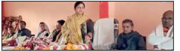
भाजपा के मंच पर उपस्थित अधिशाषी अधिकारी नगर पंचायत।

अधिशाषी अधिकारी के नेतृत्व में बनाई गई मतदाता सूची पर भी हो गए सवाल खड़े