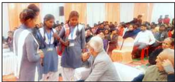
छात्राओं से वार्ता करते प्राचार्य।

जिसकी निगाहें लक्ष्य पर हो, उनकी तकदीर खुदा गढ़ा करता है इरादें मजबूत हो जिनके, उनके किस्से जमाना पढ़ा करता है