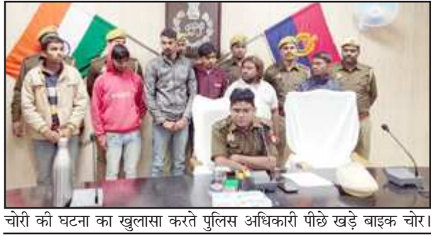
चोरी की घटना का खुलासा करते पुलिस अधिकारी पीछे खड़े बाइक चोर।

अखंड भारत संदेश कौशाम्बी। सराय अकिल पुलिस ने मोटरसाइकिल चोरी करने वाले गिरोह के सदस्यों को गिरफ्तार करने के बाद उनके कब्जे से चोरी की पांच मोटरसाइकिल बरामद की है पुलिस ने आरोपियों से जब कड़ाई से पूछताछ की तो गिरोह के अन्य सदस्यों की जानकारी हुई पुलिस ने चोर गिरोह के छह सदस्यों को गिरफ्तार कर उनके कब्जे से चोरी की 5 बाइक क्रम में अपर पुलिस अधीक्षक के मार्गदर्शन में क्षेत्राधिकारी चायल के पर्यवेक्षण में रात्रि में प्रभारी निरीक्षक सरायअकिल मय हमराह पुलिस बल द्वारा थाना क्षेत्र में हो रहे लगातार मोटरसाइकिल चोरी व अन्य चोरी के सम्बन्ध में रात्रि