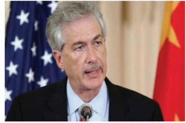
पुतिन ने परमाणु युद्ध के खतरों को लेकर आगाह इससे पहले, पुतिन ने कहा कि यूक्रेन युद्ध अभी और लंबा खिंचने वाला है। उन्होंने परमाणु युद्ध के बढ़ते खतरों को लेकर भी

आगाह किया। पुतिन ने क्रेमलिन में रूसी मानवाधिकार परिषद की