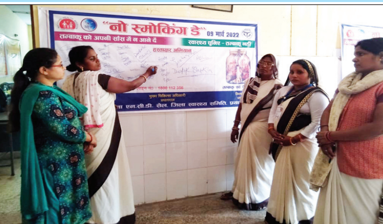
राष्ट्रीय धूम्रपान निषेध दिवस पर हस्ताक्षर करती महिलाएं