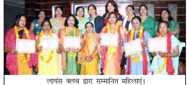
लायंस क्लब द्वारा सम्मानित महिलाएं।

समाज को नई दिशा दे रही नारी शक्तियों को किया गया सम्मानित