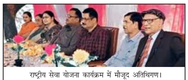
राष्ट्रीय सेवा योजना कार्यक्रम में मौजूद अतिथिगण।