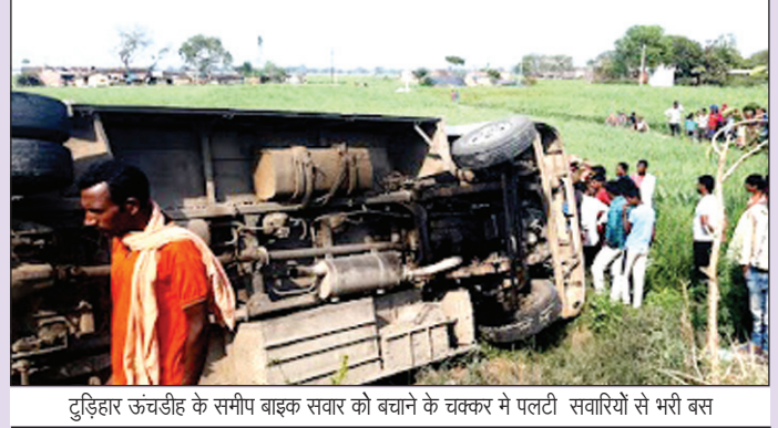
टुड़िहार ऊंचडीह के समीप बाइक सवार को बचाने के चक्कर में पलटी सवारियों से भरी बस