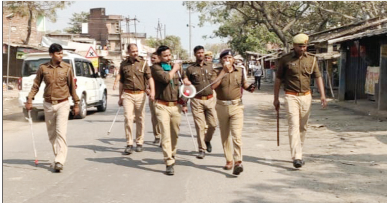
सुरक्षा व्यवस्था का जायजा लेते पुलिस अधीक्षक कौशाम्बी

दिन बीत जाने के बाद अवैध कब्जा धरकों पर तहसील प्रशासन कारवाही नहीं कर सका है जिससे अवैध कब्जा पूरे दिन चलता रहा यदि चचाओं पर जाए तो लेखपाल ने राजस्व अधिकारियों को साधने के नाम पर कब्जा धरकों से डेढ़ लाख की रकम वसूल कर कब्जा करने की हट्ट दे दी है अब सवाल उठता है कि कब तक सरकारी भूमि पर कब्जे का लुका छुपी का खेल चलता रहेगा या फिर आला अधिकारी अवैध कब्जे को रोकने और सल्लित लेखपाल पर कार्यवाही कर भू माफियाओं को कठोर चेतावनी देंगे।