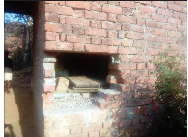
दीवाल में संध का दृश्य