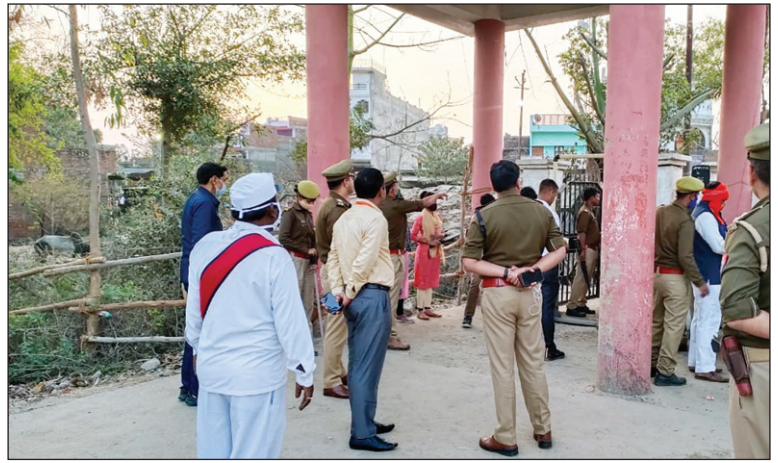
मंडी समिति के बाहर खड़े कार्यकर्ता

सिराथू विधानसभा का नहीं घोषित हुआ परिणाम, जिले के तीनों सीटों पर भाजपा का सूपड़ा होता दिख रहा साफ