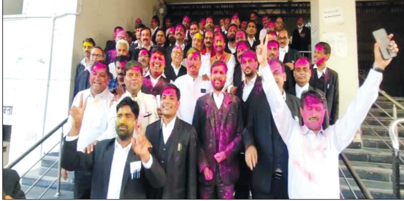
जीत के जश्न में अबीर गुलाल खेले अधिवक्ता