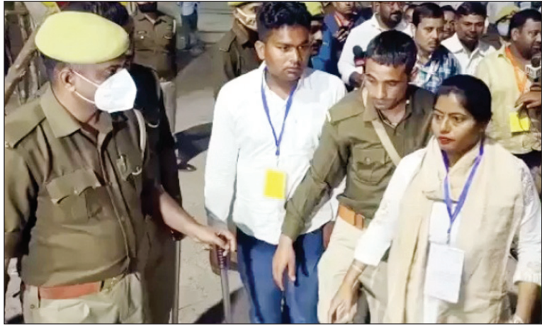
मतगणना स्थल पर उपस्थित सपा प्रत्याशी व अन्य