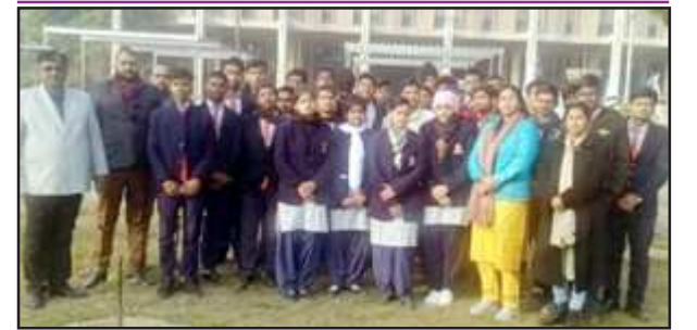
आईआईटी कानपुर से निकलते न्यू एंजिल्स स्कूल के बच्चे।

आनन्द लिया। सभी बच्चे बहुत खुश थे कुछ बच्चों ने तो आई. आई.टी. कानपुर, से निकट भविष्य प्रतापगढ़ की ओर देर रात पहुंचे।