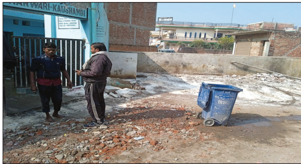
शौचालय परिसर की सफाई करते सफाई कर्मी