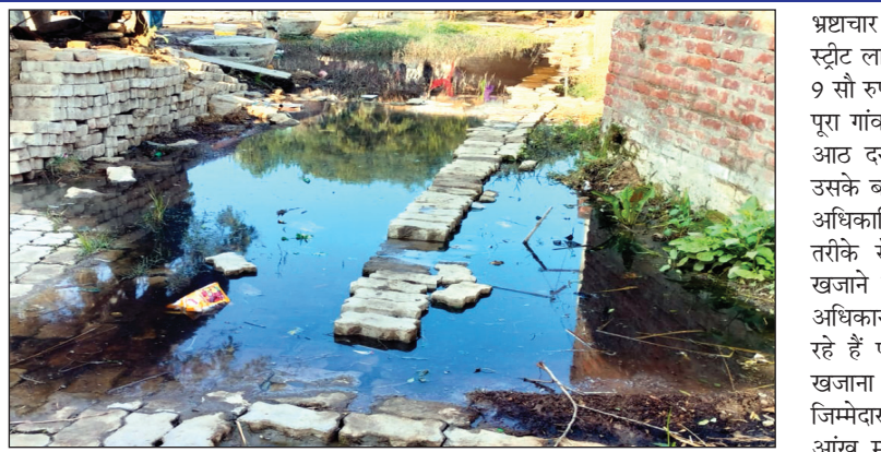
बिरौली गांव में व्याप्त गंदगी

धनराशि फर्जी बिल के जरिए निकाल ली गई है लेकिन गांव में हंडपंप ठीक नहीं हो सके नाली मरम्मत के नाम पर भी 1 लाख 17 हजार 232 रुपए निकाल लिया गया लेकिन अभी भी पूरे गांव में गंदगी व्याप्त है नाली का निर्माण मानक के अनुसार नहीं हो सका है पंचायत भवन में मरम्मत डेंटिंग पेंटिंग के नाम पर बिना कार्य कराए 3 लाख 43 हजार 404 रुपए की रकम निकाल ली गयी खुलेआम पंचायत के जिम्मेदारों से कमीशन खोरी कर धूतराष्ट्र बने हुए है। बिरौली ग्राम में टाइल्स कार्य में 1 लाख 12 हजार 169 रुपए निकाले जा चुके हैं लेकिन टाइल्स किस क्वालिटी की कहाँ लगाई गई है इसको बताने के लिए कोई जिम्मेदार तैयार नहीं है जीता का पुरवा में टाइल्स निर्माण के नाम पर रकम निकाली जा चुकी