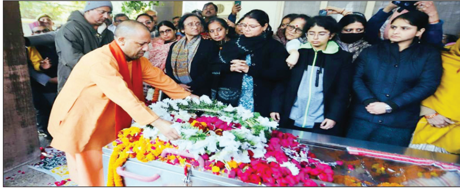
स्वर्गीय श्री केशरी नाथ त्रिपाठी जी के पार्थिव शरीर पर पुष्प अर्पित करते मुख्यमंत्री योगी आदित्यनाथ

प्रयागराज। मुख्यमंत्री श्री योगी आदित्यनाथ जी रविवार को पश्चिम बंगाल के पूर्व राज्यपाल एवं उत्तर प्रदेश विधानसभा के पूर्व अध्यक्ष स्व० श्री केशरीनाथ त्रिपाठी जी के आवास पर पहुंचकर उनके निधन पर गहरा शोक व्यक्त किये तथा उनके पार्थिव शरीर पर पुष्पांजलि अर्पित करते हुए विनम्र श्रद्धांजलि दी, तथा ईश्वर से उनकी आत्मा की शांति के लिए प्रार्थना की एवं शोक संतप्त परिवार के प्रति शोक संवेदना व्यक्त की। मुख्यमंत्री जी ने मीडिया से मुखातिब होते हुए कहा कि स्व० श्री केशरीनाथ त्रिपाठी जी भारतीय जनता पार्टी के एक वरिष्ठ नेता थे। वे एक विचारवान, वरिष्ठ कार्यकर्ता थे। कहा कि उन्हें जो भी दायित्व सौंप गये, उसका उन्होंने सफलतापूर्वक निर्वहन किया। मुख्यमंत्री जी ने कहा कि उनकी एक विचारधारा के प्रति प्रतिबद्धता, समाज के प्रत्येक तबके को साथ लेकर