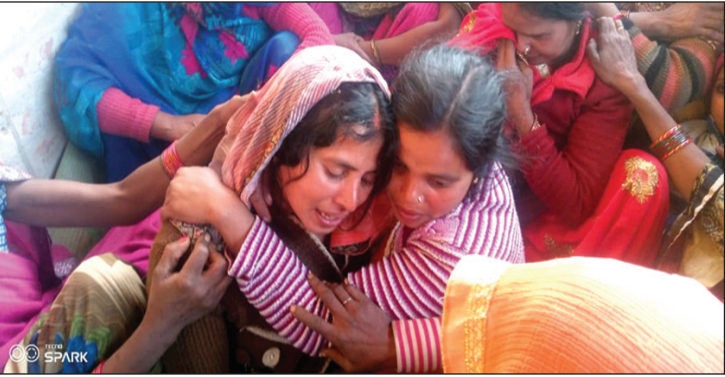
रोते बिलखते परिजन

बाइक सवार दोनों युवक चायल क्षेत्र में अपनी बहन के घर त्यौहार का सामान लेकर जा रहे थे