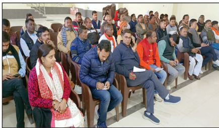
भाजपा की बैठक में उपस्थित पार्टी नेता

शिक्षक एमएलसी एवम सहकारिता चुनाव को लेकर पार्टी कार्यालय में बैठक आयोजित