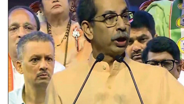
उद्भव टाकरे की अगुवाई वाली शिवसेना (यूबीटी) और शरद पवार की अगुवाई वाली एनसीपी (एसपी) ने मुंबई में एक बैठक के

शिव सेना (यूबीटी) नेता उद्भव टाकरे ने आज कहा कि कई लोगों को लगने लगा है कि स्कूल में लड़कियां सुरक्षित नहीं हैं। कल के बंद में सिर्फ महाविकास अघाड़ी ही नहीं बल्कि सभी नागरिक हिस्सा लेंगे। महा विकास अघाड़ी (एमवीए) ने ठाणे जिले के बदलापुर में एक स्कूल में दो युवतियों पर कथित यौन उत्पीड़न के विरोध में 24 अगस्त को एक दिवसीय 'महाराष्ट्र बंद' का आह्वान किया है। एमवीए के विभिन्न सहयोगी दलों - कांग्रेस,