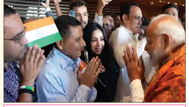
भारत की 'योग कूटनीति' इस बार होगी फेल...पीएम मोदी की यूक्रेन यात्रा पर चीनी ग्लोबल टाइम्स ने कसा तंज

कीव प्रधानमंत्री मोदी सुबह 7:30 बजे (स्थानीय समयानुसार) कीव पहुंचे और भारतीय समुदाय से बातचीत की। उड़ान भरने के बजाय, उन्होंने ट्रेन फोर्स वन के माध्यम से 10 घंटे की यात्रा की, एक विशेष रूप से डिजाइन की गई उच्च सुरक्षा वाली ट्रेन जो कीव के माध्यम से एक आरामदायक यात्रा प्रदान करती है, जिसमें शानदार सुविधाएं और कार्यकारी स्तर के काम और विश्राम सुविधाएं शामिल हैं। युद्ध के कारण कीव को अपना हवाई क्षेत्र बंद करना पड़ा, इसलिए यात्रा के लिए ट्रेन को सबसे सुरक्षित विकल्प माना गया।