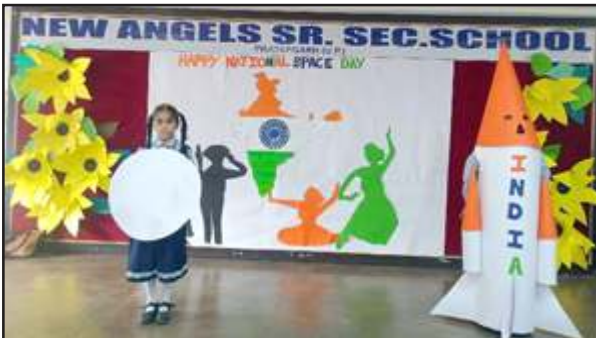
नेशनल स्पेस डे के मौके पर प्रदर्शनी का आयोजन करते बच्चे।