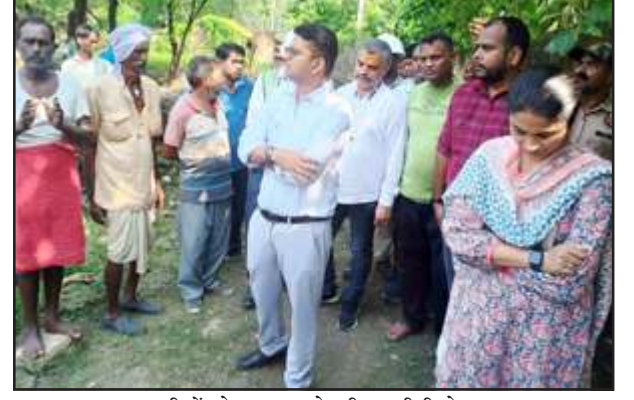
ग्रामीणों से बात करते डीएम-सीडीओ।

शुक्रवार को जिलाधिकारी ने ग्रामीणों से कहा कि ये शुद्ध पेयजल दिया जा रहा है, पानी को बर्बाद न करें। जितनी जरूरत हो, उसी अनुसार उपयोग करें। एक्सईएन जल निगम एके भारती