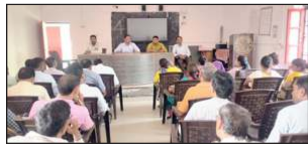
शिक्षकों को निर्देश देते एबीएसए।

राज्य परियोजना कार्यालय उप्र से निर्धारित समय सीमा अनुसार रामनगर ब्लॉक के 23 प्राथमिक विद्यालयों को अक्टूबर तक, 40 प्राथमिक विद्यालयों को दिसंबर, शेष 60 प्राथमिक विद्यालयों को फरवरी 2025 में निपुण विद्यालय घोषित करने का लक्ष्य है। खंड शिक्षाधिकारी ने सभी शिक्षकों की कई बार बैठक की है। प्रथम चक्र में निपुण घोषित 23 विद्यालयों के प्रधानाध्यापकों के साथ इन विद्यालयों में कक्षा 1, 2, 3 में हिंदी भाषा व गणित विषय का शिक्षण कार्य करने वाले शिक्षकों की सम्मिलित बैठक हुई। उनसे विद्यालय में कक्षा 1, 2, 3 में अध्वनरत विद्यार्थियों की हिंदी