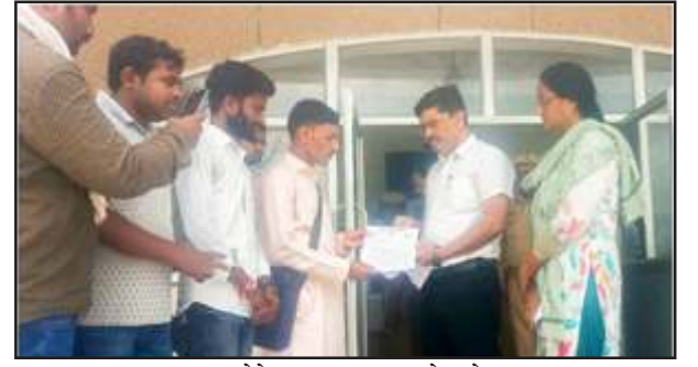
ज्ञान देते प्रभास महासभा के लोग।

शुक्रवार को प्रभास महासभा ने बुंदेलखंड के बेरोजगार व पलायन को मजबूर नौजवानों के लिए बुंदेलखंड के प्रत्येक जिले में कैम्पेडियों व उद्योग-धंधों की स्थापना कराने की मांग को लेकर प्रधानमंत्री संबोधित ज्ञान एसडीएम कर्वाी को सौंपा।