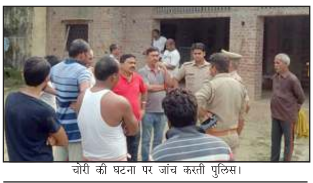
चोरी की घटना पर जांच करती पुलिस।

लालगंज, प्रतापगढ़। गुरुवार की रात अज्ञात चोरों ने पत्रकार समेत दो घरों में चोरी की घटना को अंजाम देते हुए नगदी समेत लाखों के आभूषण को उठा ले गए। परिजनों को घटना की जानकारी सुबह हुई तो वह अवाक रह गए। सूचना पर पहुंची पुलिस ने घटना की जानकारी लेने के बाद जांच में जुट गई।