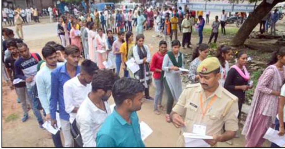
परीक्षा केन्द्र के बाहर अभ्यर्थियों के कागजात चेक करते पुलिस कर्मी।

जिले के सभी 11 परीक्षा केन्द्रों पर 42240 परीक्षार्थी सूचीबद्ध हैं जिसमें अबुल कलाम इंटर कालेज, डीएवी इंटर कालेज, लोकमान्य तिलक इंटर कालेज व मथुरा इंटर कालेज चिलबिला कोट में प्रत्येक केन्द्र पर 240 परीक्षार्थी, राजकीय इंटर कालेज, केपी हिन्दू