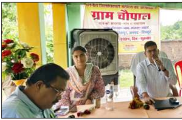
गांव में समस्या सुनते डीएम।