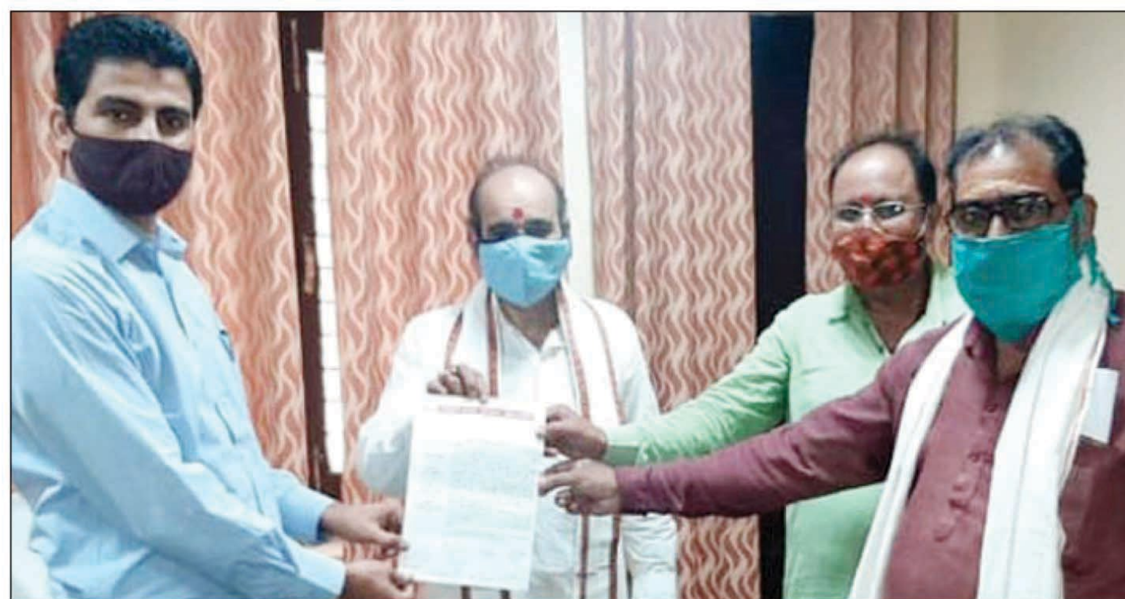
मेलाधिकारी को ज्ञापन सौंपते

प्रयागराज। आगामी माघ मेला में संस्थाओं द्वारा पूर्ण रूप से गत वर्ष की भांति बसाने एवं कोविड 19 की भांति बसाने का बोधना पर त्रिवेणी संस्थाओं की संख्या में कटौती न कर बसाने की मांग त्रिवेणी संस्था कल्याण महासमिति के पदाधिकारियों ने ज्ञापन सौंपा है। ज्ञापन के माध्यम से मांग की गई है कि माघ मेला 2020-21 का आयोजन होने हेतु मुख्यमंत्री एवं उपमुख्यमंत्री की ओर से कल्याण व अनुष्ठान हेतु मेला बसाने को