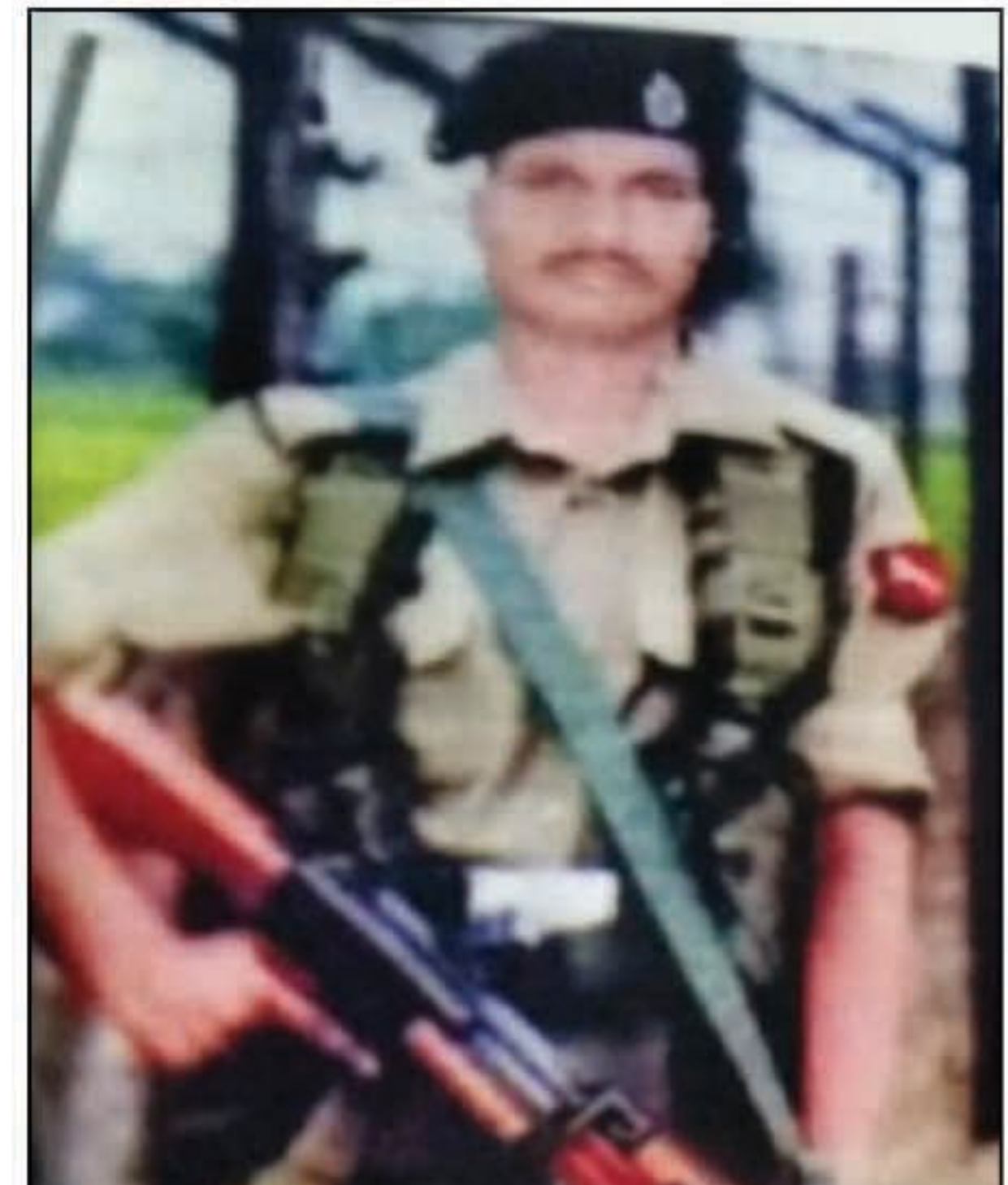
बीएसएफ का जवान

चला। वही फोन पर सम्पर्क न होने विवाहिता के घर वाले जब उसके घर कुछ दिन बाद पहुंचे तो पता चला कि बेनीगंज का मकान बेचकर वह परिवार के साथ फरार हो गया है। इतना सुनकर विवाहिता के परिवारजनों के कान खड़े हो गए। विवाहिता का संपर्क आज तक बीएसएफ के जवान और उनके घर वालों से नहीं हो सका। फिर हाल देश की रक्षा करने वाला जवान द्वारा एक विवाहिता के साथ धोखाधड़ी किया गया। जिस पर विवाहिता ने डीएम,