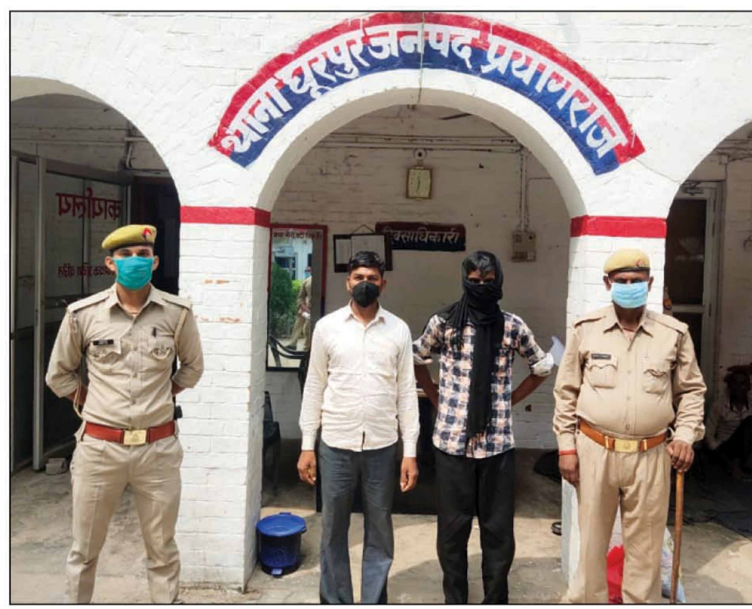
पुलिस के कब्जे पुलिस के दो हमलावर

घूरपुर के कंजासा गांव के यमुना घाट पर अवैध बालू खनन की सूचना पर 10 मई की रात घूरपुर पुलिस टीम जांच करने गई थी। इसी बीच बालू माफियाओं धावा बोलकर पुलिस टीम पर हमला कर दिया था जिसमें कई पुलिस कर्मियों को चोटें भी आई थीं और पुलिस की सरकारी जीप भी बुरी तरह से क्षतिग्रस्त हो गई थी। जिस मामले पुलिस ने ग्यारह बालू माफियाओं को नामजद करते हुए सौ अज्ञात लोगों के खिलाफ पुलिस ने संगीन धाराओं में केस दर्ज