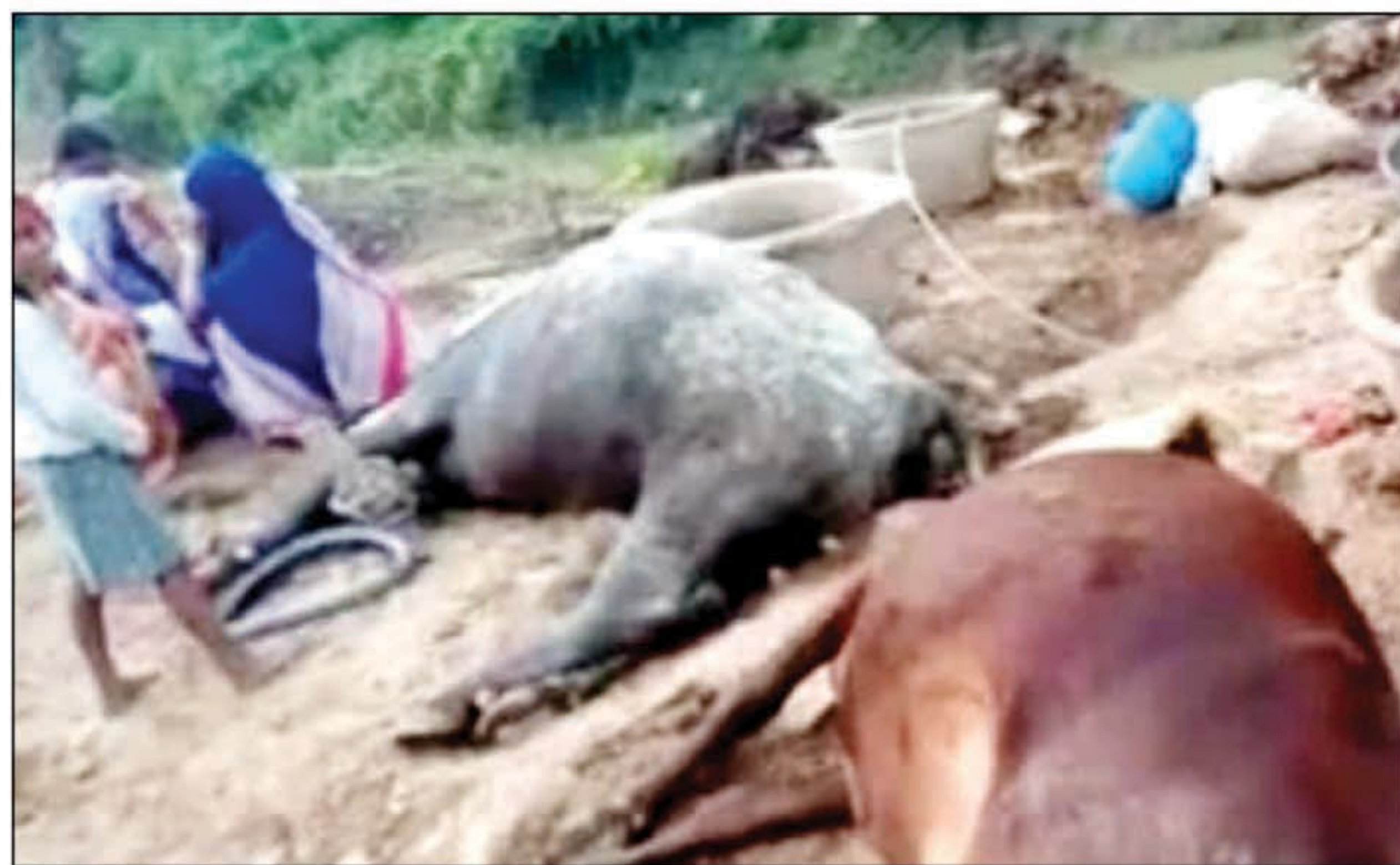
जर्जर बिजली का तार गिरने से मृत मवेशी

प्रयागराज। माण्डा क्षेत्र के चिलबिला गाँव में रविवार की भोर में बिजली का तार मवेशियों के ऊपर गिर गया जिससे चार की मौके पर ही दर्दनाक मौत हो गई, जबकि एक मवेशी की हालत गम्भीर बताई जा रही है। दिधिया चौकी क्षेत्र के चिलबिला अहिरान इलाके में रविवार की भोर तकरीबन 3 बजे के आसपास ऊपर से गुजरा जर्जर ग्यारह हजार बोल्टेज का तार टूटकर नीचे मवेशियों के ऊपर जा गिरा जिससे चार मवेशियों की मौके पर ही दर्दनाक मौत हो गई। सुबह परिजन मवेशियों को चारा देने गए तो नजारा देख होश उड़ गए और इलाके में अफरा तफरी मच गई। सूचना पर दिधिया चौकी प्रभारी