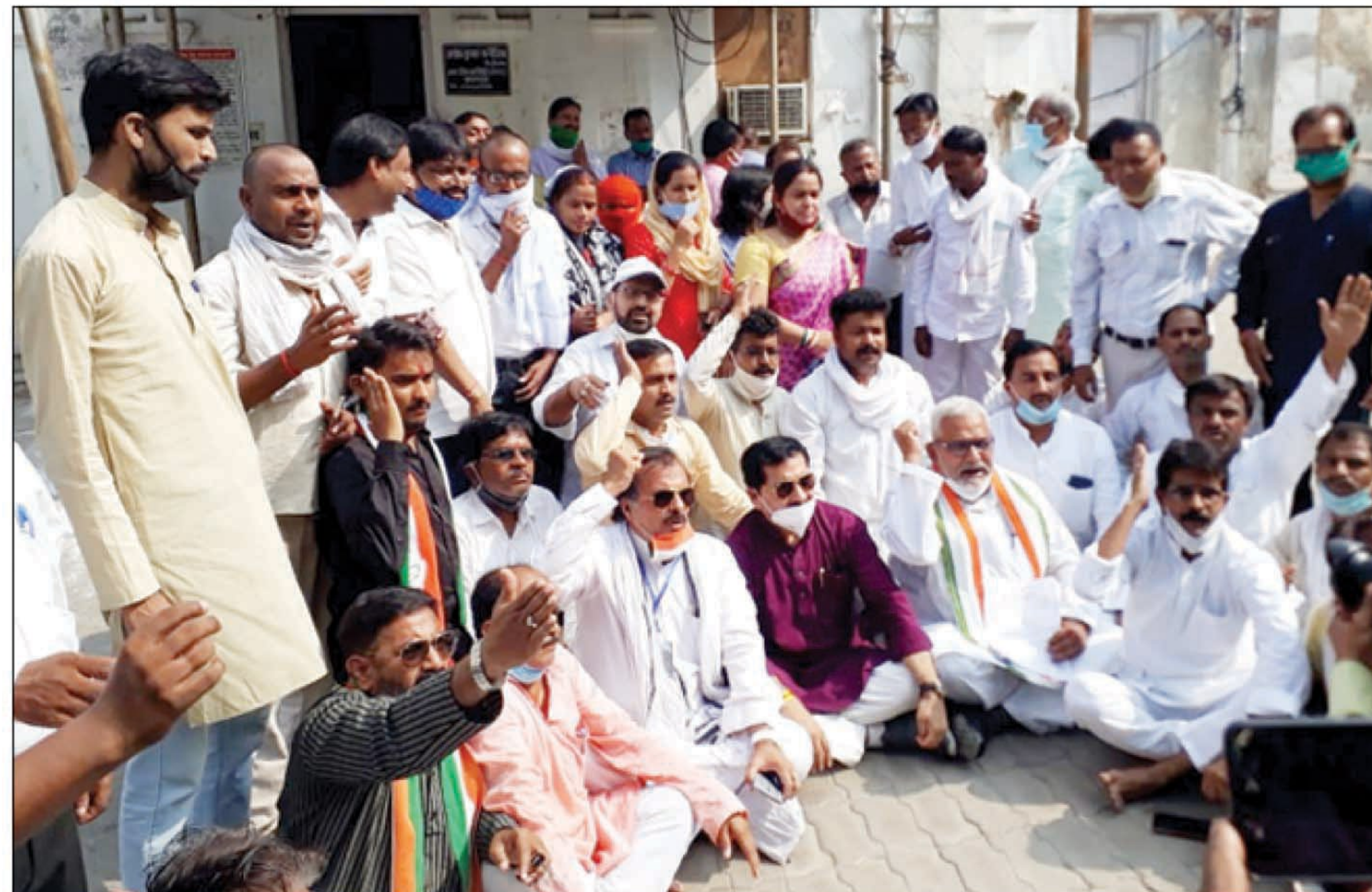
धरना पर बैठे कांग्रेसी कार्यकर्ता

सरकार अपराधियों पर लगातार लगाने में नाकाम हो गयी है। हमारे समाज में अब बेटियां सुरक्षित नहीं हैं। इस तरह की घटना आवे दिन हो रही है सरकार जब बेटियों की सुरक्षा नहीं कर सकती तो ऐसी सरकार को इस्तीफा दे देना चाहिए। देशभर में बेटियां को न्याय को लेकर धरना प्रदर्शन हो रहा है। जिस प्रकार से बड़े से लेकर छोटे अधिकारियों तक इस कार्य में लापरवाही बरती गई। यह सरकार की तानाशाही रवैया को दर्शाती है। आखिर अधिकारी किस बात के सबूत को मिटाना चाहते थे कि वहां मीडिया कर्मियों को भी जाने से रोका गया। राहुल प्रियंका जी को रोका गया लाटियां बरसाई गईं। यह विभाग का धिम्पना चेहरा आम जनमानस के सामने आ चुका है। अब वक्त आ गया है समाज को मिटाना चाहते थे कि सड़क की जनता सब कुछ जानती है भारतीय जनता पार्टी को आगामी विधानसभा चुनाव में जनता इसका मुंहतोड़ जवाब देगी।