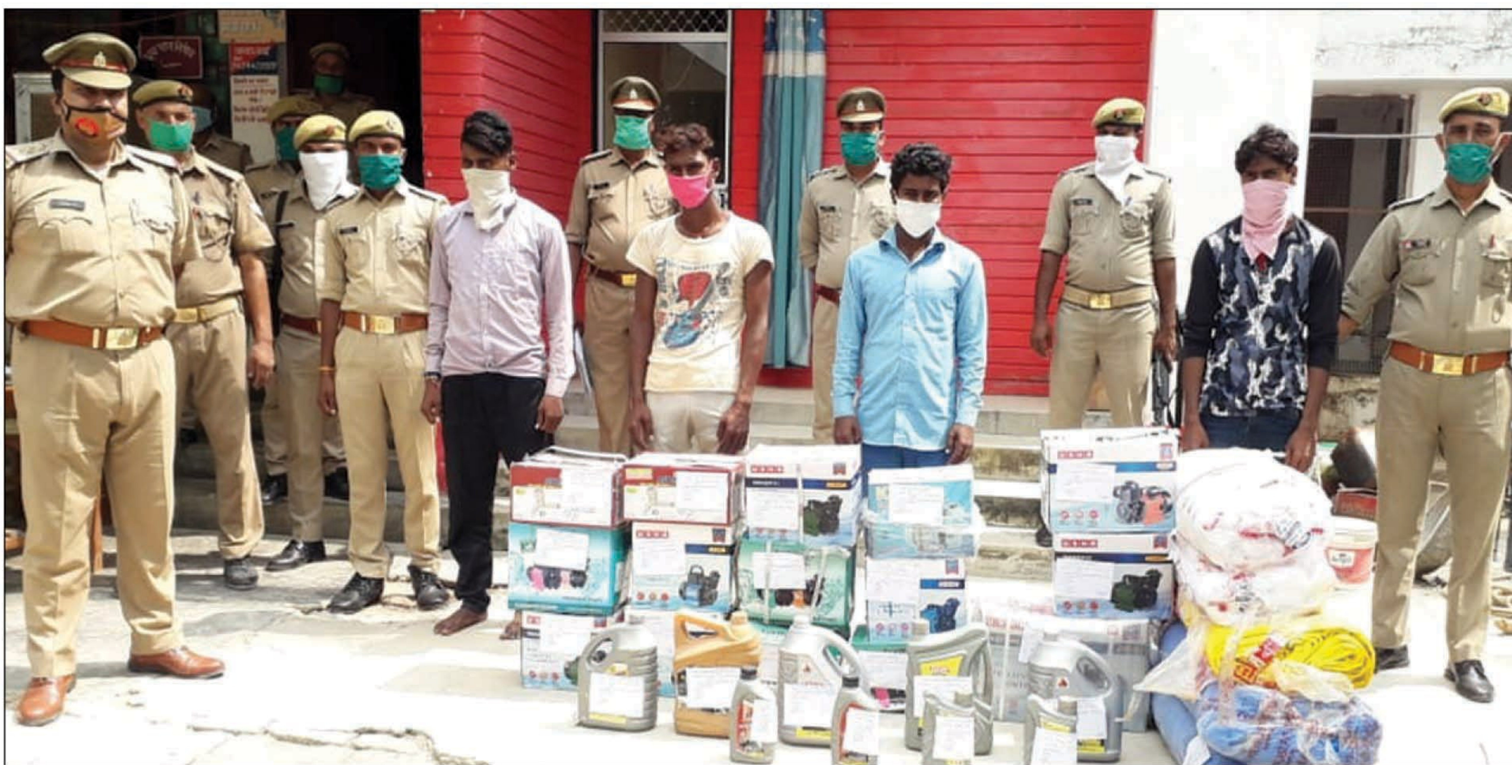
बरामद चोरी के सामान संग चोर

प्राप्त जानकारी के मुताबिक होलागढ़ थाना क्षेत्र के रामदासपुर स्थित नहर के समीप एक हार्डवेयर की दुकान में लगभग दस दिन पहले रात में लाखों का सामान