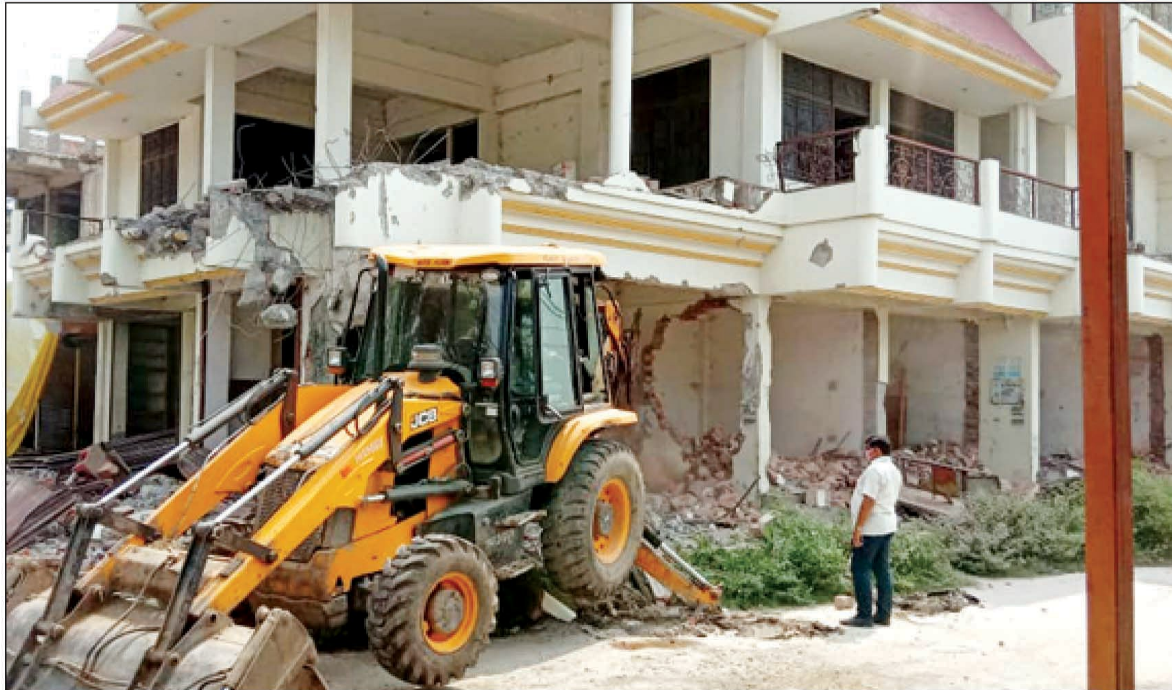
मसिका मोड़ के निकट बने तीन मंजिला लाज को ध्वस्त करने की कार्यवाही करता प्रशासन व पीडीए का बुलडोजर

कई थानों की पुलिस फोर्स व पीडीए विभाग की टीम समेत आला अफसर रहे मौजूद