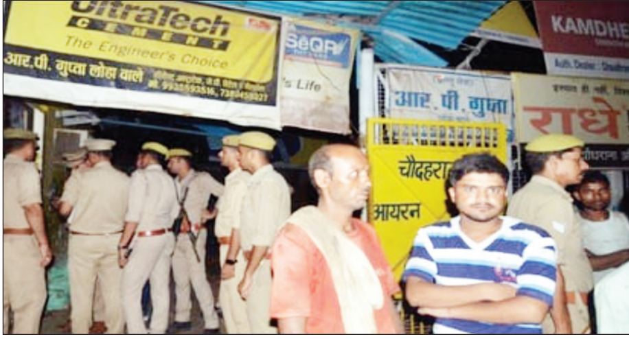
लूट की घटना के बाद घटनास्थल पर पुलिस तहकीकात व पूछताछ करती।

दाखिल कर कोर्ट को बताया गया है कि चार फोटो कॉपी मशीन नष्ट फाइलों को बनाने के लिए महाधिवक्ता कार्यालय में लगा दी गई है जो अब काम करने लगी है। यही नहीं सरकारी की तरफ से शासकीय अधिवक्ता ने बताया की जले हुए रिपोर्टों को बनाने में वकीलों के ऊपर सरकार कोई अतिरिक्त बोझ नहीं डालेगी। नष्ट हुई फाइलों को बनाने का खर्च सरकार स्वयं वहन करेगी। बताया गया कि सरकार इस मामले पर गंभीर है। प्रमुख सचिव ला स्वयं कोर्ट के निर्णय को पूरा करने के लिए सतत वह निरंतर कार्य कर रहे हैं। कहा गया कि कितनी फाइलें जली हैं और वह कौन-कौन सी फाइलें हैं। इसकी सूचना वकीलों को भी सार्वजनिक नोटिस एवं बार एसोसिएशन के माफ्त दी जाएगी ताकि उनके सहयोग