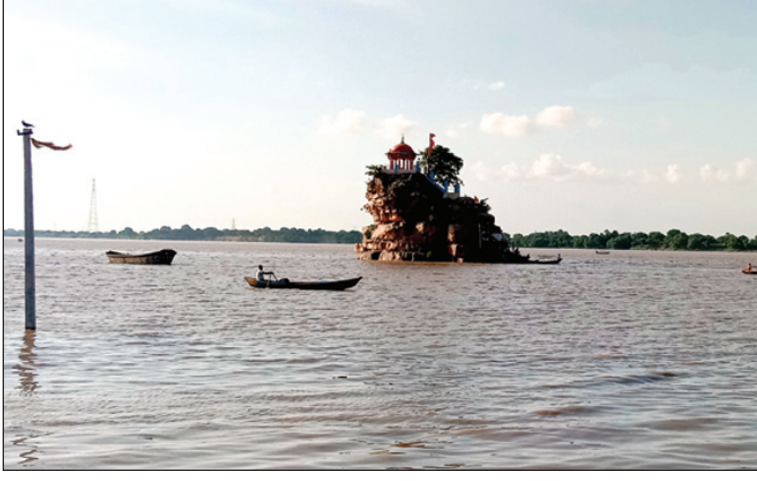
निमार्णाधीन शवदाह गृह डूबी बारादरी में प्रवेश करने को बेताब व सुजावन देव मंदिर यमुना के उफान की चपेट में

कई गांवों के मुहाने पर दस्तक दी बाढ़ का पानी, सुजावन देव मंदिर बाढ़ की चपेट में, हजारों बीघे खरीफ की फसल सहित हरी सब्जियों की खेती डूबी