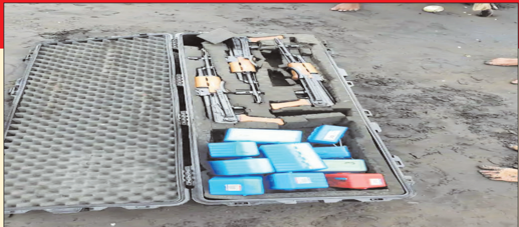
के अनुसार अभी तक हमें कोई टेरर एंगल नजर नहीं आया है, लेकिन जांच के बाद ही सबकुछ साफ हो सकेगा।

था। हाई टाइड की वजह से रायगढ़ तट पर पहुंची बोट फडणवीस ने बताया कि हाई टाइड होने के कारण इस बोट की टोइंग नहीं की जा सकी और यह तैरते हुए श्रीवर्धन के समुद्री तट पर पहुंच गई। इंडियन कोस्ट गार्ड ने इसकी पुष्टि की है। हमने अभी तक सुरक्षाबलों को हाई अलर्ट पर रखा है। नाकाबंदी भी जारी है। हम सभी एंगल को ध्यान में रखकर जांच को आगे बढ़ा रहे हैं। क्योंकि फेरिस्टवल सीजन है कोई भी रिस्क नहीं लिया जा सकता। टेरर एंगल के सवाल पर फडणवीस ने कहा- प्राथमिक जानकारी के अनुसार अभी तक हमें कोई टेरर एंगल नजर नहीं आया है, लेकिन जांच के बाद ही सबकुछ साफ हो सकेगा।