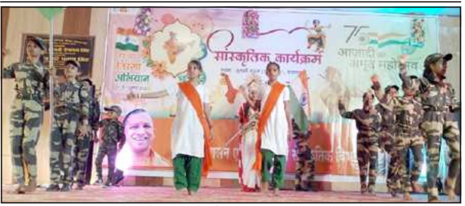
तुलसी सदन में आयोजित समारोह में सांस्कृतिक कार्यक्रम प्रस्तुत करते बच्चे।