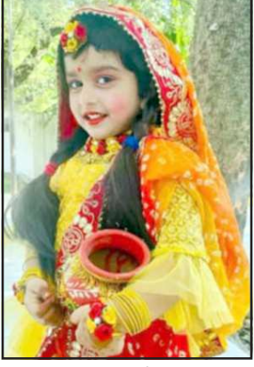
कल्याणपुर गाँव में राधा की वेषभूषा में सजी लड़की।

लालगंज, प्रतापगढ़। वृहस्पतिवार को श्री कृष्ण जन्मोत्सव के पूर्व दिवस पर क्षेत्र के संस्थानों व गाँवों में धूम-धाम से जन्म दिवस मनाया गया। स्थानीय क्षेत्र के लखनसेमपुर, रानीगंज के थोला बाजार, लालगंज, सांगीपुर व समरा बाजार में लोगों बड़ी धूम-धाम के साथ श्री कृष्ण जन्मोत्सव को मनाया। इस दौरान छोट-छोटे बच्चों ने राधा-कृष्ण के रूप में सज कर झांकियां निकाली। राधा-कृष्ण के