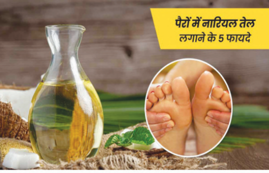
पैरों में नारियल तेल लगाने के 5 फायदे

शरीर की मालिश करने से सेहत को कई फायदे मिलते हैं। यह शरीर को स्वस्थ रखने और गंभीर रोगों से बचाने का एक आसान तरीका है। आप सिर से लेकर पैर तक शरीर के सभी अंगों की मालिश कर सकते हैं। शरीर की मालिश के लिए देसी घी, सरसों का तेल, नारियल तेल आदि का प्रयोग करते हैं। सभी के अपने अलग लाभ हैं। लेकिन क्या आप जानते हैं, कुछ मामलों नारियल तेल से मालिश करना अधिक फायदेमंद होता है? नारियल तेल में कैल्शियम, मैग्नीशियम के साथ ही एंटीऑक्सीडेंट्स, एंटी बैक्टीरियल और एंटी-इंफ्लेमेटरी गुण होते हैं, जिससे यह शरीर की कई समस्याओं से छुटकारा दिलाने में बहुत लाभकारी है।