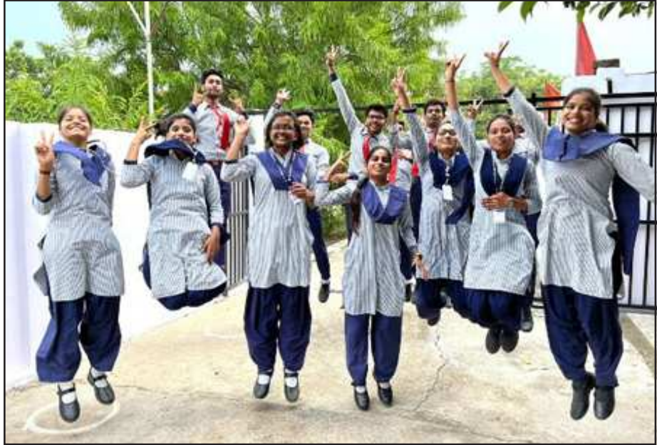
रिजल्ट आने के बाद न्यू एंजिल्स स्कूल में जश्न मनाती छात्राएं।

जवाहर नवोदय विद्यालय तथा न्यू एंजिल्स के छात्रों ने प्राप्त किया 95 प्रतिशत से ऊपर अंक