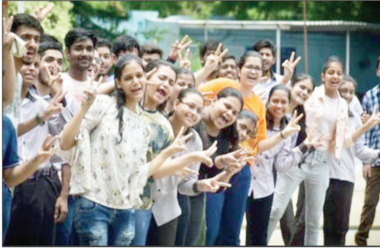
परीक्षा परिणाम घोषित होने के पश्चात खुशी का इजहार करते छात्र एवं छात्राएं

खास यह कि दोनों ने सीबीएसई क्षेत्रीय कार्यालय, प्रयागराज के तहत पूर्वांचल और मध्य यूपी के 49 जिलों में तीसरा स्थान हासिल किया है। जिले में सीबीएसई दसवीं का रिजल्ट 95.76 फीसदी और बारहवीं का रिजल्ट 85.82 फीसदी रहा। दोनों ही परीक्षाओं में बेटियों का परिणाम बेहतर रहा। 10वीं में 96.30 फीसदी छात्राएं एवं 95.43 फीसदी छात्र और बारहवीं में 89.36 फीसदी छात्राएं एवं 83.60 फीसदी छात्र उत्तीर्ण घोषित किए गए। दसवीं की परीक्षा के लिए जिले के 101 स्कूलों के 12546 और बारहवीं की परीक्षा के लिए 80 स्कूलों के 10367 परीक्षार्थी पंजीकृत थे।