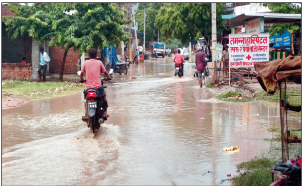
वीरकाजी रोड पर जमा हुआ बारिश का पानी, चार लोग घायल

फूलपुर। सरकार सड़कों को गड्ढा मुक्त करने का कितना भी फरमान जारी करें पर अधिकारियों की उदासीनता के चलते ग्रामीण क्षेत्रों में कुछ सड़कें आज भी चलने लायक नहीं हैं। चुनाव के समय लोक लुभावन वादे कर जनता का वोट हासिल कर सरकार में शामिल होने वाले जनप्रतिनिधि भी ऐसी महत्वपूर्ण समस्याओं को नजरअंदाज करते हैं। अपने तमाम वादों के साथ सरकार ने गड्ढा मुक्त सड़कें भी देने का वादा किया था लेकिन अधिकारियों की न सुधरने की हठधर्मिता से आमजन को परेशानियां बढ़ती हैं। इलाहाबाद-चौबे रास्ता मार्ग किला रोड 29 पर सैन्य इफको महलिया संपर्क मार्ग फूलपुर-हनुमानगंज को किलोमीटर 4 पर जोड़ती है जब भी प्रयागराज जौनपुर