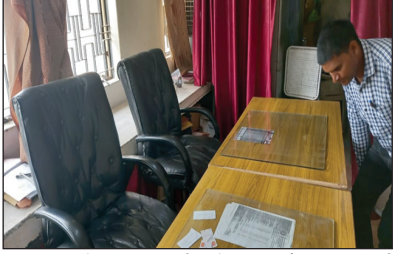
विकास भवन के बाल श्रम कार्यालय में अधिकारियों की खाली कुर्सी