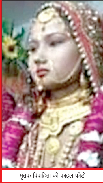
मृतक विवाहिता की फाइल फोटो