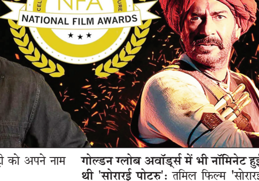
नुनिया की सबसे बड़ी इंडस्ट्री को अपने नाम कर लेता है। गोलडन ग्लोब अवॉर्ड्स में भी नॉमिनेट हुई थी 'सोरारई पोटरु': तमिल फिल्म 'सोरारई

नई दिल्ली: 68वें नेशनल फिल्म अवॉर्ड की शुक्रवार को घोषणा की गई। इसमें 'तान्हाजी द अनसंग वॉरियर' के लिए अजय देवगन और 'सोरारई पोटरु' के लिए साउथ स्टार सूर्या को बेस्ट एक्टर का अवॉर्ड मिला। वहीं, सूर्या की 'सोरारई पोटरु' को ऑल टाइम एंटरटेनिंग फिल्म का अवॉर्ड मिला। बेस्ट हिंदी फिल्म 'तुलसीदास जूनियर' रही। 'सोरारई पोटरु' में आम आदमी को आसमान में उड़ाने का सपना: 'सोरारई पोटरु' के एक्टर सूर्या को बेस्ट एक्टर और एक्ट्रेस अपर्णा बालमुरली को बेस्ट एक्ट्रेस का अवॉर्ड मिला है। 'सोरारई पोटरु' एक ऐसे इंसान की कहानी है, जो आम आदमी को आसमान में उड़ाने का सपना देता है। वह अपने परिवार, दोस्तों और जुनून की वजह से