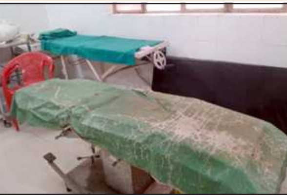
पट्टी सीएससी पर बिना बेडशीट का आपरेशन थियेटर।