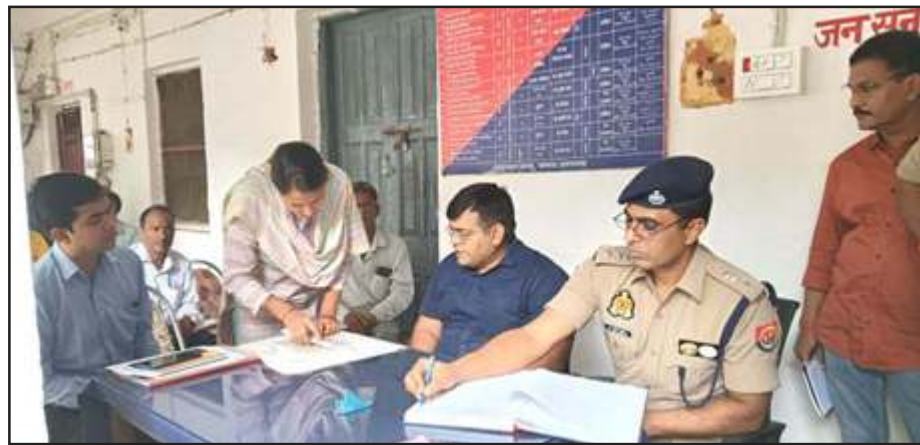
समाधान दिवस पर शिकायतें सुनते डीएम व एसपी।