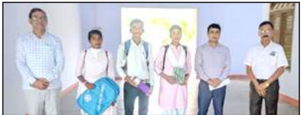
विजयी प्रतिभागी के साथ एनएसएस अधिकारी।

परियावां, प्रतापगढ़। स्वच्छता ही सेवा पखवाड़े के अंतर्गत मदन मोहन मालवीय पीजी कॉलेज कालाकाकर एवं वन विभाग कालाकाकर रेंज के संयुक्त तत्वाधान में वाद-विवाद प्रतियोगिता महाविद्यालय में शनिवार को संपन्न हुआ। इस प्रतियोगिता में कुल 21 विद्यार्थियों ने प्रतिभाग लिया। विद्यार्थियों ने सेवा एवं स्वच्छता विषय पर अपने-अपने विचार प्रस्तुत किये तथा पर्यावरण और धूम्रपान नम, जल और स्थल को साफ एवं सुरक्षित रखने के विभिन्न तरीकों पर बात की। इस अवसर पर वन विभाग