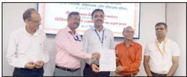
शिक्षकों को सम्मानित करते।