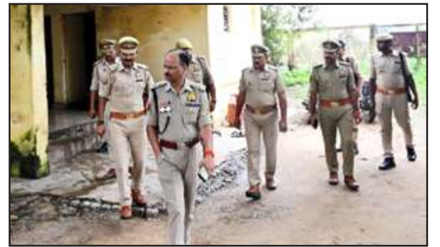
निरीक्षण करते एसपी।

शनिवार को पुलिस अधीक्षक चित्रकूट ने थाना समाधान दिवस के मौके पर आये फरियादियों की शिकायतों को सुनकर निस्तारण बाबत सम्बन्धित अधिकारियों को निर्देश दिये। भूमि विवाद से