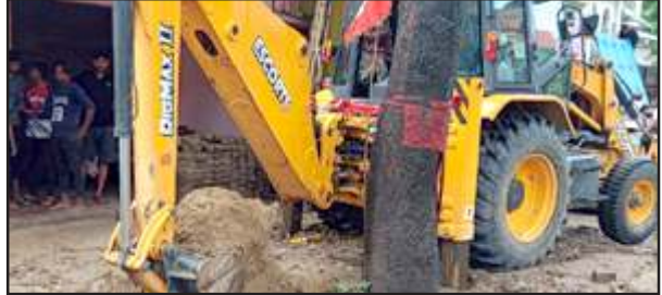
जेसीबी से जलभराव हटाने नपा कर्मी।

मशीन से निकाल लिया गया है। चार सक्शन मशीन लगाई गई है। साकेत महाविद्यालय के पास की पुलिया जाम है जिसे खोलने का प्रयास किया जा रहा है। इसके अलावा रेलवे स्टेशन रोड, डिग्री कालेज के सामने, करनपुर मोहल्ला में आज दूसरे दिन भी जलभराव रहा। इससे लोगों को परेशानी हुई। लोगों का कहना है कि बाबा आदम के जमाने के बने नाले-नालियों से इतनी भीषण वर्षा का पानी नहीं निकल सकता। इसके अलावा ज्यादातर नाले-नालियों पर