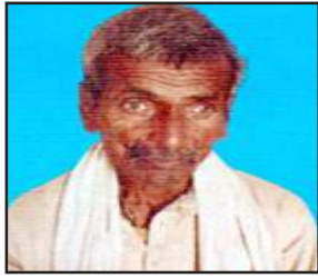
मृतक की फाइल फोटो।

चित्रकूट। सरखुवा थाना क्षेत्र के बरदारा गांव में आकाशीय बिजली की चपेट में आने से बुजुर्ग झुलस गया। वह बकरी चराने को घर से निकला था। इलाज को जिला अस्पताल में भर्ती कराया गया। इलाज दौरान उसकी मौत हो गई। बिजली की चपेट में उसकी छह बकरियां भी मर गईं।