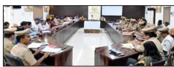
बैठक में निर्देश देते जिलाधिकारी।