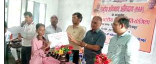
छात्र को प्रमाण पत्र देते अधिकारी।

चित्रकूट। महानिदेशक स्कूल शिक्षा उत्तर प्रदेश के आदेश अनुसार जिले के ब्लाक चित्रकूट में राष्ट्रीय आविष्कार अभियान के तहत ब्लॉक के 300 छात्र-छात्राओं ने भाग लिया। साथ ही प्रतियोगिता को सफल बनाया। जिसमें बच्चों का विजय प्रतियोगिता परीक्षा के माध्यम से चयन किया गया। इसके बाद 25 बच्चों में पांच बच्चों को जिला स्तरीय प्रतियोगिता में प्रतिभा करने के लिए चयनित किया गया। कार्यक्रम में जिला बेसिक शिक्षा अधिकारी ने कहा कि शिक्षक निष्ठा