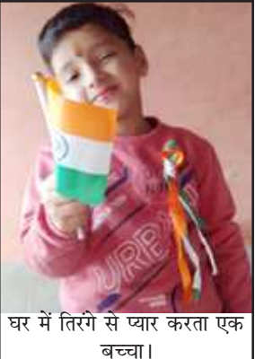
घर में तिरंगे से प्यार करता एक बच्चा।

प्रतापगढ़। स्कूल कालेज बंद होने से इस बार गणतंत्र दिवस में बच्चे घर में ही तिरंगा फहराकर गणतंत्र दिवस मनाये यह अलग बात है कुछ बड़े विद्यालय तथा कुछ सरकारी विद्यालय अधिकारियों के साथ कोविड नियमों का उल्लंघन करते हुए बिना मास्क के बच्चों को बुलाकर गणतंत्र भले मनाया हो लेकिन ज्यादातर स्कूल सरकारी आदेश के