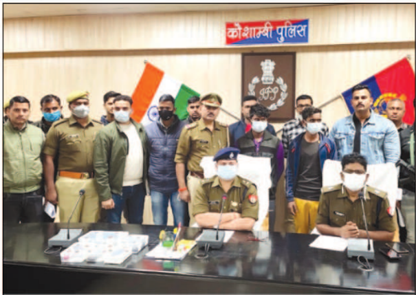
हत्या का खुलासा करते पुलिस अधीक्षक पीछे खड़े अभियुक्त गण