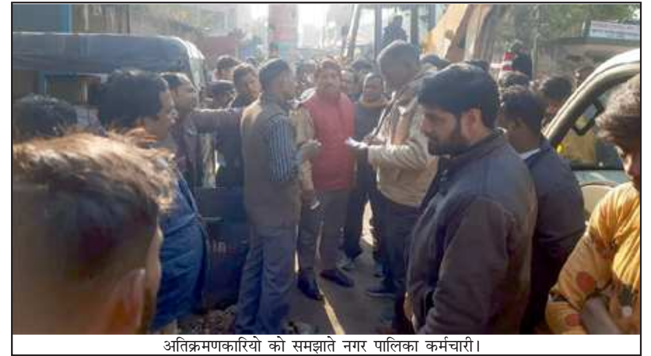
अतिक्रमणकारियों को समझाते नगर पालिका कर्मचारी।

प्रतापगढ़ लालगंज। केन्द्रीय कांग्रेस वर्किंग कमिटी के सदस्य प्रमोद तिवारी ने केन्द्र सरकार के एयर इंडिया को बेचने को देश की एक बेशकीमती सरकारी सम्पत्ति की बड़ी लूट बताया है। उन्होंने आरोप लगाया है भाजपा सरकार ने एयर इंडिया को कौड़ियों के दाम बेचकर एक शर्मनाक कदम उठाया है। शुक्रवार को लालगंज कैम्प कार्यालय पर जारी बखान में कांग्रेस नेता प्रमोद तिवारी ने कहा कि एयर इंडिया का महाराज देश ही नहीं बल्कि विदेशों में हमारी शान व पहचान था, ऐसे में मोदी सरकार ने एयर इंडिया को टाटा जैसे पूंजीपति के हाथ बेचकर राष्ट्रीय अस्मिता पर चोट पहुंचाई है।