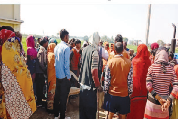
मारपीट के बाद घटनास्थल पर लोगों की भीड़ व मारपीट में घायल व्यक्ति