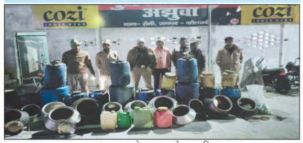
बरामद शराब के पास खड़े हुए पुलिस

आबकारी विभाग ने भी अवैध शराब भट्टी संचालन बन्द कराने का तमाम प्रयास किया लेकिन बीते तीन दशक से संचालित हो रही अवैध शराब भट्टियां नहीं बंद हो सकी