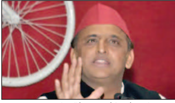
लखनऊ। समाजवादी पार्टी के दिन, कोई दिन ऐसा नहीं, जिस दिन

की अवधि में मुंबई में संक्रमण दर 1% से बढ़कर 17% हो गई है। रविवार को, मुंबई में 8,000 से अधिक दैनिक कोविड-19 मामले दर्ज किए गए। रविवार को मुंबई में कोविड के मामलों में दैनिक वृद्धि के साथ, बृहन्मुंबई नगर निगम (बीएमसी) ने सभी नागरिकों से अत्यधिक कोविड-उपयुक्त व्यवहार का सख्ती से पालन करने, सार्वजनिक स्थानों पर मास्क पहनने और भीड़-भाड़ वाली जगहों से