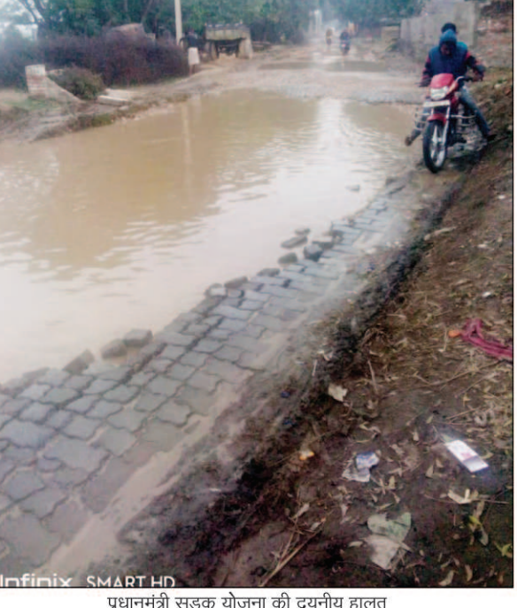
प्रधानमंत्री सड़क योजना की दयनीय हालत

जसरा। प्रधानमंत्री सड़क योजना के तहत बनाया गया मार्ग अब तालाब में तब्दील हो गया है। मार्ग से आने जाने वाले लोगों को भारी परेशानी का सामना करना पड़ रहा है। सड़क बन जाने के बाद उस पर किसी भी जिम्मेदार अधिकारी की निगाह नहीं पड़ रही है। बताते चलें कि दो वर्ष पूर्व बनी घूरपुर-लालापुर मार्ग में जगह जगह गड्डे हो जाने के कारण चितौरी गांव में सड़क पर पानी भर जाने के कारण वाहनों के साथ ही पैदल आने जाने वाले लोगों को भारी मुसीबत झेलनी पड़ रही है। सड़क के किनारे बसे लोगों को उसी रास्ते से आना जाना पड़ रहा है। इसी तरह से सुखवार गांव में भी सड़क गड्डों में तब्दील हो गई है। लालापुर से प्रयागराज जाने वालों को भारी परेशानी हो रही है। विभागीय अधिकारियों की इस ओर नजर ही नहीं जा रही है। आज जब प्रधानमंत्री सड़क योजना से बनी सड़क की यह हालत है तो और सड़क भगवान भरसे ही हैं। आलम