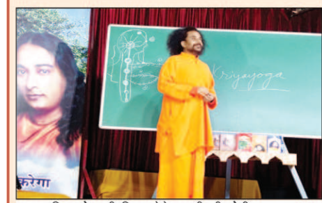
क्रियायोग की शिक्षा देते स्वामी श्री योगी सत्यम