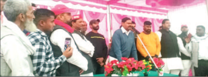
मंच पर उपस्थित सपा राष्ट्रीय महासचिव इंद्रजीत सरोज व अन्य सपा नेता

बंधवा कल्याण आर्का महावीर पुर दाढ़ी दशरथपुर सचवारा बंधुरी रसूलपुर सहित दर्जनों गांव का भ्रमण कर साधा भाजपा सरकार पर निशाना