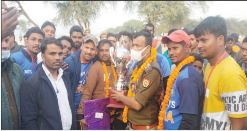
विजेता टीम को कप देते डी आई जी