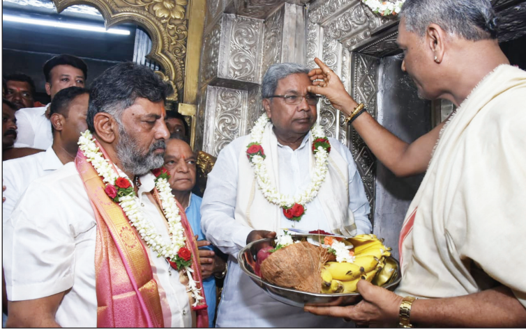
कर्नाटक की राजनीति का महारथी सिद्धारमैया

कर्नाटक की प्रगतिके लिए टीम कांग्रेस प्रतिबद्ध : कांग्रेस अध्यक्ष मल्लिकार्जुन खड़गे ने गुरुवार को कर्नाटक के मुख्यमंत्री पद को लेकर अंतिम फैसले के बाद डीके शिवकुमार और सिद्धारमैया के साथ मुलाकात की तस्वीर साझा की है। सिद्धारमैया कर्नाटक के नये मुख्यमंत्री होंगे। कांग्रेस अध्यक्ष खड़गे ने ट्वीट में कहा कि हम 6.5 करोड़ कर्नाटक के लोगों से वादा की गई 5 गांठी को लागू करेंगे। टीम कांग्रेस कर्नाटक के लोगों की प्रति, कल्याण और सामाजिक न्याय के लिए प्रतिबद्ध है। खड़गे ने गुरुवार को ट्वीट पर कर्नाटक के मुख्यमंत्री पद के दोनों उम्मीदवारों डीके शिवकुमार और सिद्धारमैया