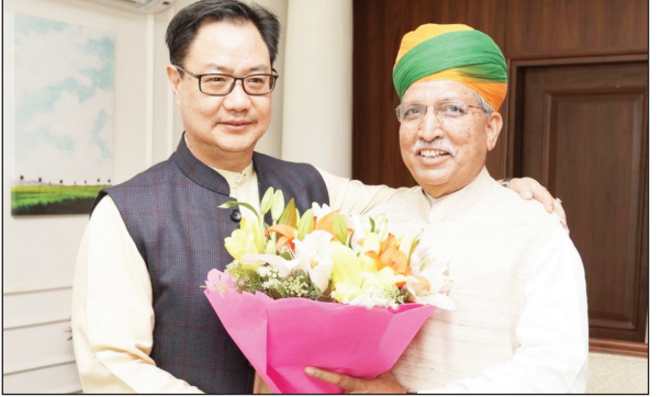
मंत्री प्रो. एसपी सिंह बघेल का भी मंत्रालय बदला गया है। उन्हें अब स्वास्थ्य एवं परिवार कल्याण राज्य मंत्री बनाया गया है। रिजिजू को लेकर सुखिचों में रहे हैं।

नई दिल्ली: कानून मंत्री बनने पर किरन रिजिजू ने अर्जुनराम मेघवाल को बधाई दी। किरन को जुलाई 2021 में कानून मंत्रालय सौंपा गया था। यह फोटो किरन ने ट्वीट की है। सरकार ने कानून मंत्री किरन रिजिजू का विभाग बदल दिया है। रिजिजू को अब अर्थ साइंस मंत्रालय दिया गया है। रिजिजू की जगह अब अर्जुन राम मेघवाल लॉ मिनिस्टर होंगे। राष्ट्रपति भवन की ओर से जारी नोटिफिकेशन में बताया गया है कि मेघवाल को स्वतंत्र प्रभार सौंपा गया है। मेघवाल के पास संसदीय मामलों के राज्य मंत्री का जिम्मा भी है। रिजिजू के अलावा कानून राज्य