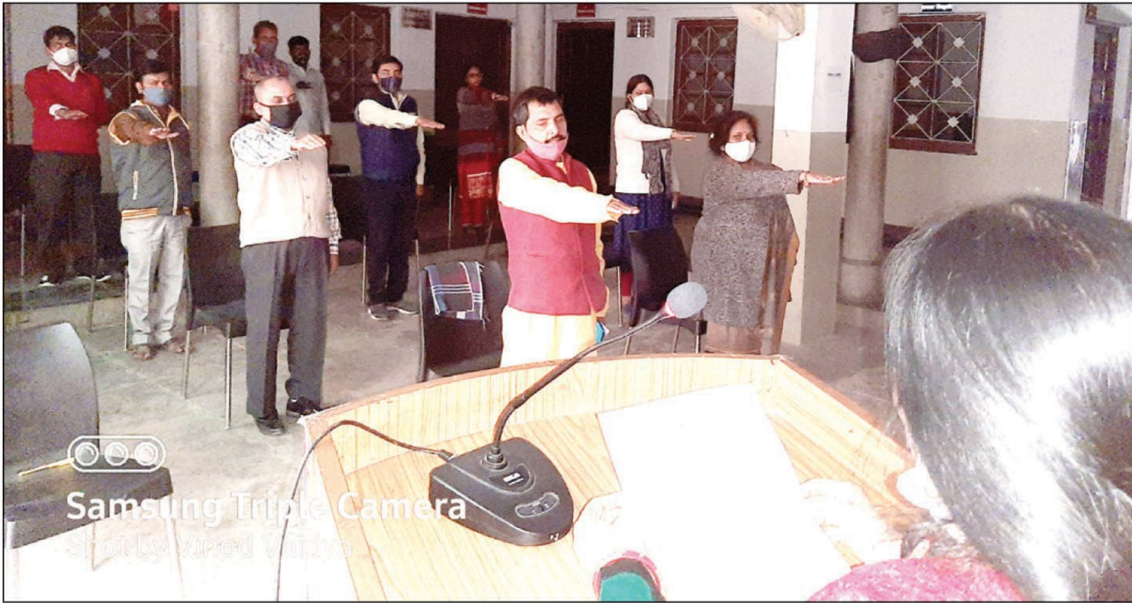
संविधान दिवस पर शपथ लेते हुए