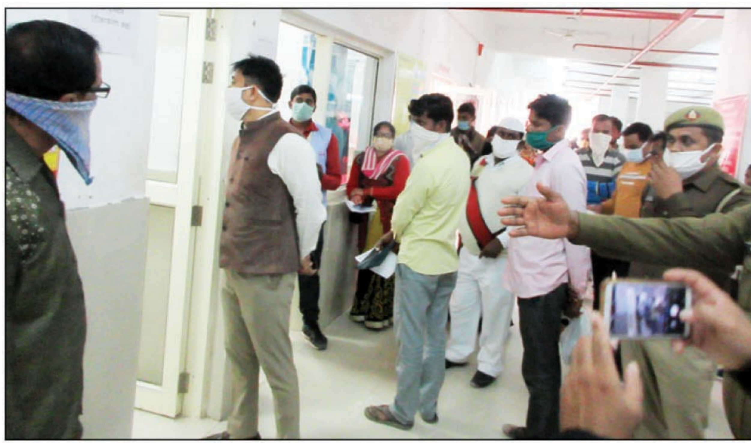
जिला अस्पताल का निरीक्षण करते जिलाधिकारी

मंझनपुर मुख्यालय में चल रहे इस पाली क्लीनिक की ओर अभी तक स्वास्थ्य विभाग के अधिकारियों ने नजर नहीं उठाई है इसके पहले भी मंझनपुर मुख्यालय में आधा दर्जन मरीजों की इलाज के दौरान मौतें हो चुकी हैं जो गंभीर चिंतन का विषय है मुकदमा दर्ज होने के बाद कड़ा धाम कोतवाली पुलिस मंझनपुर के क्लीनिक के चिकित्सक को तलाश कर रही है और जल्द ही इस क्लीनिक के चिकित्सक की गिरफ्तारी कड़ा धाम कोतवाली पुलिस कर सकती हैं।