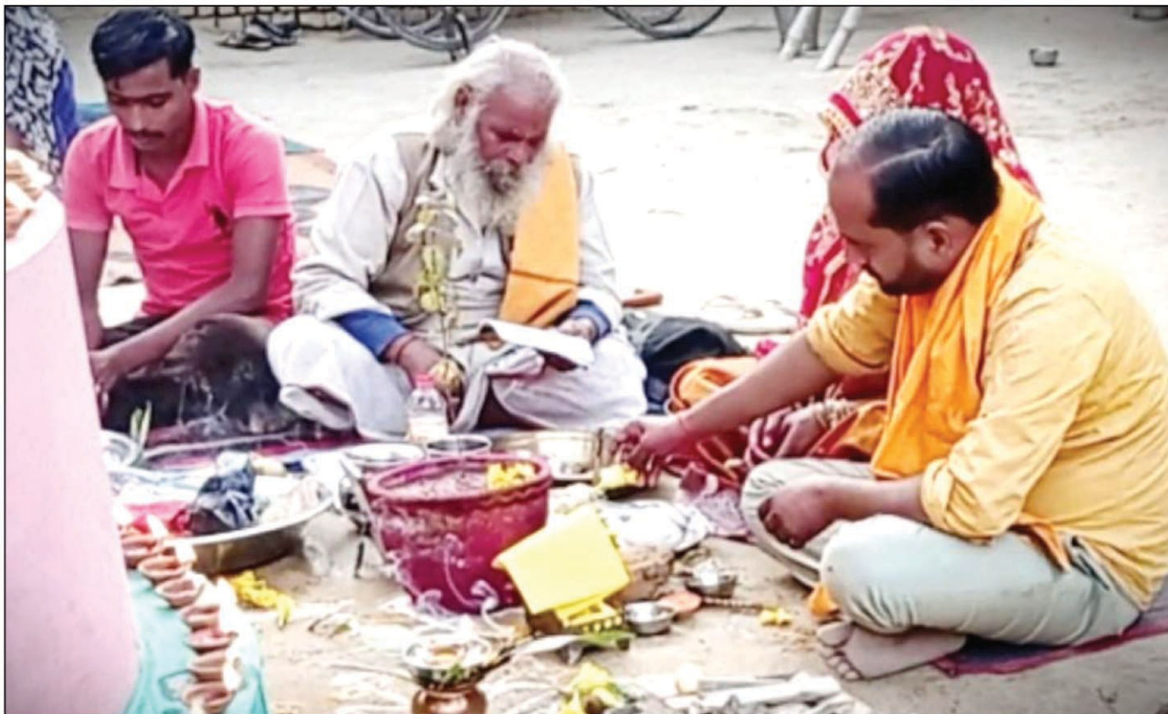
पूजा अर्चना करते भक्तगण