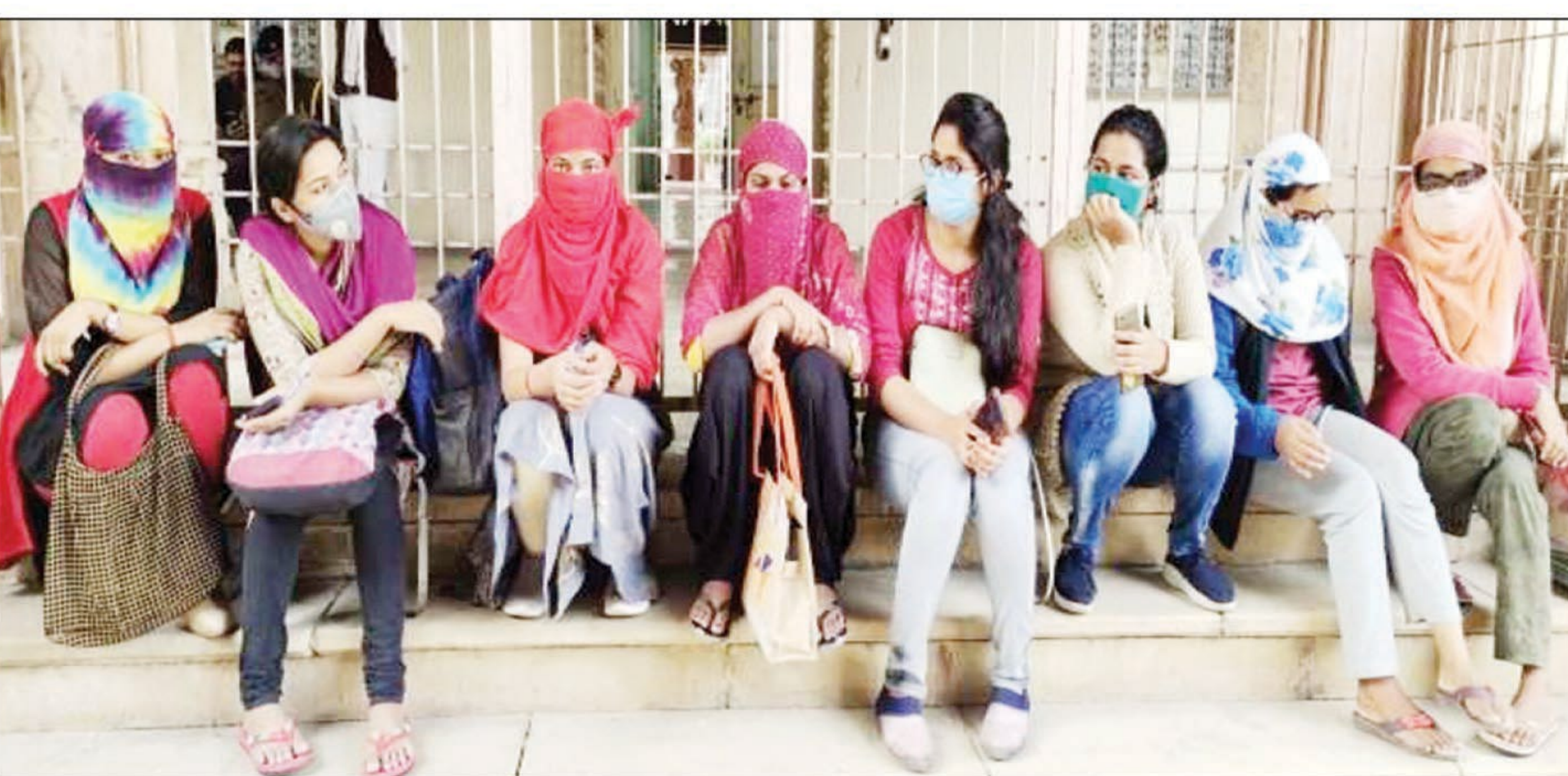
इविवि के हॉस्टल खोलने की मांग करती छात्राएं

प्रयागराज। इलाहाबाद विश्वविद्यालय के करीब सात महीने से सभी छात्रावास बन्द है। ऑनलाइन 5 में विश्वविद्यालय व अन्य संस्थाओं को खोला जा रहा है। विश्वविद्यालय के छात्रों का कहना है कि अब विश्वविद्यालय को पूरी तरह से खोला जाए। पठन पाठन भी नियमित रूप से शुरू करें। इसी क्रम में गुरुवार को कुछ छात्राएं कुलपति आवास पर धरना दे रही हैं। उनकी मांग है कि छात्रावास खोला जाए। ऐसा न करने से उनको कठिनाई का सामना कर पड़ रहा है। इसे लेकर पूर्व में भी आंदोलन हो चुका है। कुछ छात्रों ने भी हॉस्टल में घुसने की कोशिश की थी। इस मामले को लेकर अब फिर आवाज उठाई जा रही है। शाम तक कुलपति ने इस मुद्दे पर त्राओं से किसी तरह की वार्ता नहीं