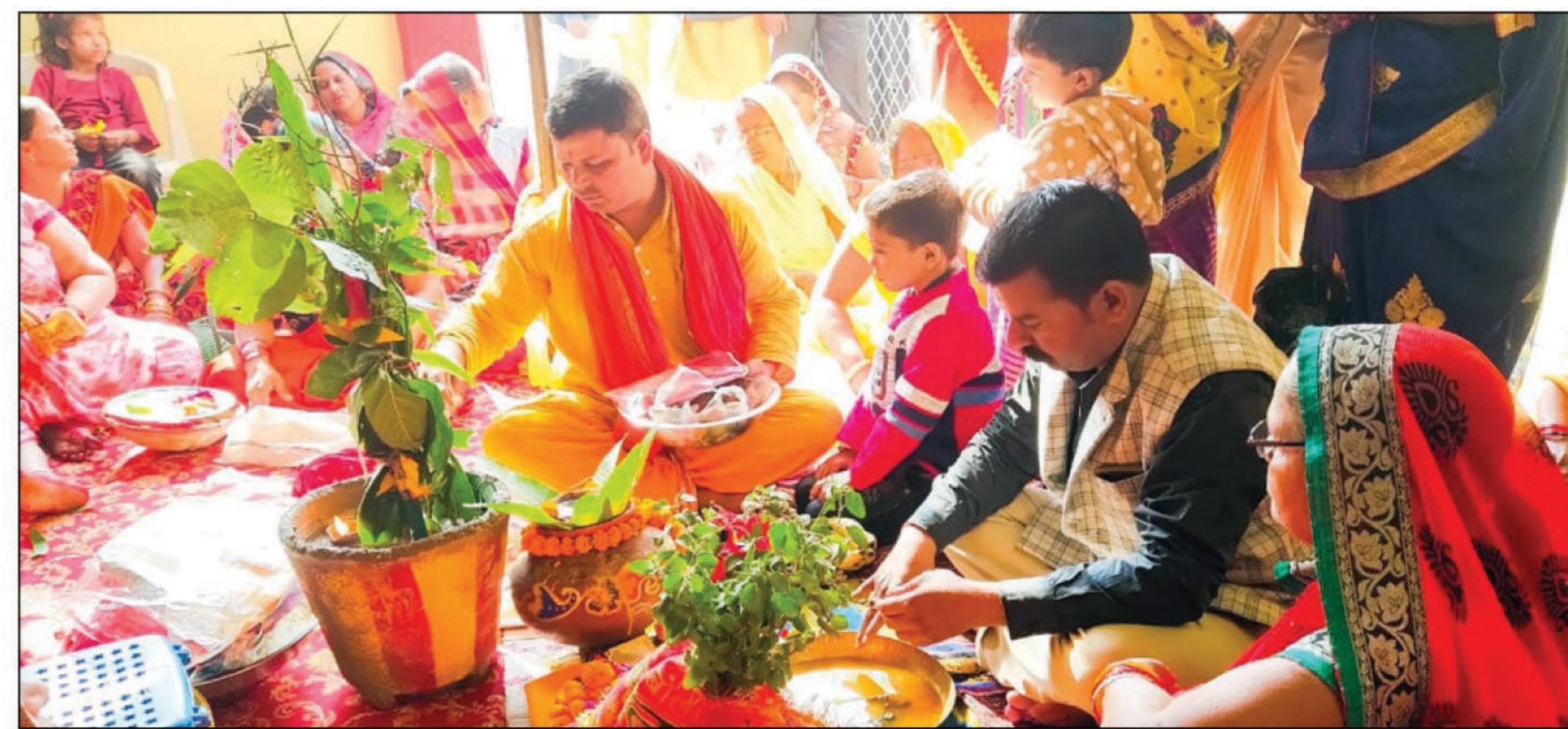
विधि विधान से शालिग्राम भगवान और तुलसी माता का विवाह करते हुए

सामान्य विवाह की तरह पूरे विधि-विधान से निभाई गई रश्में