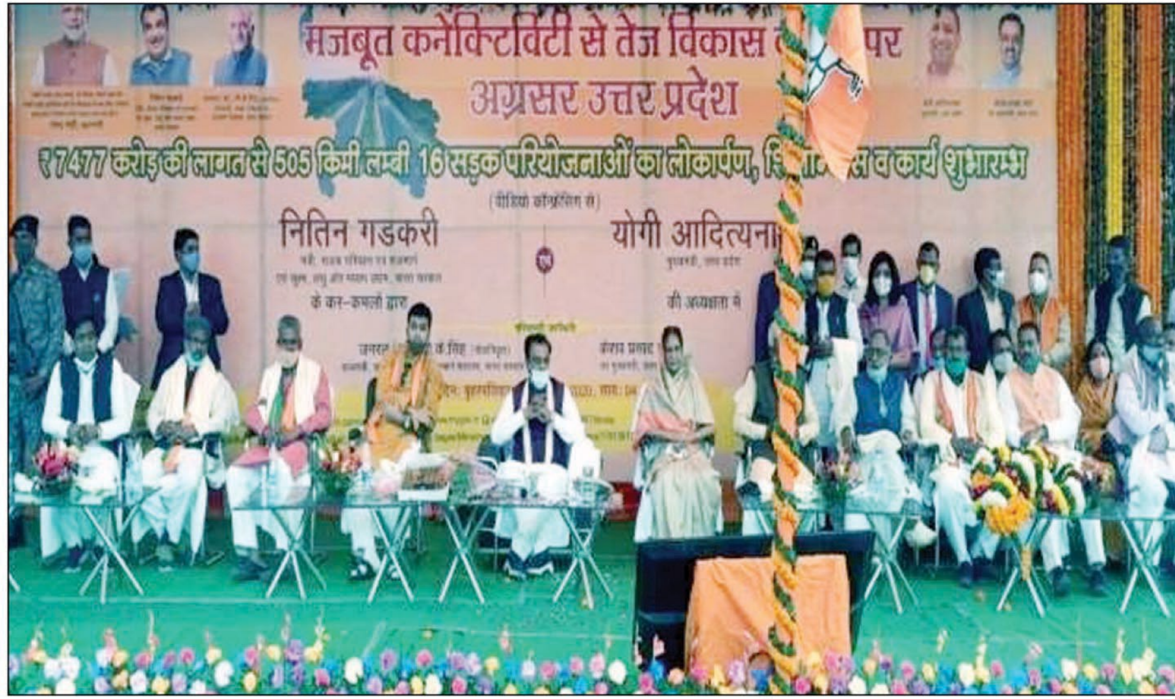
मंच पर उपस्थित उप मुख्यमंत्री केशव प्रसाद मौर्य व अन्य

डिप्टी सीएम ने कहा कि उन्होंने मुख्यमंत्री से मांग की है कि राम वन गमन मार्ग का शीघ्रता से कार्य प्रारंभ हो। राम भक्तों की बड़ी मांग है। मुख्यमंत्री ने कहा कि आजादी के बाद इतनी सड़कें नहीं बनीं जितनी भाजपा सरकार में छह सालों में बनीं