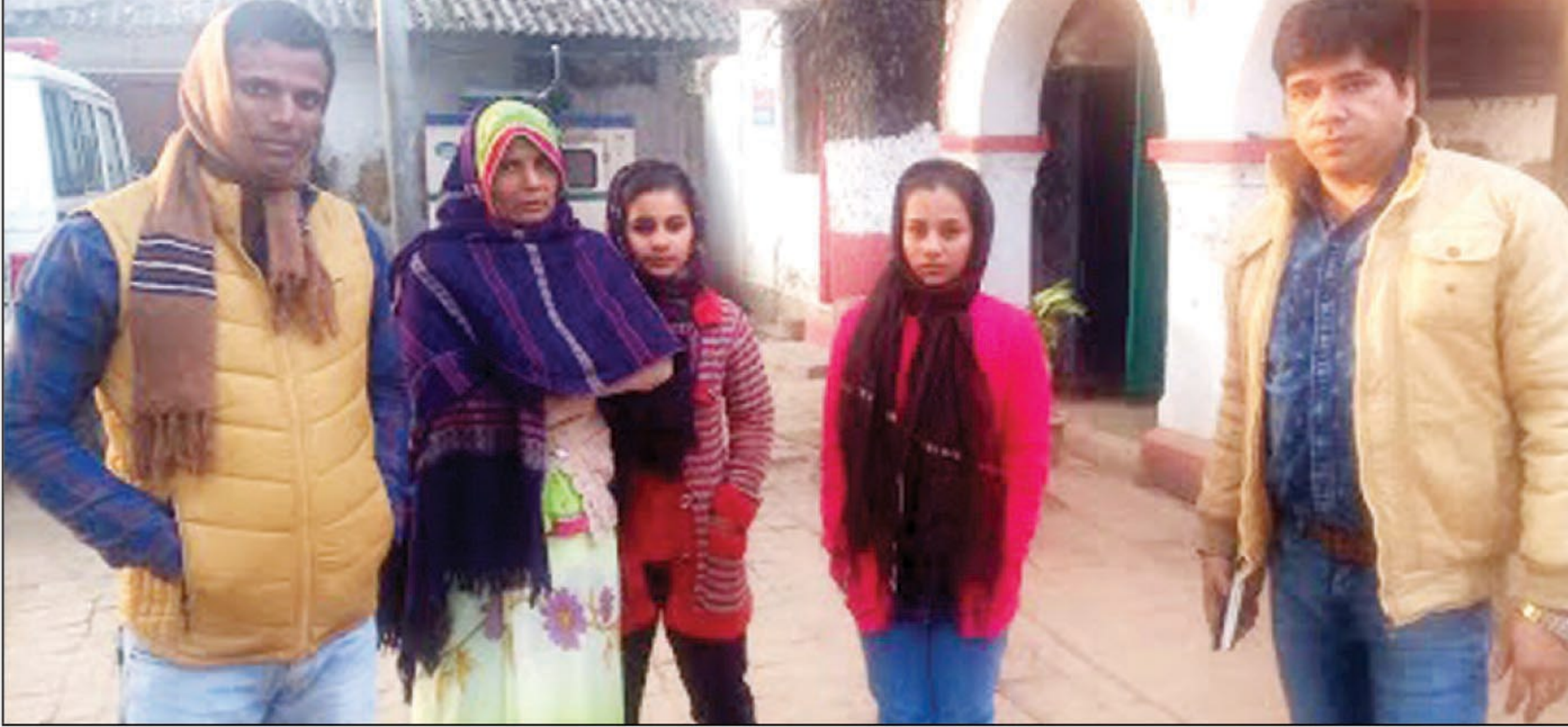
परिजनों के साथ विवाहिता