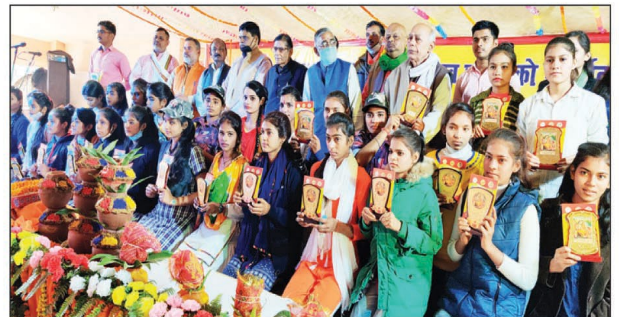
बृहद साक्षरता एवं जागरूकता सम्मेलन में शामिल छात्राएं व अतिथिगण

लालगोपालगंज। श्रृंगवेरपुर धाम में आयोजित राष्ट्रीय रामायण मेला में क्षेत्र के आधा दर्जन से अधिक विद्यालय एवं महाविद्यालय के छात्र एवं छात्राओं ने प्रतिभाग कर अपने हुनर का मुजाहरा किया। छात्राओं ने सांस्कृतिक