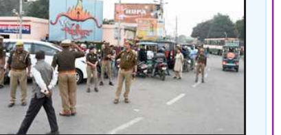
जांच करती पुलिस।