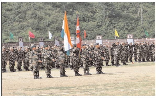
पिथौरागढ़ (उत्तराखंड) में होने जा रहा है। उन्होंने कहा कि नेपाल