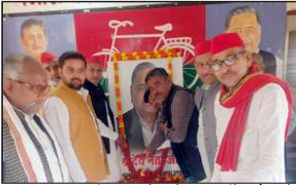
सपा संस्थापक मुलायम सिंह यादव की जयंती पर पुष्प अर्पित करते सपाइयों।