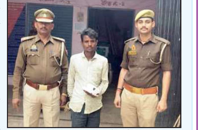
पुलिस गिरफ्त में चोर।