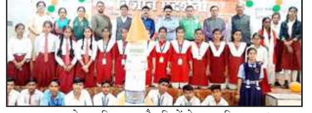
मण्डल के चयनित बाल वैज्ञानिकों के साथ शिक्षकगण।