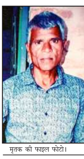
मृतक की फाइल फोटो।