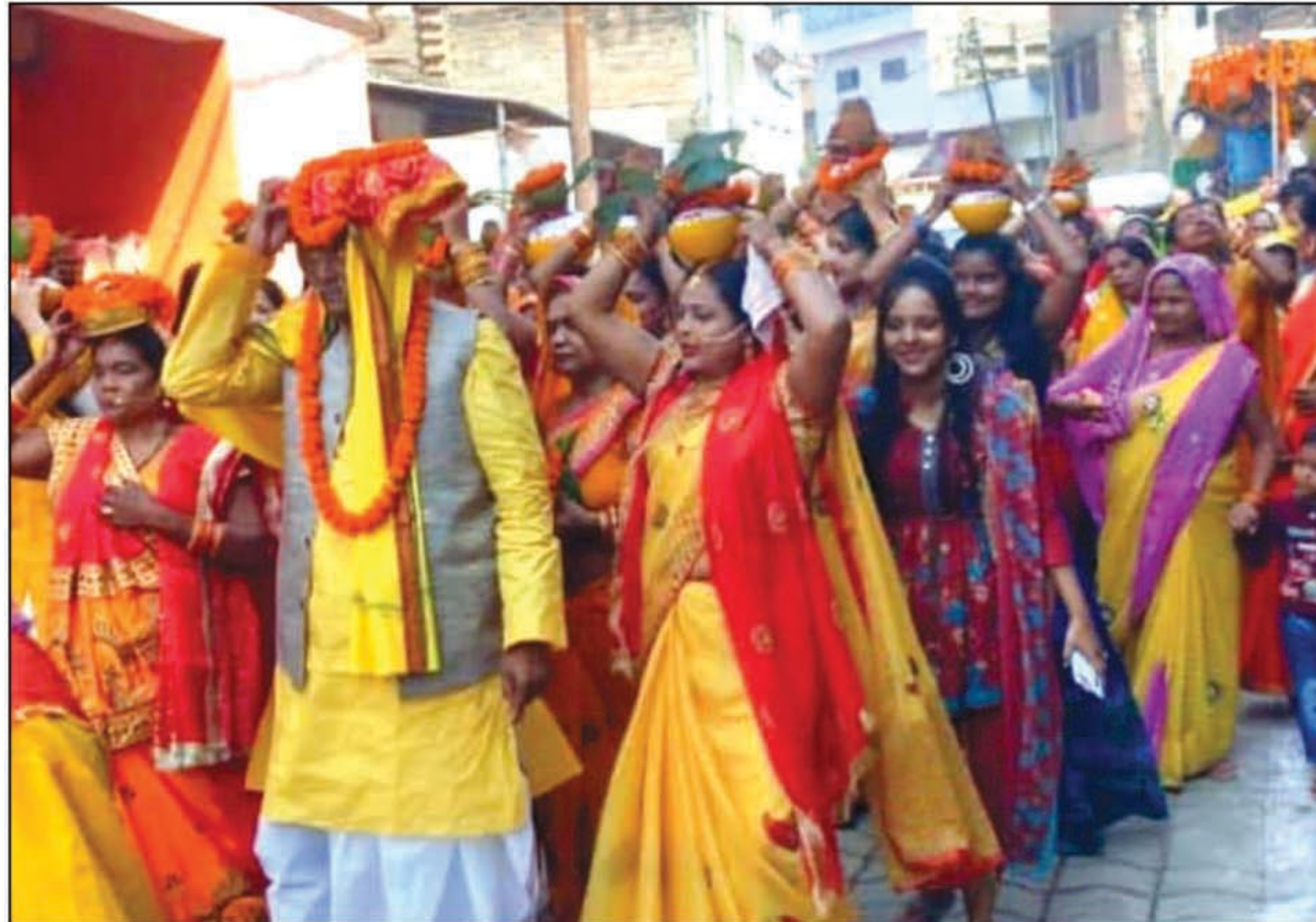
कलश यात्रा का सुंदर दृश्य व भागवत कथा का श्रवण करती महिलाएं

आयोजकों ने कहा कि अपनी संस्कृति के धरोहरों को स्मरण रखना चाहिए इस भौतिक वादी समय में अध्यात्म की भी उतनी आवश्यकता है जितनी विज्ञान की है। आयोजकों ने कहा कि अपनी संस्कृति के धरोहरों को स्मरण रखना चाहिए इस भौतिक वादी समय में अध्यात्म की भी उतनी आवश्यकता है जितनी विज्ञान की है।