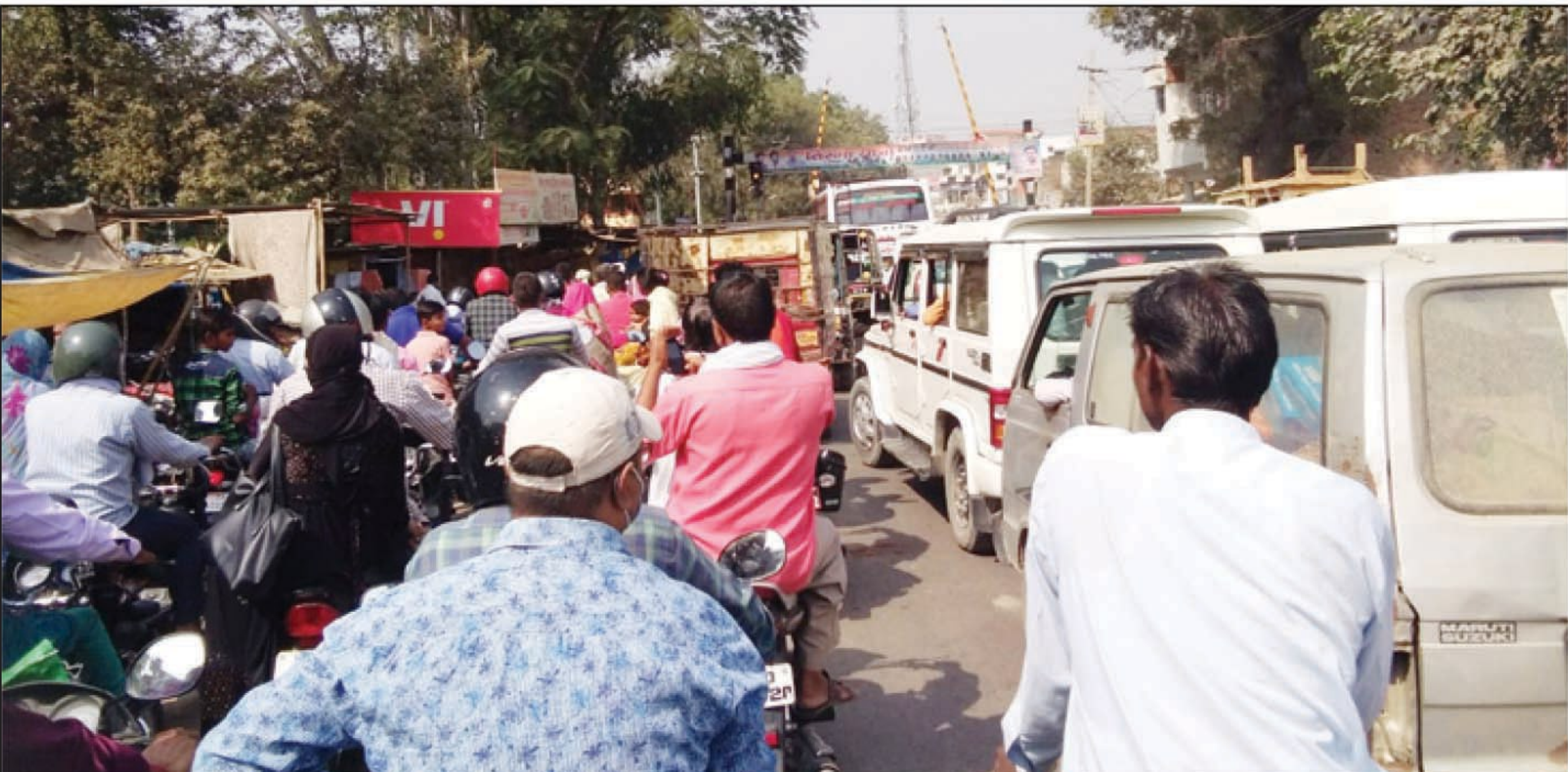
भीषण जाम में फंसे राहगीर

जसरा। प्रयागराज बांदा राष्ट्रीय राजमार्ग पर स्थित जसरा रेलवे क्रॉसिंग पर प्रतिदिन लगने वाले जाम से निजात पाने के लिए जसरा के व्यापारियों के साथ ही क्षेत्रीय लोगों ने स्थानीय सांसद व विधायक से गुहार लगाई है। लोगों का कहना है कि जसरा के अलावा आसपास के रेलवे फाटक पर फ्लाईओवर का निर्माण सरकार द्वारा कराया जा चुका है। जसरा की रेलवे फाटक पर लगातार ट्रेनों के आवागमन के कारण भीषण जाम लगना आम बात हो गई है।