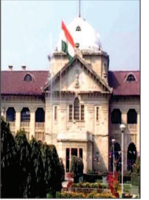
कि जून-जुलाई 2020 में थाना कैराना के सीओ, एसएचओ और अन्य पुलिस अधिकारियों ने दो औरतों की हत्या के मामले में याची व उसके पति तथा बेटीयों को थाने में लाकर थर्ड डिग्री का प्रयोग किया। जबन जुर्म कबूल करने के लिए इलेक्ट्रिक शाक भी दिया गया।