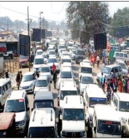
सड़कों पर जाम में फंसे वाहन

प्रयागराज। पिछले दो दिनों से सड़कों पर जाम की समस्या बढ़ गई है। गंगा, यमुना के संगम की रेली पर बसों तंबुओं की नगरी में मंगलवार को भीषण जाम में फंसकर लोग परेशान हुए। माघ मेला में 72 नागरिकों की भीड़ कम हुई तो लोग वाहन लेकर संगम तक जाने लगे। इससे लगभग 72 लोगों को बनी सड़कों पर काफी लंबा जाम लगा रहा। हालात यह रहे कि दिनभर वाहन रंगते रहे। जाम के झाम से मुक्ति दिलाने में लगे पुलिस के जवानों के भी पसीने छूट गए। जाम में फंसने से लोगों को काफी परेशानियों का भी सामना करना पड़ा। मंगलवार को माघ मेला में काफी तादाद में श्रद्धालु पहुंच गए। लोग अपने वाहनों के साथ संगम तीरे तक पहुंचने लगे। संगम में डुबकी लगाने के बाद हर कोई जल्दी निकलने में लगा रहा। इससे वाहनों के कारण हालात ऐसे बन गए कि भीषण जाम मेला क्षेत्र में लग गया। संगम नोज से परे मैदान तक वाहनों की लंबी कतार लग गई। वाहन रंगते रहे।