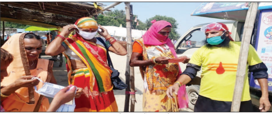
मास्क वितरण करते दुकान जी