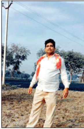
मृतक की फाइल फोटो