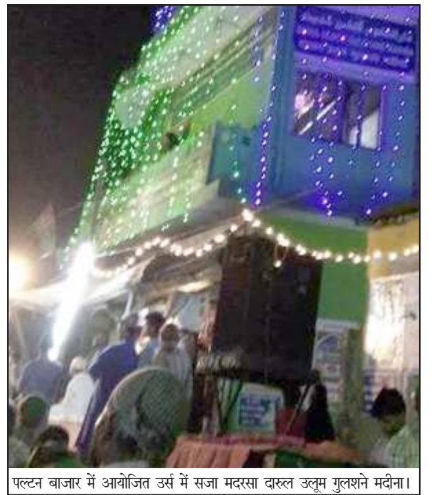
पलटन बाजार में आयोजित उर्स में सजा मदरसा दारुल उलूम गुलशने मदीना।