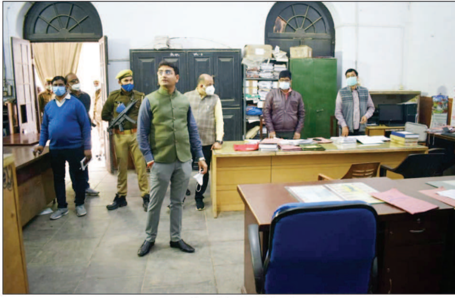
नामांकन कक्षा का निरीक्षण करते जिलाधिकारी