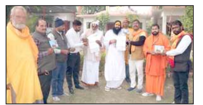
प्राण प्रतिष्ठा समारोह का आमंत्रण बांटते लोग।