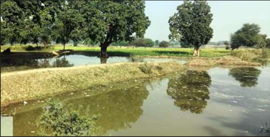
सूखी नहर के टेल तक आया पानी।

चित्रकूट। पयश्वनी मुख्य नहर का पानी 35 साल बाद लोहदा, अरछाबरेठी, रघुवंशीपुर, कलवारा खुर्द व कलवारा बुजुर्ग गांवों में टेल तक पहुंचा। इससे किसानों के चेहरे खिल उठे।