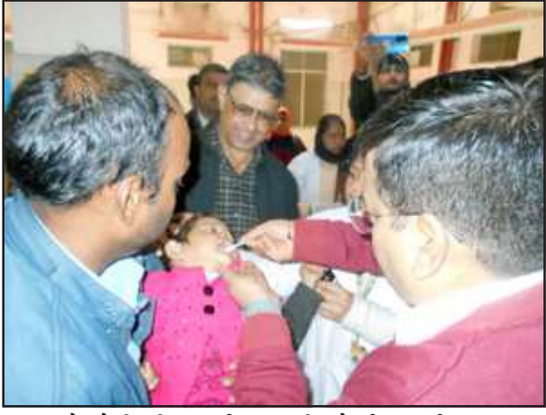
बच्चों को विटामिन-ए की खुराक पिलाते डीएम संजीव रंजन

प्रतापगढ़। जिला महिला चिकित्सालय में आयोजित के विटामिन-ए सम्पूर्ण कार्यक्रम में जिलाधिकारी संजीव रंजन बच्चों को विटामिन-ए की खुराक पिलाकर कार्यक्रम का शुभारम्भ किया। इस दौरान मुख्य विकास अधिकारी नवनीत सेहारा एवं मुख्य चिकित्साधिकारी डा0 जी0एम0 शुक्ला ने बच्चों को विटामिन-ए की खुराक पिलायी। विटामिन-ए की खुराक जनपद के 09 माह से 05 वर्ष