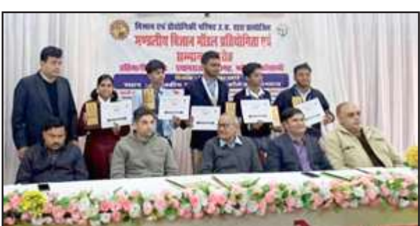
राज्य विज्ञान प्रदर्शनी में चयनित ओम संस्कृति।

मंगलवार को राजकीय इंटर कॉलेज प्रयागराज में आयोजित मंडल स्तरीय विज्ञान मॉडल प्रतियोगिता में प्रयागराज मंडल के चारों जनपदों से 15-15 प्रतिभागी अपने मॉडल के साथ प्रतियोगिता में प्रतिभाग किए। प्रतापगढ़ के 15 प्रतिभागियों में अमर जनता इंटर कॉलेज कटरा