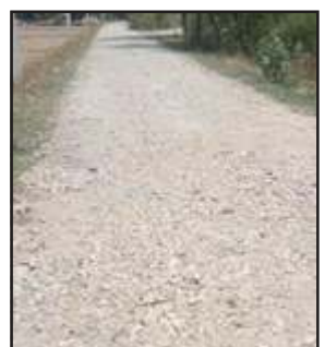
अधूरी पड़ी लोक निर्माण विभाग की सड़क।

विकास खंड लालगंज क्षेत्र स्थित रायपुर तियाई-रामपुर राजमार्ग से जगन्नाथपुर को जोड़ने वाली सड़क का निर्माण पीडब्ल्यूडी से लगभग 1500 मीटर हुआ है। पीडब्ल्यूडी