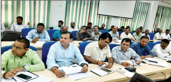
बैठक में उपस्थित विभिन्न विभाग के अधिकारी

श्रमिकों का पंजीकरण सुनिश्चित कराया जाय इसके साथ ही उन्होंने सभी बी0डी0ओ से कहा कि सम्बन्धित ग्राम प्रधानों एवं सचिव ग्राम पंचायतों के साथ बैठक कर कार्ययोजना बनाकर शेष कार्यों की तेजी से पूर्ण कराया जाय सांसद ने सभी बी0डी0ओ को कार्ययोजना बनाकर