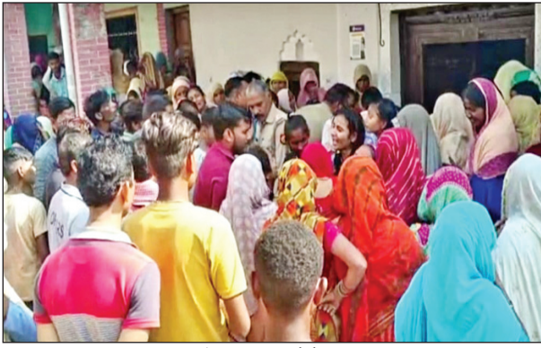
हत्या के बाद लगी लोगों की भीड़