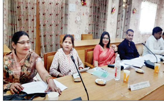
बैठक में उपस्थित सदस्य गण

अनुरक्षण के लिए स्वीकृति प्रदान की गयी तथा ग्रामीण क्षेत्रान्तर्गत निराश्रित गोवंशों व दुर्घटनाग्रस्त बड़े पशुओं के परिवहन के लिए कैटिल केचर व्हीकल के क्रय एवं संचालन की स्वीकृति प्रदान की गयी तथा ऐतिहासिक स्थल पशोपा की सौन्दर्यीकरण के लिए पर्यटन विभाग को प्रस्ताव प्रेषित किये जाने का निर्णय लिया गया। इसी प्रकार के विभिन्न स्थानों पर सम्पत्तियों के सृजन एवं