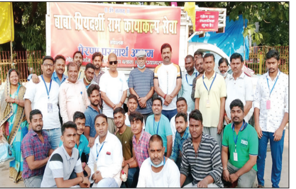
बाबा प्रियदर्शी राम कायाकल्प सेवा

सुचना पर थाना प्रभारी मेजा मय फोर्स मौके पर पहुंचे और लिखापट्टी कर अगली कार्रवाई में जुट गए। जानकारी के अनुसार दोनों युवक आज ही बाहर से आए थे और कहीं घूमने जा रहे थे कि अनियंत्रित टुक ने रौंद दिया। जिससे दोनों की मौत हो गई। इस घटना से क्षेत्र में चर्चा का विषय बना हुआ है।