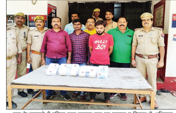
लूट के खुलासे में पुलिस द्वारा बरामद लूट का सामान व गिरफ्त में अभियुक्त

अखंड भारत संदेश पकड़े गए आरोपी नशे के लिए करते थे लूट 200 में बेच देते थे लूटा मोबाईल