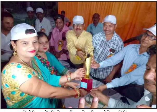
प्रतियोगिता में विजेता टीम को शिल्ड देते अतिथिगण।