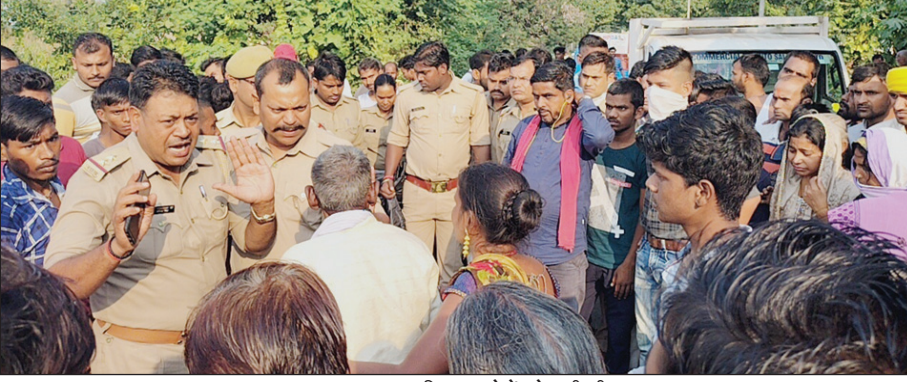
घटनास्थल पर पुलिस व लोगों को लगी भीड़