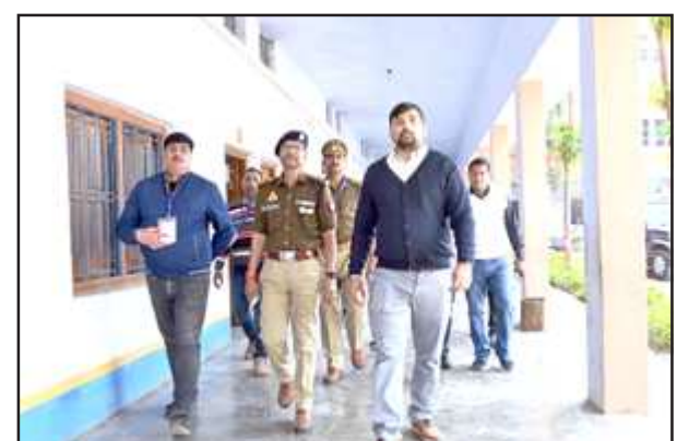
केन्द्रों का निरीक्षण करते डीएम-एसपी।