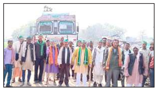
नारेबाजी करते किसान।

याद किया कि आज मायावती का शासन होता तो सीधे डीएम पर ही गाज गिरती। प्रदेश के मुख्यमंत्री योगी आदित्यनाथ को आंधर राजा बहिर पतुरिया जैसा निर्णय न लेकर ऐसा निर्णय लेना चाहिए कि कानून व्यवस्था के मामले में योगी एक नजीर पेश कर सके। लोकतंत्र में भारी अव्यवस्था के चलते उस राजा को कुछ नहीं दिखाता, नर्तकी बहरी है, वह न संगीत सुन सकती न कोई आदेश-टीक यही हाल इन दिनों विधायिका व कार्यपालिका के होते जा रहे हैं।