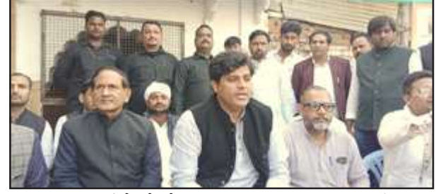
पत्रकारवार्ता में बोलते राज्यसभा सदस्य इमरान प्रतापगढ़ी।

इमरान प्रतापगढ़ी जिला कांग्रेस कमेट्री में निर्धारित पत्रकारवार्ता के समय से आधा घंटा विलम्ब से पहुंचे। उन्होंने