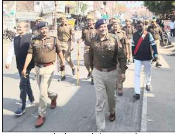
पुलिस परीक्षा के दौरान नगर में पैदल मार्च करते एडीजी।