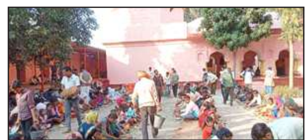
भंडारे में प्रसाद ग्रहण करते श्रद्धालु।