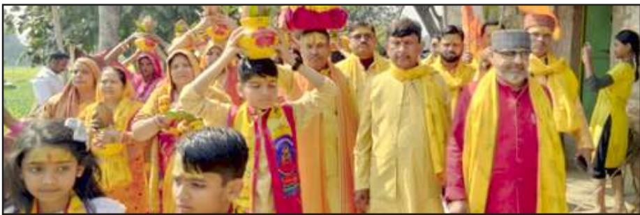
कलश यात्रा में शामिल श्रद्धालुगण।