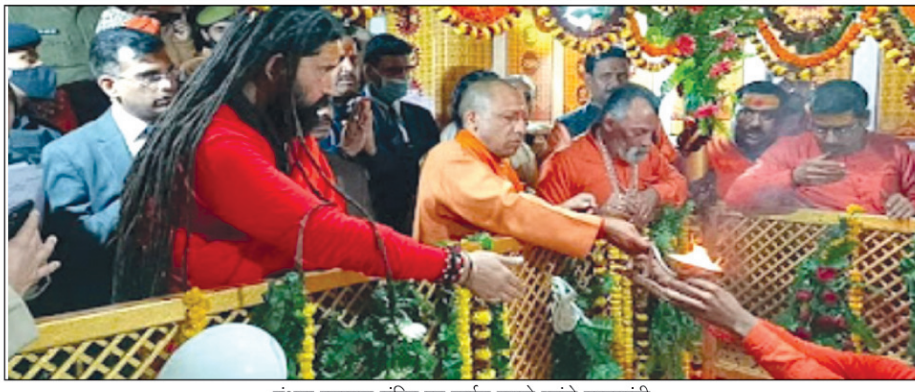
बंधवा हनुमान मंदिर पर दर्शन करने पहुंचे मुख्यमंत्री