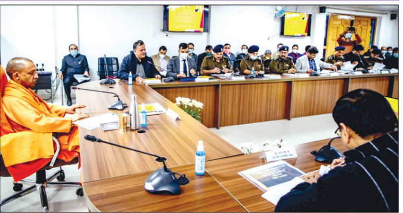
अधिकारियों के साथ बैठक करते मुख्यमंत्री