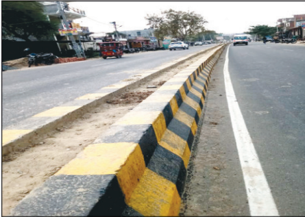
पौधारोपण विहीन डिवाइडर का दृश्य।

कौशाम्बी। नगर पालिका परिषद मंडनपुर द्वारा जनपद मुख्यालय मंडनपुर के समदा रोड के डिवाइडर में 3 महीने पहले पौधारोपण के नाम पर गलत कार्य योजना बनाकर लाखों की रकम लूट ली गई है पौधारोपण के बाद ही सवाल खड़े होने लगे हैं मामले की शिकायत शासन स्तर तक हुई है जिस पर नगर पालिका ने पौधारोपण में अपना बचाव करते हुए फिर से पौधों में पानी देना शुरू कर दिया और पौधे को जीवित करने के नाम पर फिर लाखों की रकम बर्बाद कर दी है लेकिन बिना कार्य योजना के ढाई फीट के डिवाइडर में बड़े पेड़ की डाल लगाए जाने के मामले में नगर पालिका की भूमिका शुरू से सवालियों के घेरे में रही है तमाम प्रयास के बाद भी डिवाइडर में पौधारोपण को नगरपालिका नहीं जीवित कर सकी है 3 महीने के बीच पौधारोपण के नाम पर सरकारी खजाना लूट लिया गया है और जांच के नाम पर बार-बार नगरपालिका के जिम्मेदारों को बचाने का प्रयास हो रहा है आखिर योगी सरकार में सरकारी खजाना लूटने वाले अधिशासी अधिकारी नगर पालिका मंडनपुर के गुनाहों पर कटाई कर चालक अधिकारी इन्हें बचाने का प्रयास करते रहेंगे नगर वासियों ने सरकारी खजाना लूटने वाले अधिशासी अधिकारी मंडनपुर को निलंबित करते हुए पौधारोपण के नाम पर खर्च की गई