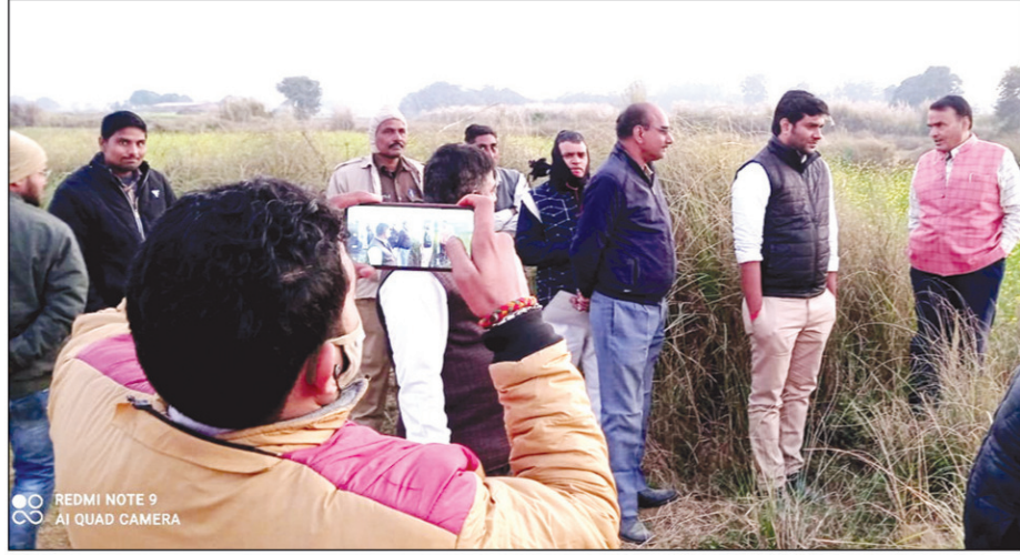
खनन स्थल पर मौजूद तहसील प्रशासन

खनन में लगे कई वाहन तो भाग निकले किन्तु मौके पर दो हाड़वा और एक खनन मशीन को प्रशासन ने हिरासत में ले लिया। ग्रामीणों ने बताया कि जिस जगह अवैध खनन किया जा रहा है वह अति महत्वपूर्ण और रिंग रोड हेतु प्रस्तावित जमीन है जिसमें पत्थर गड्डी भी हो चुकी है किन्तु सुनियोजित तरीके से और जिम्मेदार लोगों की मिली भगत से यह अवैध खनन किया जा रहा है मिशन के लोगों ने बताया कि इसके पहले भी प्रशासन के कुछ लोगों की मिली भगत से घोघापुर व आस-पास के गांवों में खनन कराया जा रहा था जिसे लेकर मिशन और ग्रामीणों ने तत्कालीन जिलाधिकारी से शिकायत करते हुए काम को रोकवा दिया गया था।