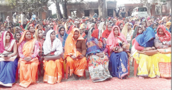
अमृत महोत्सव में मंच पर उपस्थित लोग व सामने बैठी महिलाएं

ब्लाक परिसर में आयोजित कार्यक्रम में वंदे मातरम का हुआ गायन, निकाली गई तिरंगा यात्रा