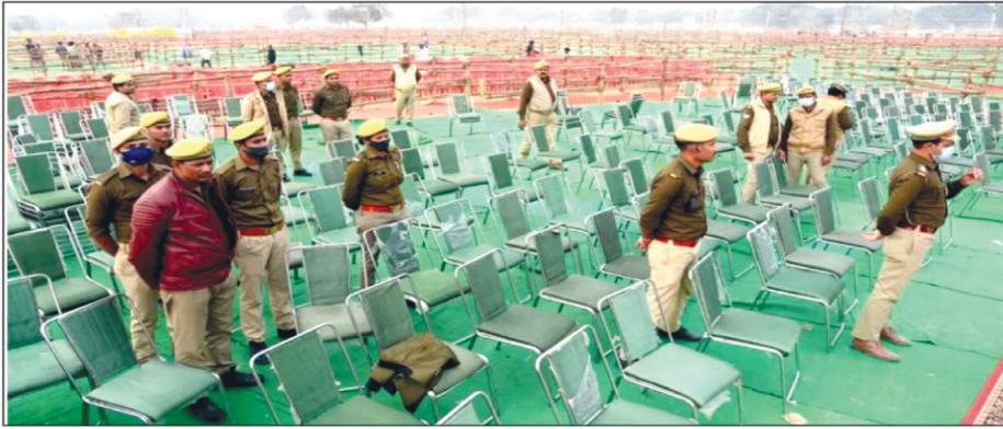
रैली के दौरान आने वाले लोगों के लिए लगाया गया कुर्सी