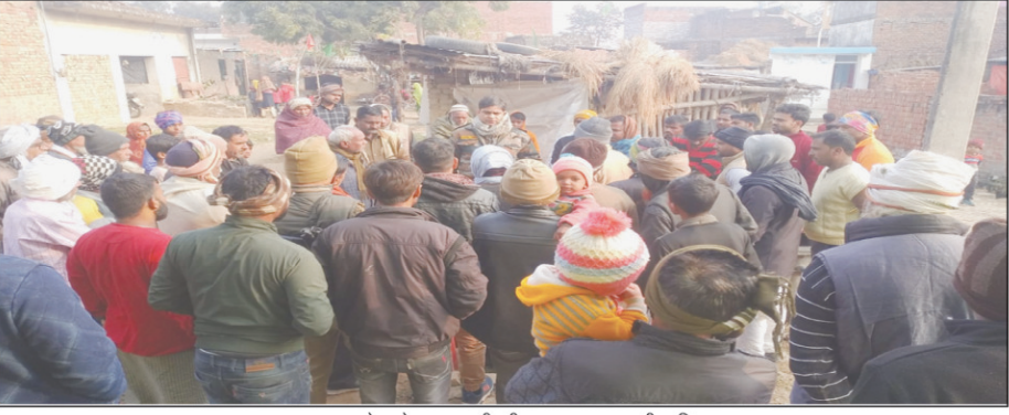
मृतक अधेड़ के घर जुटी भीड़ पूछताछ करती पुलिस