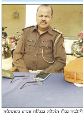
कोराव थाना पुलिस कोराव पीस कमेटी की बैठक में विचार व्यक्त करते हुए