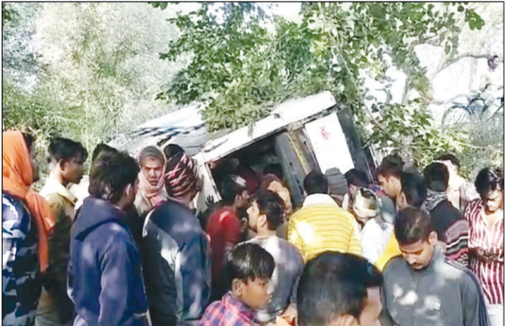
हादसे के बाद घटनास्थल पर जुटी ग्रामीणों की भीड़

कौशाम्बी। अवैध डगमगार बसों का संचालन परिवहन विभाग यातायात पुलिस और थाना पुलिस के संरक्षण में हो रहा है इन बस चालकों के कारनामों से आए दिन हादसे होते हैं और हादसे के चलते तमाम जिंदगी हादसे की शिकार हो जाती है कुछ लोगों की मौत हो जाती है कुछ लोग अस्पताल में जीवन और मौत से जूझते हैं और तमाम लोग पूरी जिंदगी के लिए अपाहिज हो जाते हैं लेकिन इन घटनाओं के बाद भी पुलिस आला अधिकारी जिला प्रशासन और नेता मंत्री दुष्ट ड्राइवरों के प्रति कार्यवाही करने का थानेदारों पर दबाव बनाने के बजाय मामले को टंडे बस्ते में डाल देते हैं जिससे दूसरे ड्राइवरों के हासिले बुलंद हैं और आए दिन हादसे होते हैं महेवा घाट मंडनपुर से इलाहाबाद सड़क पर चलती बस से कूद जाने से कई हादसे पूर्व में हो चुके हैं सिराथू करारी से बेनीराम कटरा होते हुए इलाहाबाद रोड पर चलने वाली प्राइवेट बसों के चालकों के चलती बस से कूद जाने से पहले कई हादसे हो