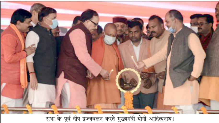
सभा के पूर्व दीप प्रज्वलन करते मुख्यमंत्री योगी आदित्यनाथ।

मुख्यमंत्री ने 553.81 करोड़ की 378 परियोजनाओं का किया शिलान्यास