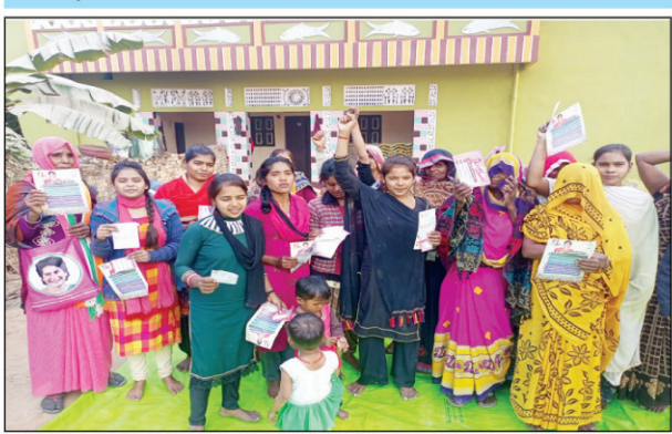
कांग्रेस के कार्यक्रम में मौजूद महिलाएं

लड़की हूँ लड़ सकती हूँ महिला शक्ति की आवाज, सिराथू बिदन पुर ककोड़ा गांव के कार्यक्रम में दर्जनों महिलाओं ने ग्रहण की सदस्यता