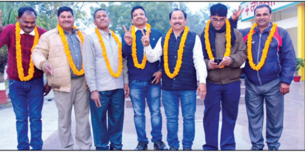
इफको रिक्रियेशन क्लब के चुनाव में निर्वाचित पदाधिकारी