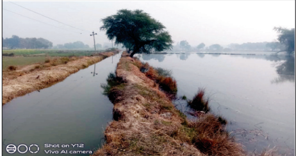
जलमग्न गेहूं की फसल

कौशाब्बी। योगी सरकार में सिंचाई विभाग और नहर विभाग के अधिकारियों की लापरवाही का एक बार फिर खामियाजा किसानों को भुगतना पड़ा है विभाग की लापरवाही के चलते सैकड़ों हेक्टेयर गेहूं की फसल बर्बाद हो गई है लेकिन किसानों की बर्बादी पर अभी तक जनप्रतिनिधियों ने भी विभाग के लापरवाह अधिकारियों को नकेल अभी तक नहीं कसी है मंडनपुर तहसील क्षेत्र के सरसवा ब्लाक अंतर्गत किशुनपुर कैनाल पंप से जुड़ने वाली पुनवार माइनर कट जाने से भोलेनाथ का पूरा रतन का डेरा सहित इलाके के सैकड़ों किसानों की सैकड़ों हेक्टेयर गेहूं की फसल जलमग्न हो गई है नहर का पानी खेतों में भर गया है जिससे सैकड़ों हेक्टेयर गेहूं की