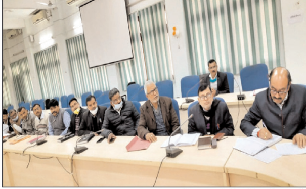
बैठक करते जिलाधिकारी व शामिल विभिन्न विभाग के मौजूद अधिकारी