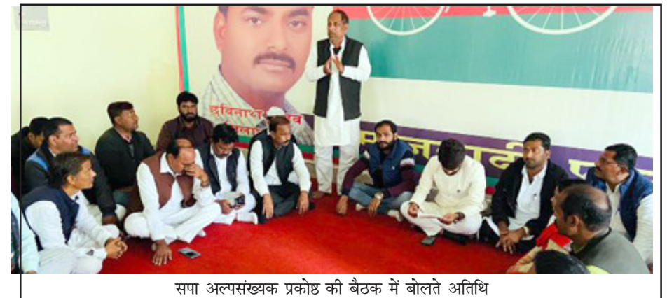
सपा अल्पसंख्यक प्रकोष्ठ की बैठक में बोलते अतिथि