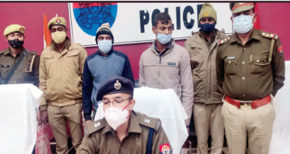
प्रेस कॉन्फ्रेंस कर जानकारी देते पुलिस के अधिकारी व गिरफ्त में प्रेमी

दूसरे से बात करने से नाराज था आरोपी प्रेमी, अपने जीजा के साथ पहुंचा था मृतक प्रेमिका के गांव