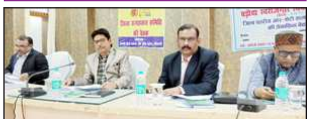
बैठक को संबोधित करते हुए मुख्य विकास अधिकारी

बैंक में ऋण जमानुपात में प्रगति मानक के अनुरूप न पाये जाने पर सीडीओ ने नाराजगी प्रकट करते हुए सम्बन्धित बैंकर्स को प्रगति लाने के लिए निर्देश