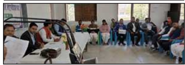
एमडीपीजी में आयोजित प्रतियोगिता में प्रतिभाग करते प्रतिभागी।

युवोत्सव-2022 के तहत एमडीपीजी कालेज में हुई जनपदीय प्रतियोगिताएं