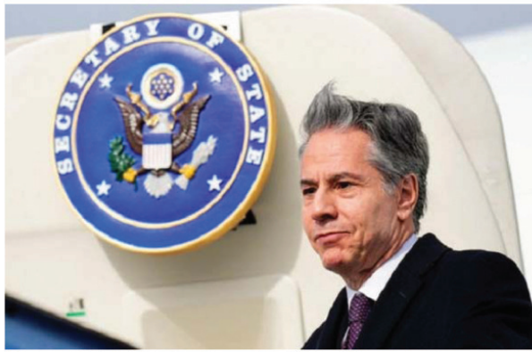
की तरफ से बार-बार परमाणु हमले की धमकी दी गई। यह निश्चित रूप से चिंता का विषय है। उन्होंने कहा कि अमेरिका ने चीन और भारत सहित उन देशों से युद्ध को खत्म करवाने का आग्रह

एक साक्षात्कार में ब्लिंकन ने यूक्रेन पर रूसी हमले के एक साल पूरे होने पर तमाम सबलों के बेबाकी से जवाब दिये। उन्होंने कहा कि पुतिन इस युद्ध में ज्यादा तर्कहीन रूप से प्रतिक्रिया कर सकते हैं। युद्ध के दौरान मास्को