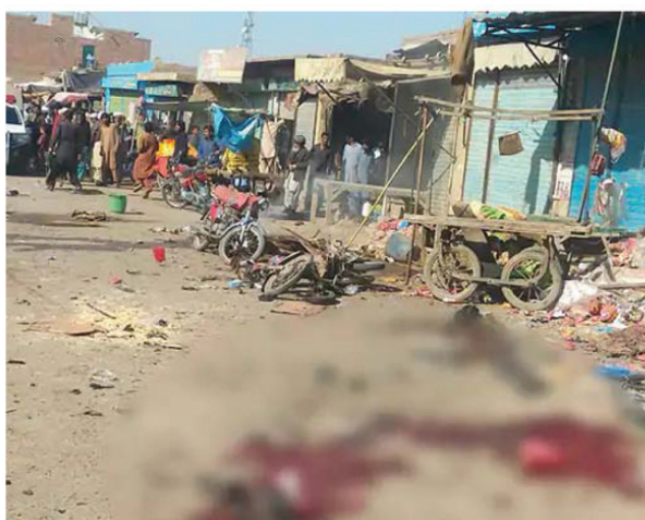
रास्ते में एक बाइक खड़ी की गई थी। इसमें IED प्लांट किया गया था। इसमें ही धमाका हुआ। गंभीर है, जिसके चलते मरने वालों का आंकड़ा बढ़ सकता है। मौके पर पहुंची पुलिस टीम जांच कर रही है।