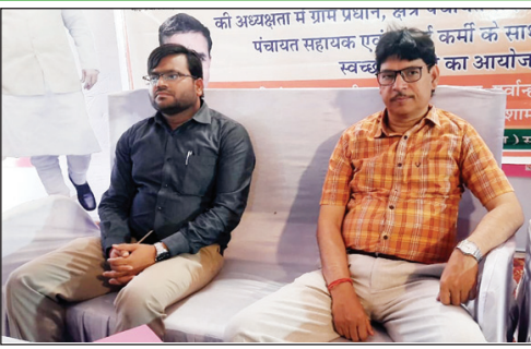
गोष्ठी में उपस्थित सीडीओ तथा उपस्थित ग्राम प्रधान व अन्य

विगत 05 वर्षों में 216378 शौचालयों का निर्माण कराया गया, जिससे शौचालय के आच्छादन के उपरान्त जनपद खुले में शौच से मुक्त हुआ। वित्तीय वर्ष 2022-23 में खुले में शौचमुक्त होने के उपरान्त कतिपय कारणों से छूटे हुये 5164 व्यक्तिगत शौचालय का निर्माण कराया गया। ग्राम पंचायत में निर्मित 451 सामुदायिक शौचालयों की देखरेख के लिए प्रत्येक सामुदायिक शौचालय में स्वयं सहायता समूह के माध्यम से केयर टेकर की तैनाती कर दी गयी है। शासन की प्राथमिकता के क्रम में 5000 से अधिक आबादी वाली 35 ग्राम पंचायतों में ठोस एवं तरल अपशिष्ट प्रबन्धन के अन्तर्गत ओडीएफ प्लस बनाने के लिए 17 गतिविधियों पर कार्य कराया गया।