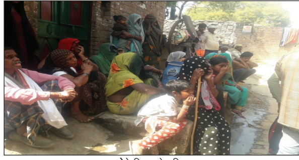
रोते बिलखते परिजन