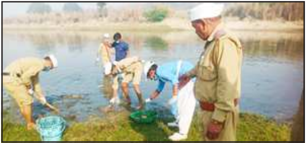
सई नदी घाट की सफाई करते संत निरंकारी मिशन के कार्यकर्ता।