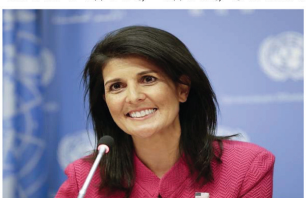
जो कि रूस के राष्ट्रपति व्लादिमीर पुतिन का सबसे करीबी दोस्त है। हमें आंतकवाद का प्रायोजक करार देती है।' हेली ने यह भी