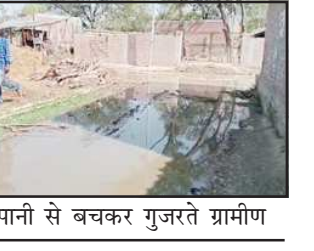
गंदे पानी से बचकर गुजरते ग्रामीण

परियावां, प्रतापगढ़। एक तरफ केंद्र की मोदी व प्रदेश की योगी सरकार ग्राम पंचायतों को स्वच्छ व साफ पंचायत बनाये रखने के लिए ग्राम पंचायत के ग्राम प्रधानों को बेहिसाब उनके खाते में पैसा भेज रही है इसके बावजूद भी ग्राम पंचायत बजहाभीट के मुख्य मार्ग पर आने जाने वाले रास्ते में ग्राम प्रधान की उदासीनता के चलते घरों का गंद पानी भरा हुआ है जिससे ग्राम वासी रास्ते में भरे गन्दा पानी से मजबूर होकर गुजरते हैं जिसकी परवाह न तो ग्राम प्रधान को है और न ही जिम्मेदार ग्रामपंचायत सचिव की है जिसका खाभियाजा ग्रामवासी भुगत रहे हैं। रास्ते में भरे गन्दा पानी की शिकायत ग्रामवासी लोगों ने कई बार ग्राम प्रधान से कहा कोई सुनवाई न होने पर ग्रामीणों ने मामले को 112 पुलिस को शिकायत पत्र देते हुए अवगत कराया लेकिन समस्या ज्यों की त्यों बनी हुई है। अभी हाल ही में उक्त ग्राम पंचायत अब नगर पंचायत मानिकपुर से जोड़ दिया गया जो वार्ड बन चुका है लेकिन अभी भी विकास से सम्बंधित सभी कार्य ब्याक मुख्यालय कालाकार से हो रहे हैं। गांव