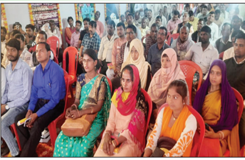
गोष्ठी में उपस्थित सीडीओ तथा उपस्थित ग्राम प्रधान व अन्य

विगत 05 वर्षों में 216378 शौचालयों का निर्माण कराया गया, जिससे शौचालय के आच्छादन के उपरान्त जनपद खुले में शौच से मुक्त हुआ। वित्तीय वर्ष 2022-23 में खुले में शौचमुक्त होने के उपरान्त कतिपय कारणों से छूटे हुये 5164 व्यक्तिगत शौचालय का निर्माण कराया गया। ग्राम पंचायत में निर्मित 451 सामुदायिक शौचालयों की देखरेख के लिए प्रत्येक सामुदायिक शौचालय में स्वयं सहायता समूह के माध्यम से केयर टेकर की तैनाती कर दी गयी है। शासन की प्राथमिकता के क्रम में 5000 से अधिक आबादी वाली 35 ग्राम पंचायतों में ठोस एवं तरल अपशिष्ट प्रबन्धन के अन्तर्गत ओडीएफ प्लस बनाने के लिए 17 गतिविधियों पर कार्य कराया गया।