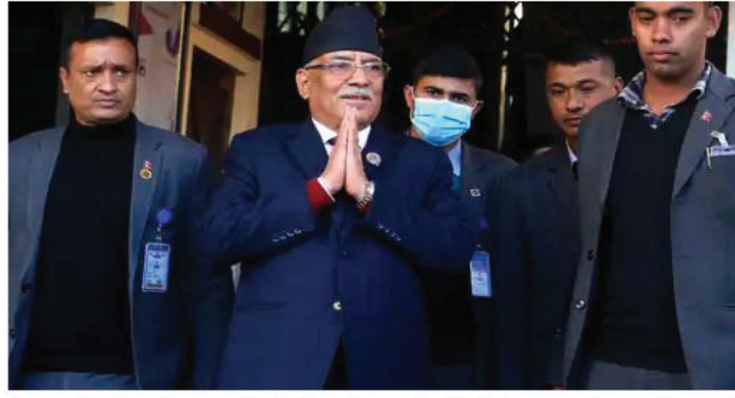
नेपाल की संसद में 275 सीट हैं, जिसमें RPP की 14 सीटें हैं। इसके साथ ही वो 5वीं सबसे बड़ी पार्टी है। इस्तीफा देने वाले मंत्रियों के पास कई अहम विभाग थे नेपाल के PM ऑफिस ने 4 मंत्रियों के इस्तीफे की बात स्वीकार की है।

हालांकि, जिन मंत्रियों ने इस्तीफा दिया है, उनकी पार्टी ने अब तक आधिकारिक तौर पर सरकार से समर्थन वापस नहीं लिया है। अगर ऐसा होता है तो प्रचंड सरकार खतरे में आ सकती है।