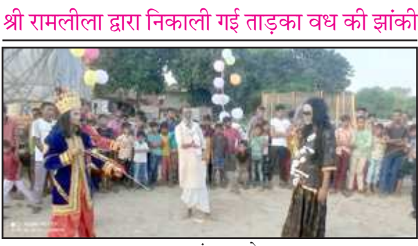
ताड़का वध का मंचन करते कलाकार।

प्रतापगढ़। श्री रामलीला समिति द्वारा तीसरे दिन मुनि आगमन, ताड़का वध की झांकी निकाली गई। तीन बजे दिन में गोपाल मंदिर से ताड़का वध, मुनि आगमन की झांकी निकलकर चैक होते हुए सदर बाजार, सदर बाजार से वापस चैक होते हुए बाबागंज, पुराना माल गोदाम रोड से स्टेशन होते हुए निर्मल तिराहा होते हुए वापस पंजाबी मार्केट होते हुए गोपाल मंदिर आकर लीला को विश्राम दिया गया।