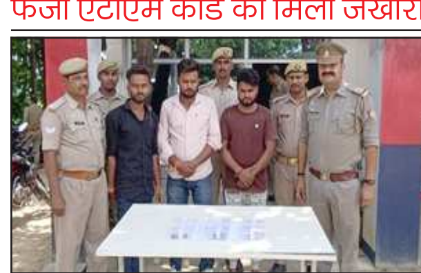
लीलापुर पुलिस के हथिये चढ़े एटीएम जालसाज।

दौडाकर पकड़ा तो उनके पास से देख आवाक रह गयी। पुलिस को एटीएम कार्डों का जखीरा बरामद हिरासत में आये लीलापुर थाना