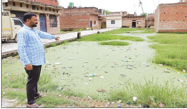
लालगोपालगंज के खानजहानपुर मोहल्ला में आबादी के बीच भरा पानी।

लालगोपालगंज। विशेषज्ञों के अनुसार डेंगू मच्छर पैदा होने के लिए एक चम्मच पानी ही काफी है। संचारी रोग और डेंगू, मलेरिया जैसी जानलेवा बीमारियों से बचाव के लिए शासन लगातार अलग-अलग संस्थाओं को क्षेत्र में भेज कर बचाव के लिए जागरूक कर रहे हैं। लेकिन स्थानीय कस्बा में घनी आबादी के बीच गड्डा तालाब में तब्दील हो गया है। जहां इस तरह की बीमारियों के फैलने की संभावनाएं प्रबल हो गई हैं। लालगोपालगंज नगर पंचायत के वार्ड नंबर दो खानजहानपुर मोहल्ला में साफ सफाई एवं स्वच्छता ताक पर है। कहने को नगर पंचायत में दर्जनों सफाई कर्मियों की तैनाती जरूर है। लेकिन उक्त वार्ड में नई आबादी के बीच