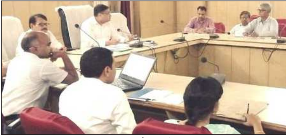
राष्ट्रीय बाल स्वास्थ्य कार्यक्रम सम्बन्धी बैठक में बोलते डीएम डा0 नितिन बंसल।

जिलाधिकारी ने विकास उपचारित तथा रेफर किये गये बच्चों की समीक्षा की। जिलाधिकारी ने मुख्य चिकित्साधिकारी को निर्देशित किया कि विकास खण्डवार तैनात टीमों में यह सुनिश्चित करें कि