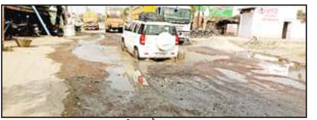
पहाड़ी कस्बे का गड्ढा।

मंगलवार को पहाड़ी ब्लॉक मुख्यालय के पहाड़ी-राजापुर मार्ग स्थित नेशनल हाईवे 731ए मार्ग पर भारी गड्ढा मौत का वात दे रहा है। कभी भी कोई बड़ा हादसा हो सकता है। राजापुर रोड स्थित