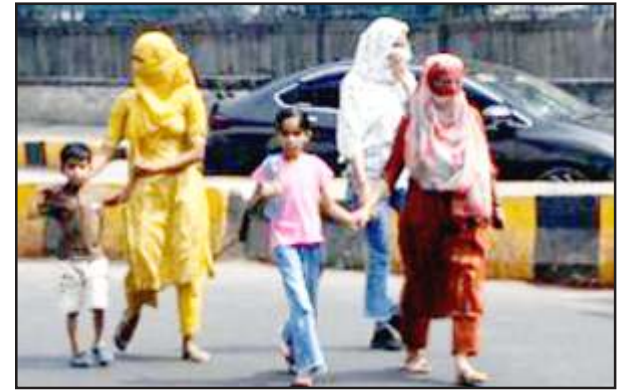
गर्मी से मुंह ढककर चलती महिलाएं।

सुबह नौ बजे के बाद से शाम सात बजे तक लू चलने से लोगों का बाहर निकलना कम हो गया है। जो लोग किसी आवश्यक कार्य से निकलते भी हैं, वह मुंह और सिर बांधकर निकलते हैं। जिन व्यक्तियों की प्रतिरोधक क्षमता कम या कमजोर है, वह इस गर्मी का शिकार हो रहे हैं। बुखार, दस्त के मरीज बढ़ गये हैं। अब लू चलने से लोगों को खतरा और बढ़ गया है। लोगों का कहना है कि हर वर्ष से ज्यादा इस वर्ष गर्मी पड़ रही है। जैसे यह ज्येष्ठ का महीना है, इस