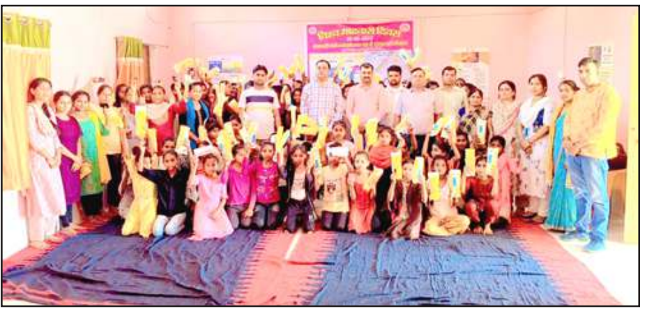
सेनेटरी पैड बांटते स्वास्थ्य कर्मी।

अखंड भारत संदेश पहाड़ी/चित्रकूट। सामुदायिक स्वास्थ्य केंद्र पहाड़ी के मुहर्वा गांव में किशोरियों के साथ माहवारी स्वच्छता प्रबंधन में सभी किशोरियों को निःशुल्क सेनेटरी पैड व आयरन कैंपिंग की गोलियां बांटी गईं।