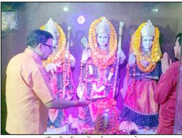
हनुमान मंदिर चिलबिला में दर्शन पूजन करते श्रद्धालु।

पूजन अर्चन व सुंदरकांड का पाठ कर हजारों भक्तों ने ग्रहण किया प्रसाद