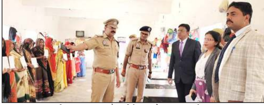
जिला कारागार का औचक निरीक्षण करते जनपद न्यायाधीश।