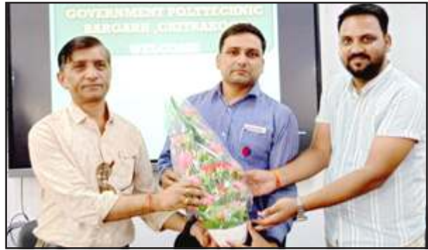
अतिथियों का स्वागत करते प्रधानाचार्य।

मंगलवार को साक्षात्कार को ऑनलाइन पंजीयन 1270 छात्रों