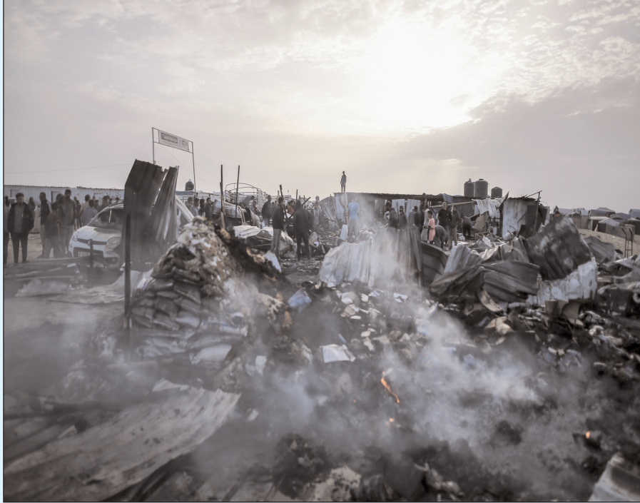
संख्या 36,050 पहुंच गई है। बेन्जामिन नेतन्याहू ने इस हमले को लेकर अपनी गलती मानी है। नेतन्याहू ने कहा कि सैन्य कार्रवाई का उद्देश्य किसी भी इंसान को नुकसान पहुंचाना नहीं था। इस

इजराइल के प्रधानमंत्री बेन्जामिन नेतन्याहू ने इस सैन्य कार्रवाई पर अफसोस जताया है। उन्होंने कहा है, "बहुत बड़ी गलती हो गई"। प्रत्यक्षदर्शियों का कहना है कि हवाई हमले की वजह से विस्थापित लोगों के तंबुओं में आग लग गई और लगभग 45 लोगों की झुलसने से मौत हो गई। उल्लेखनीय है कि सात अक्टूबर, 2023 से जारी इजराइल के हमलों में मरने वाले फिलिस्तीनियों की संख्या 36,050 पहुंच गई है।