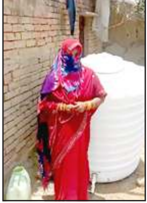
पेयजल संकट से जूझ रहे ग्रामीण।