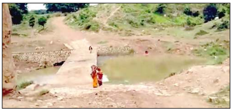
पुल को तरस रहा बुंदेला नाला।

मंगलवार को चुनावी मौसम की बयार में बुंदेला नाला पर पुल निर्माण की बात चली है। प्रयागराज व चित्रकूट को जोड़ने वाले इस जर्जर बुंदेला नाला पुलिया में आये दिन हादसे होते हैं। लोग बाग जान हथेली पर रख के यात्रा करते हैं। इसके निर्माण की खास पहल साकार होती नहीं दिख रही। वैसे तो बुंदेला नाला एक बरसाती नदी है, जो शंकरगढ़ की पहाड़ियों से निकल कर प्रयागराज के लालपुर थाने के प्रतापपुर के पास यमुना नदी