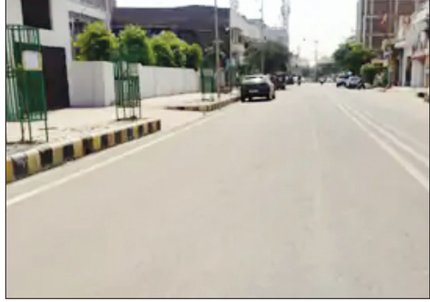
अखंड भारत संदेश

मजदूर बेहोश हुआ, चिलचिलाती धूप में सड़कों पर दिखा सन्नाटा, सूखने लगा गंगा का पानी