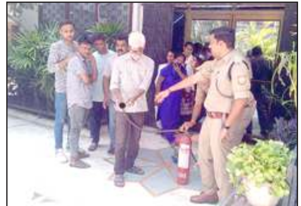
अस्पताल परिसर में फायर ड्रिल कर लोगों को जानकारी देते अधिकारी।

मॉक ड्रिल/फायर ड्रिल कराकर लोगों को किया जागरूक