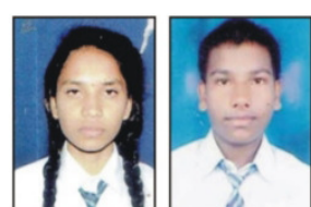
मौरस कुशावा टिकरी 82.4%