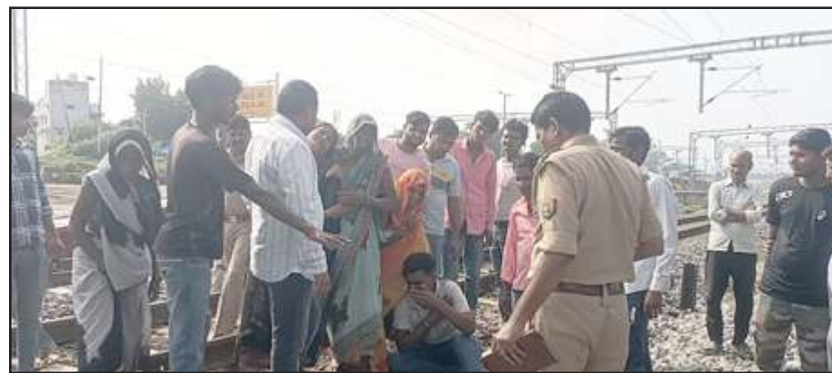
मौत पर रोते-बिलखते परिजन।

प्रतापगढ़। चिलबिला रेलवे स्टेशन पर रेलवे लाइन के किनारे एक युवक और युवती की लाश मिलने से सनसनी फैल गई। दोनों की मौत ट्रेन की चपेट में आने से हुई है। दोनों एक दूसरे को जानते और पहचानते थे। पुलिस की जांच में पता चला है कि दोनों आपस में प्रेम करते थे। युवक विवाहित है। वह पुलिस भर्ती प्रवेश परीक्षा देने घर से निकला था। पुलिस को दोनों के मोबाइल मिले हैं। जीआरपी ने परिजनों को सूचित किया। दोनों के शव को कब्जे में लेकर पोस्ट मार्टम के लिए भेज दिया है। इस घटना को लेकर चर्चाओं का बाजार गर्म है। रविवार रात में जीआरपी को सूचना मिली कि युवक और युवती की लाश चिलबिला रेलवे स्टेशन पर रेलवे लाइन के किनारे पड़ी है।