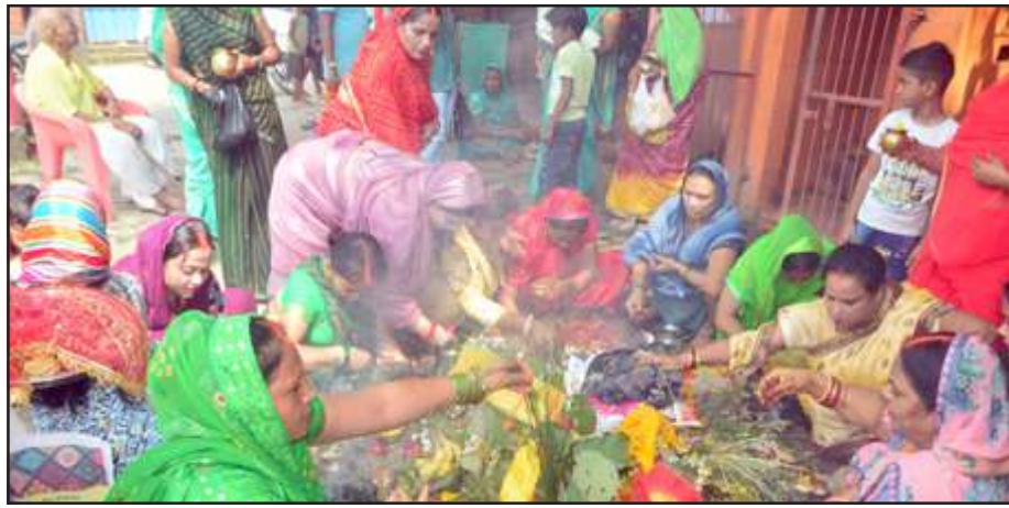
ललही छठ पर पूजन अर्चना करती महिलाएं।