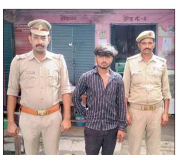
पुलिस गिरफ्त में दुष्कर्म आरोपी।