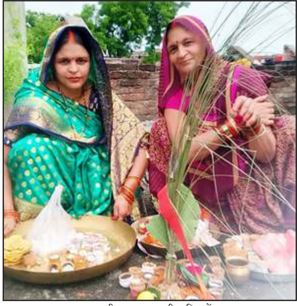
हलषष्ठी का व्रत करती महिलायें।