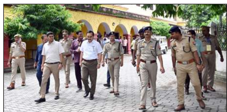
परीक्षा का जायजा लेते कमिश्नर-डीआईजी आदि।