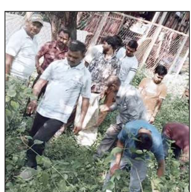
बोगन बेलिया लगाते समिति के लोग।