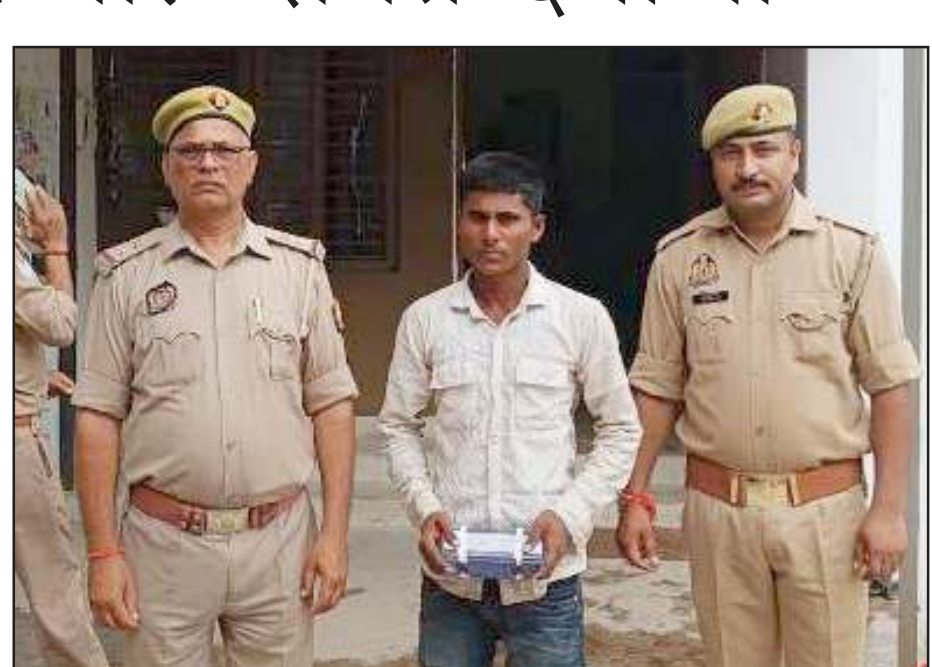
पुलिस गिरफ्त में चोर।