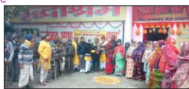
वृद्धाश्रम में ध्वजारोहण करते मुख्य अतिथि।