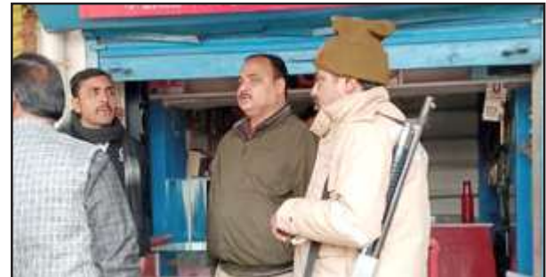
घटना के बारे में दुकानदार से पूछताछ करती नवाबगंज पुलिस।