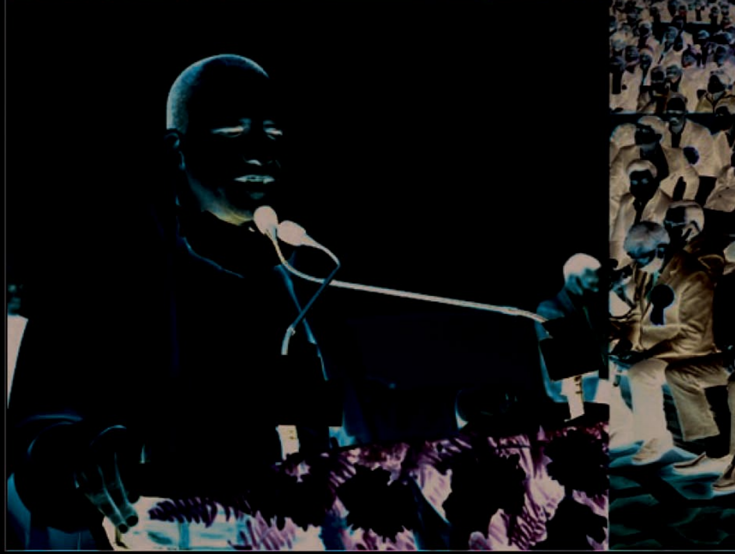
अधिवक्ता समागम कार्यक्रम को संबोधित करते मुख्यमंत्री

आप लोगों के सहयोग से सम्भव हो पाया है। आज भारत इस बीमारी पर विजय की ओर बढ़ रहा है। इसमें 30प्र0 का सबसे बड़ा योगदान है। वैकसीन आने की तैयारी है, इसके सुचारु रूप से क्रियान्वयन के लिए प्रदेश ने कमर कस ली है। आज भारतीय संस्कृति को पूरी दुनिया सम्मान दे रही है और अपना रही है। मा0 प्रधानमंत्री जी के नेतृत्व में भारत पूरी दुनिया में अपना प्रमुख स्थान बनाते हुए आज आत्मनिर्भरता की ओर तेजी से आगे बढ़ रहा है। उन्होंने कहा कि इसी क्रम में प्रदेश सरकार द्वारा चलाये जा रहे एक जनपद एक उत्पाद योजना देश एवं प्रदेश को आत्मनिर्भर बनाने में मील का पत्थर साबित हो रही है। आत्मनिर्भर बनाने हेतु कार्यक्रम चलाये जा रहे है, हमारे परम्परागत उत्पाद ही हमें आत्मनिर्भरता के लिए हमें अपनी सोच बड़ी करनी होगी। मा0 मुख्यमंत्री जी ने कहा कि आज प्रदेश भय मुक्त है, किसी भी माफिया को बखशा नहीं जायेगा। उनके अवेध तरीके से