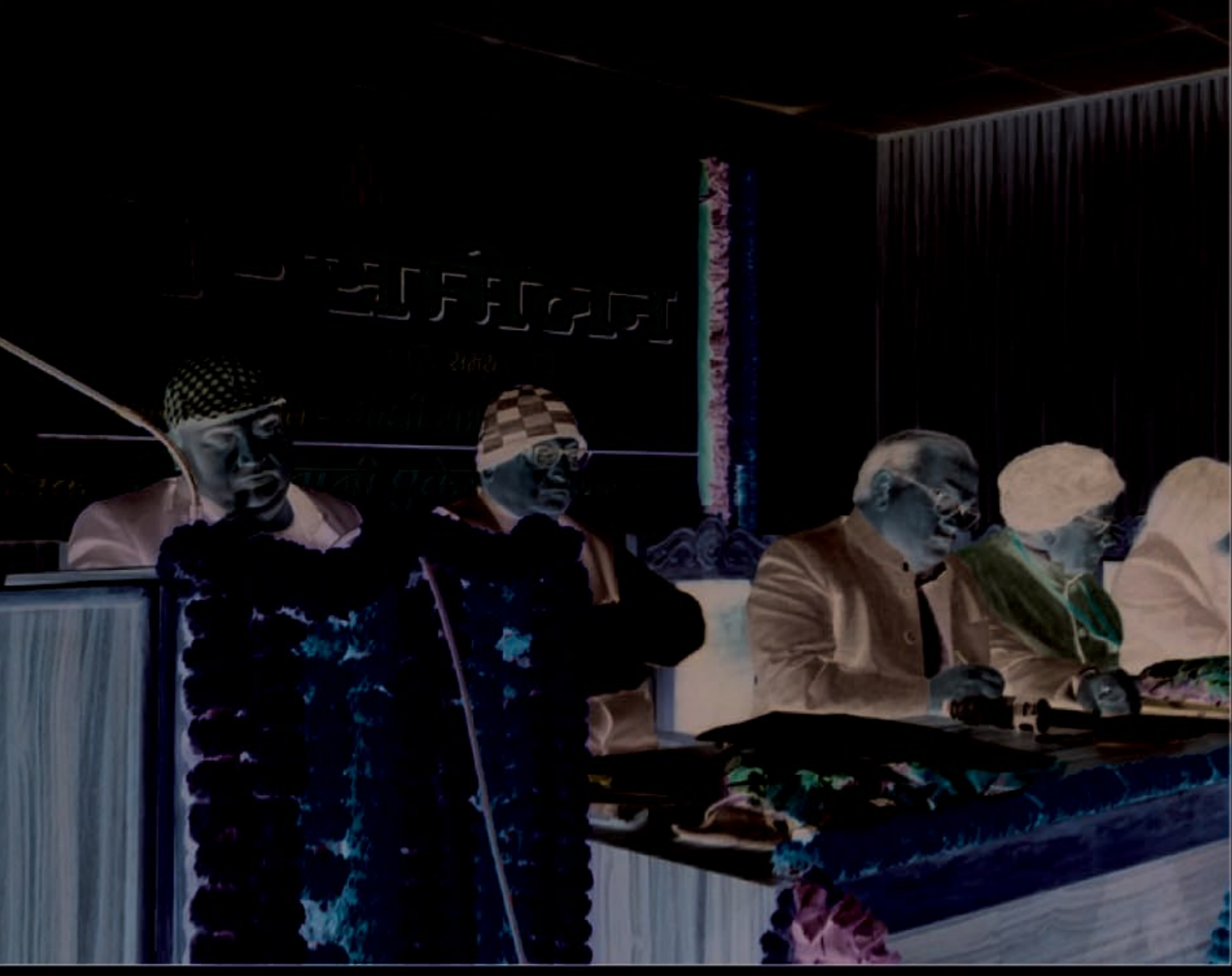
कवि सम्मेलन में कवि पाठ करते कवि