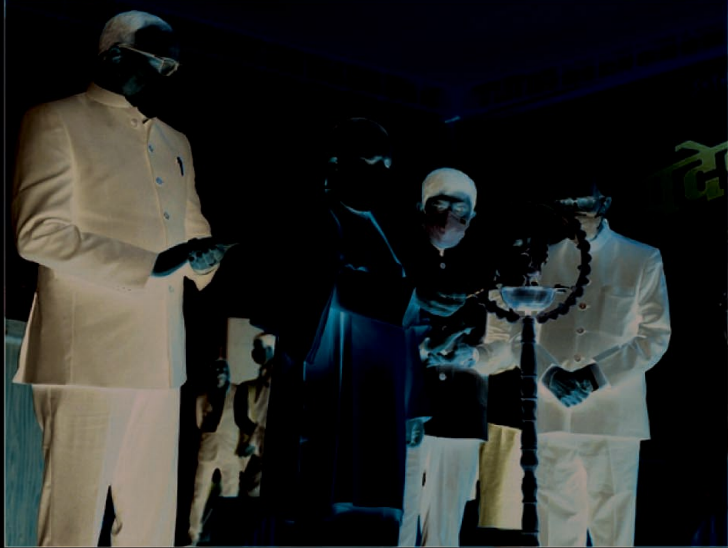
दीप प्रज्ज्वलित कर कार्यक्रम का शुभारंभ करते मुख्यमंत्री

प्रयागराज। मा0 मुख्यमंत्री योगी आदित्यनाथ जी ने बुधवार को के0पी0 कालेज ग्राउण्ड में उत्तर प्रदेश राज्य विधिक परिषद एवं इलाहाबाद हाईकोर्ट बार एसोसिएशन के संयुक्त तत्वाधान में आयोजित प्रदेश अधिवक्ता समागम-2020 के कार्यक्रम में बतौर मुख्य अतिथि के रूप में सम्मिलित हुए। कार्यक्रम के प्रारम्भ में मा0 मुख्यमंत्री जी ने सर्वप्रथम दीप प्रज्ज्वलित कर अधिवक्ता समागम कार्यक्रम की शुरुआत की। इस अवसर पर मा0 मुख्यमंत्री जी ने अधिवक्ता समागम कार्यक्रम में शामिल होने के आमंत्रण पर बार कौंसिल एवं इलाहाबाद बार एसोसिएशन का आभार व्यक्त किया। मा0 मुख्यमंत्री जी ने ज्ञान, आस्था एवं न्याय की धरती प्रयागराज को कोर्टि-कोर्टि नमन कर समागम में उपस्थित अधिवक्ताओं को सम्बोधित करते हुए कहा कि अधिवक्ताओं समाज अपने से हारता है तो वह भौतिक रूप से अधिवक्ता के पास जाता है। आपकी वेशभूषा विश्वास का प्रतीक है। उन्होंने कहा कि विश्वसनीयता जब तक बनी रहेगी