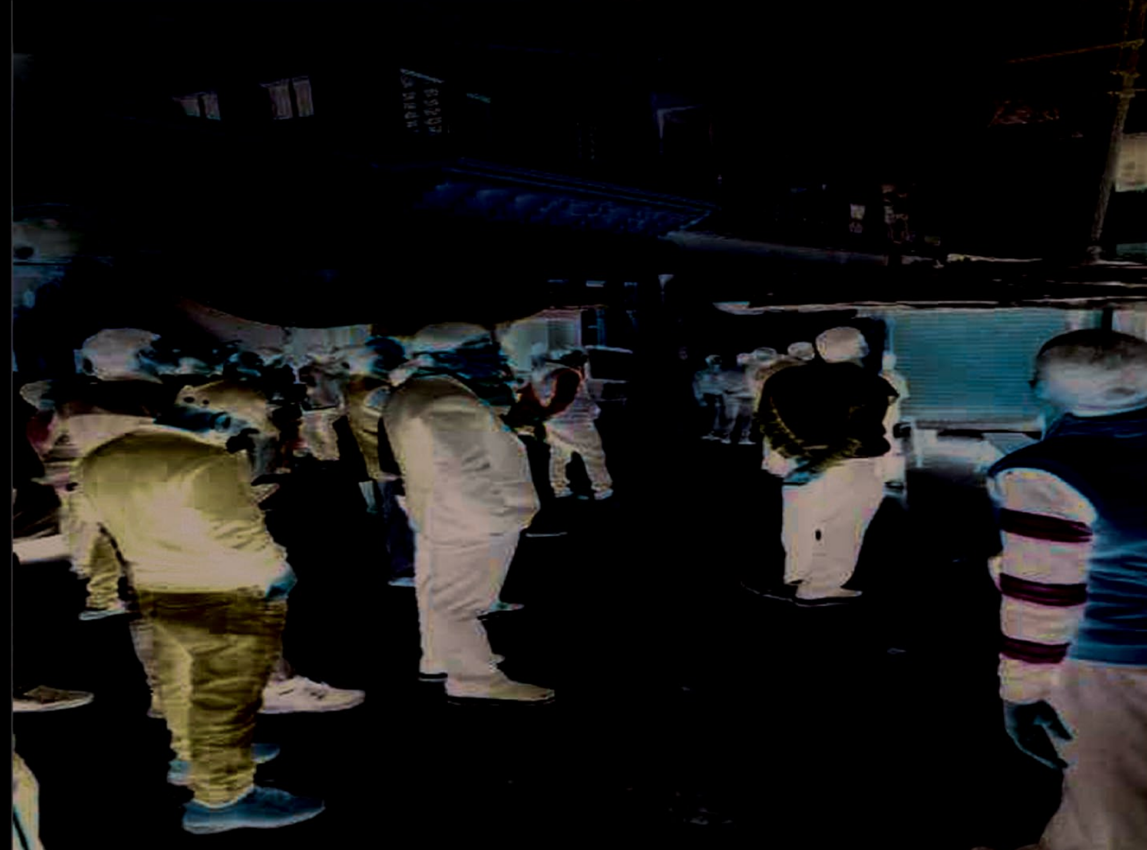
कटियामारो के खिलाफ कार्रवाई करती प्रवर्तन टीम