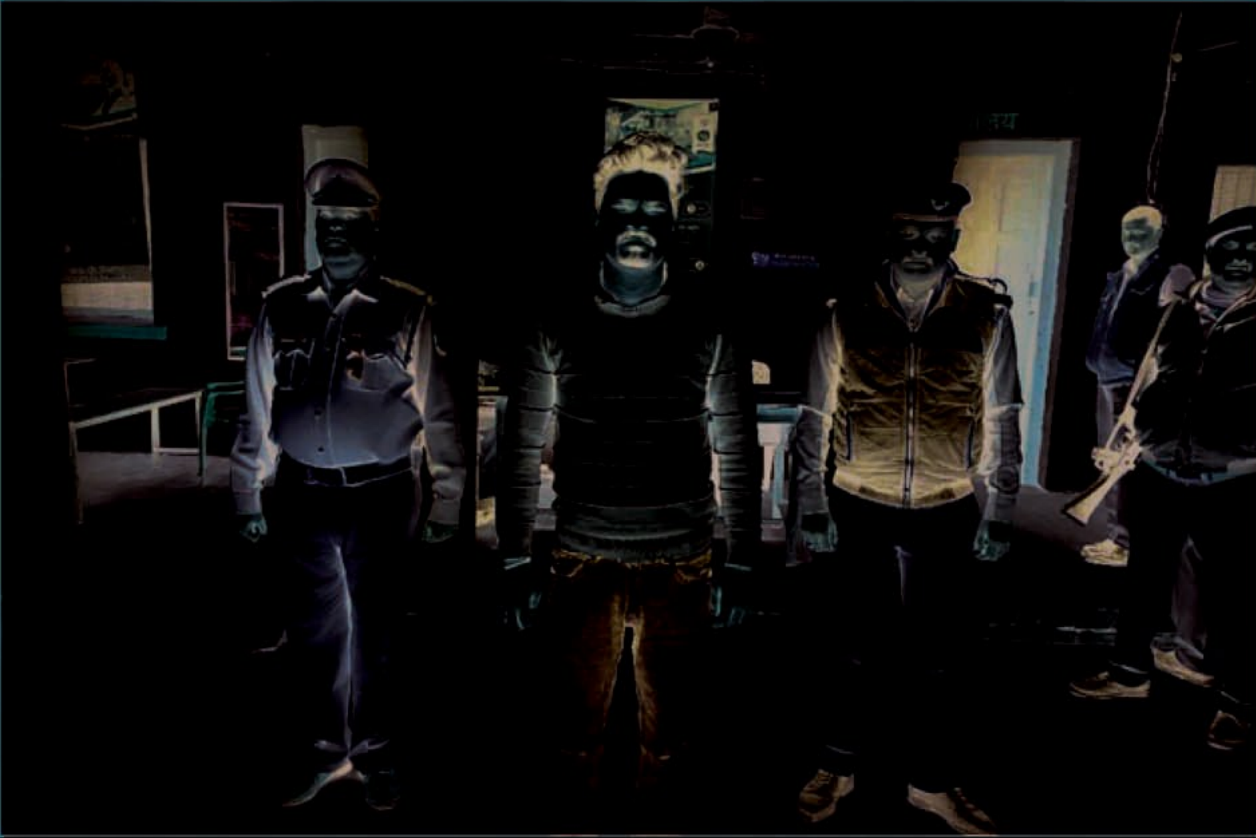
संगठित अपराध में लिप्त ईनामिया पुलिस की गिरफ्त में

कोखराज कौशांबी। उत्तर प्रदेश सरकार के मुख्यमंत्री योगी आदित्यनाथ का प्रयागराज में 16 दिसंबर को कार्यक्रम लगा हुआ है मुख्यमंत्री की सुरक्षा व्यवस्था के मद्देनजर कौशांबी जिले की पुलिस को भी वाहनों की जांच करने का निर्देश पुलिस महानिदेशक द्वारा भेजा गया था। इसी क्रम में कोखराज थाना पुलिस पिपरी और पुरामुफ्ती पुलिस अपने हमराहियों के साथ सड़कों पर बुधवार की सुबह से ही वाहनों की जांच पड़ताल चेकिंग में लग गईं थाना पुलिस का यह वाहन चेकिंग पूरे दिन चलता रहा भारी वाहनों को पुलिस ने जाने से रोक दिया। कोखराज पुलिस ने टोल प्लाजा के पास वाहनों की गहन चेकिंग की है पुलिस को चेकिंग के दौरान एक भी गलत वाहन उस दिशा से नहीं गुजर सका है पुलिस को सख्तों देखकर तमाम वाहन चालकों ने इस टंड के महीने में भी पसीना छोड़ दिया है।