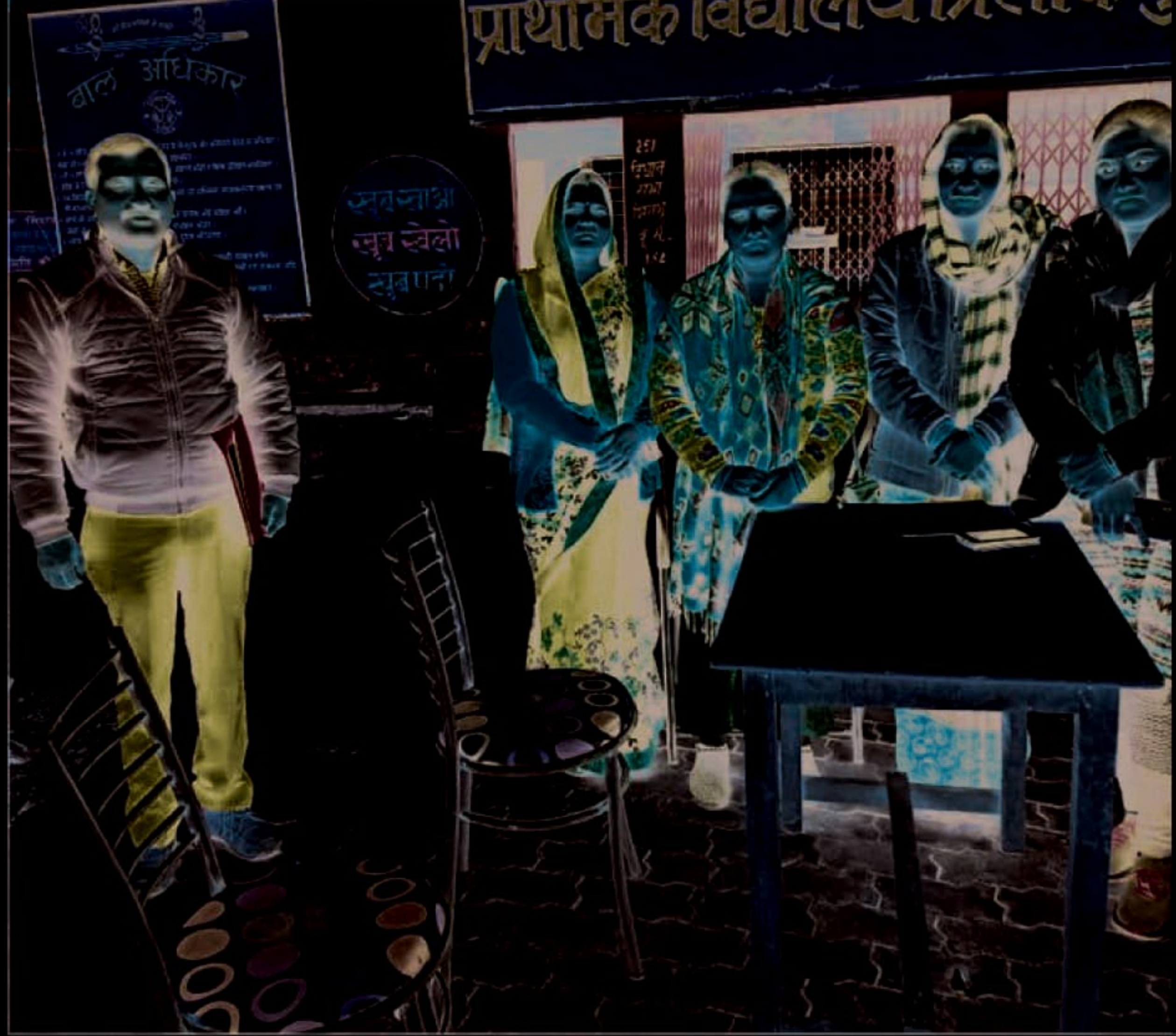
छात्रों के नामांकन को लेकर संपर्क करते विद्यालय के प्रधानाचार्य