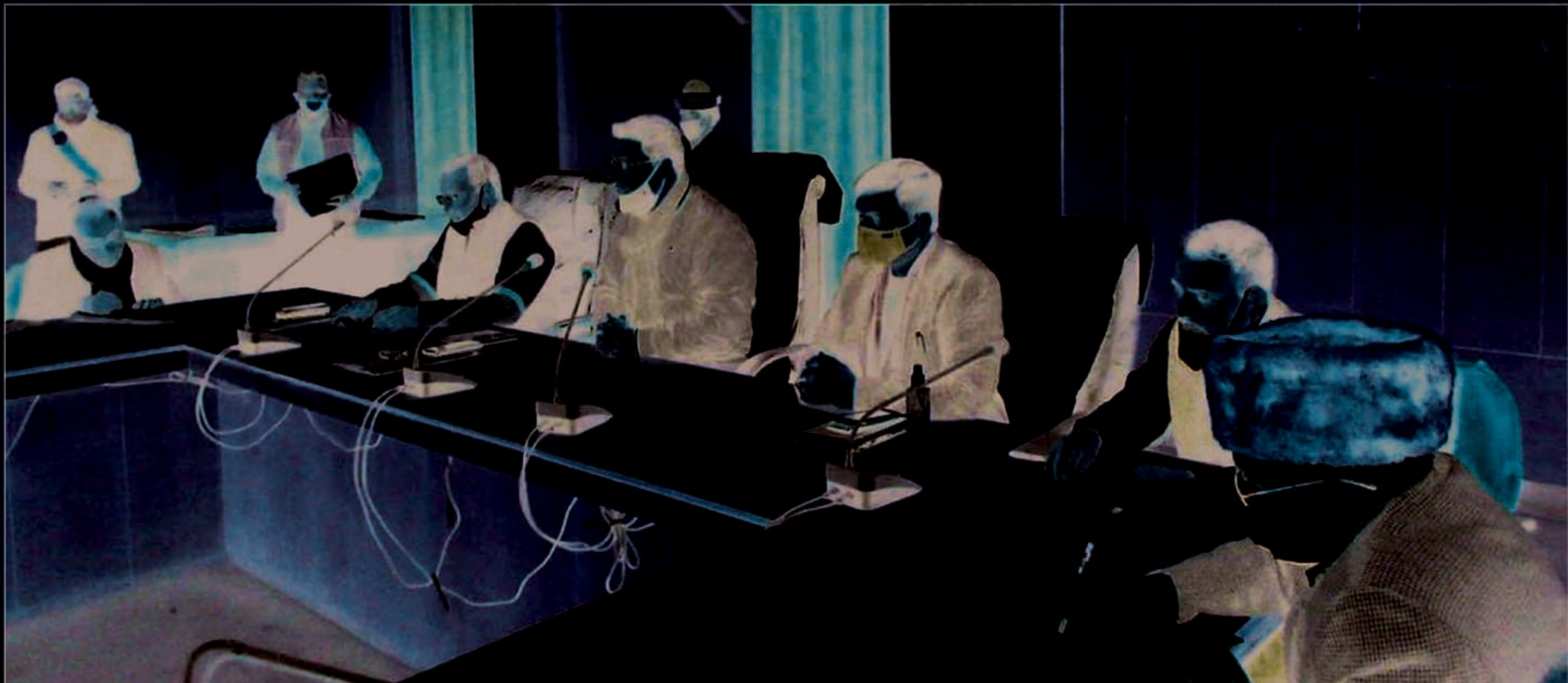
कलेक्ट्रेट के सभागार में प्रेस प्रतिनिधियों के साथ बैठककरते जिलाधिकारी व अन्य अधिकारी

कार्यवाही की जायेगी। राजस्व निरीक्षकों द्वारा परिपत्रादेश संख्या-