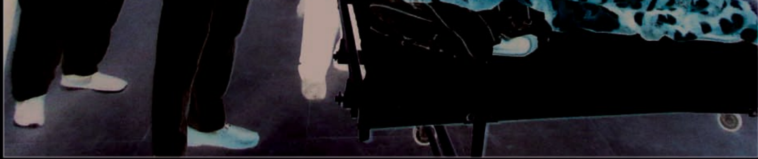
जिला अस्पताल के मरीज का हाल चाल लेते जिलाधिकारी

कौशाम्बी। जिलाधिकारी अमित कुमार सिंह ने बुधवार को जिला अस्पताल का औचक निरीक्षण किया। निरीक्षण में जिलााधिकारी ने एक्सर रूम, सिटी स्कैन कक्ष, इमरजेन्सी कक्ष, महिला वाई ओपीडी कक्ष सहित चिकित्सालय के विभिन्न वाडों एवं कक्षों का भ्रमण कर व्यवस्थाओं का जायजा लिया। ओपीडी कक्षों सहित चिकित्सालय के विभिन्न वाडों एवं कक्षों का भ्रमण कर व्यवस्थाओं का