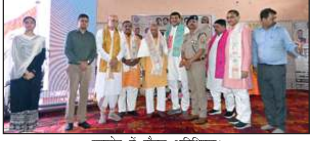
समारोह में मौजूद अतिथिगण।

शुक्रवार को मुख्य अतिथियों/अधिकारियों ने नागरिकों व स्कूली बच्चों के साथ काकोरी के सीधा प्रसारण देखा। समारोह में