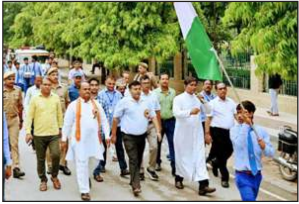
प्रभात फेरी में शामिल सदर विधायक व जिलाधिकारी।

काकोरी ट्रेन एक्शन शताब्दी महोत्सव पर हुआ वृक्षारोपण, निकाली गयी प्रभात फेरी