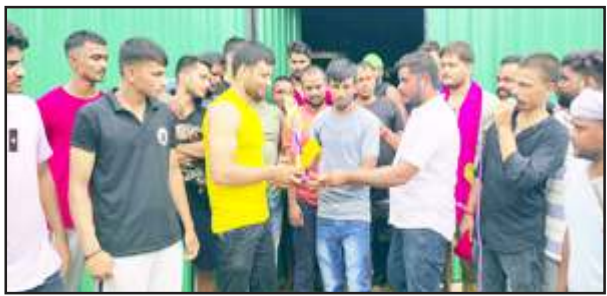
विजेता को ट्राफी देते आयोजकगण।