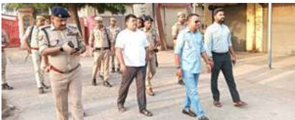
स्ट्रांग रूम का निरीक्षण करते डीएम, एसपी।

इसवेले उपरान्त उन्होंने मतगणना को लेकर की जा रही तैयारियों का जायजा लिया एवं समस्त तैयारियों समय सुनिश्चित करने के निर्देश सम्बन्धित अधिकारियों को दिये। बताते चले