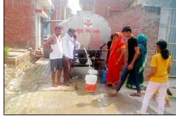
अचलपुर वार्ड में टैंकर से पानी की सप्लाई करते नगर पालिका कर्मों।