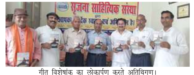
गीत विशेषांक का लोकार्पण करते अतिथिगण।