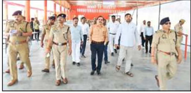
मतगणना की व्यवस्था देखते कमिश्नर व डीआईजी।

रविवार को चित्रकूटधाम मंडल बांदा आयुक्त व डीआईजी ने डीएम-एसपी के साथ 236 चित्रकूट विधानसभा व 237 मानिकपुर