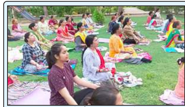
शिविर में योग सीखती महिलायें।

आम जनता को जिस दल की सरकार बनाना होगा, वह जनता पहले ही मन बनाकर मताधिकार का प्रयोग कर चुकी है। परिणाम चार जून को मिलेंगे। जिले में राष्ट्रीय दलों समेत क्षेत्रीय दलों के नेताओं ने जनता को गुमराह कर विकास के नाम पर दशकों तक लूटा है। विकास कार्य सिर्फ कागजों में दिख रहे थे, आज विकास के साथ खुद को सुरक्षित महसूस कर रहा है। आम जनता का रुख साफ है कि चार जून को जीत का सेहरा किसके लिए पर बंधता है। कौन प्रत्याशी अपनी हार का ठीकरा चुनाव आयोग की कार्यशैली व ईवीएम पर फोड़ता है।