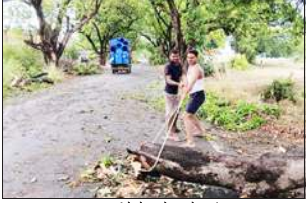
सड़क पर गिरे पेड़ को हटाने ग्रामीण।

प्रतापगढ़। बीती रात शहर में तेज आंधी पानी के साथ आसपास क्षेत्र के पेड़-पौधे और विद्युत पोल धराशायी हो गये जिससे भोर में तीन बजे से शहर की विद्युत आपूर्ति ठप हो गई जो 15 घंटे बाद शाम छह बजे तक बहाल नहीं हो सकी थी। इससे पूरे शहर में बिजली पानी के लिये हाहाकार मच गया। 15 घंटे से अधिक विद्युत आपूर्ति ठप रहने से घरों के इनवर्टर फेल हो गये। हालत इतनी बदतर हो गई कि लोग मोबाइल चार्ज करने के