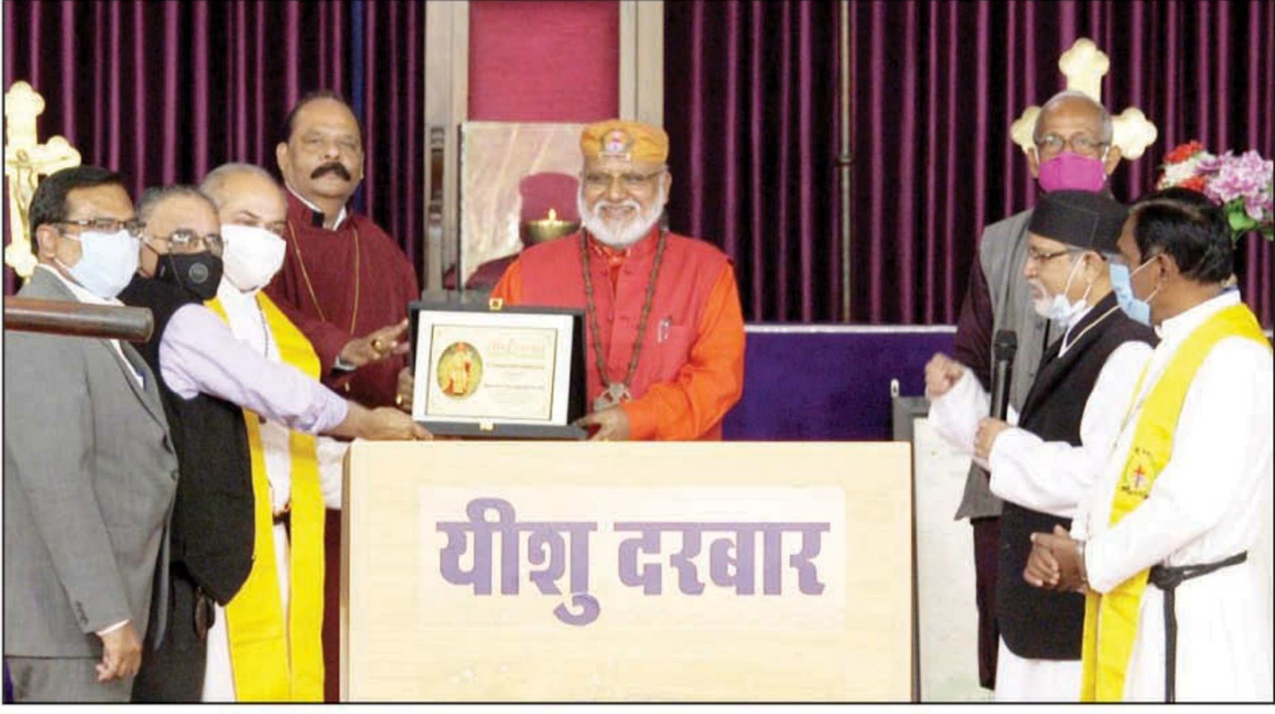
यीशु दरबार बिशप के पदग्रहण की आठवीं वर्षगांठ मनाते हुए