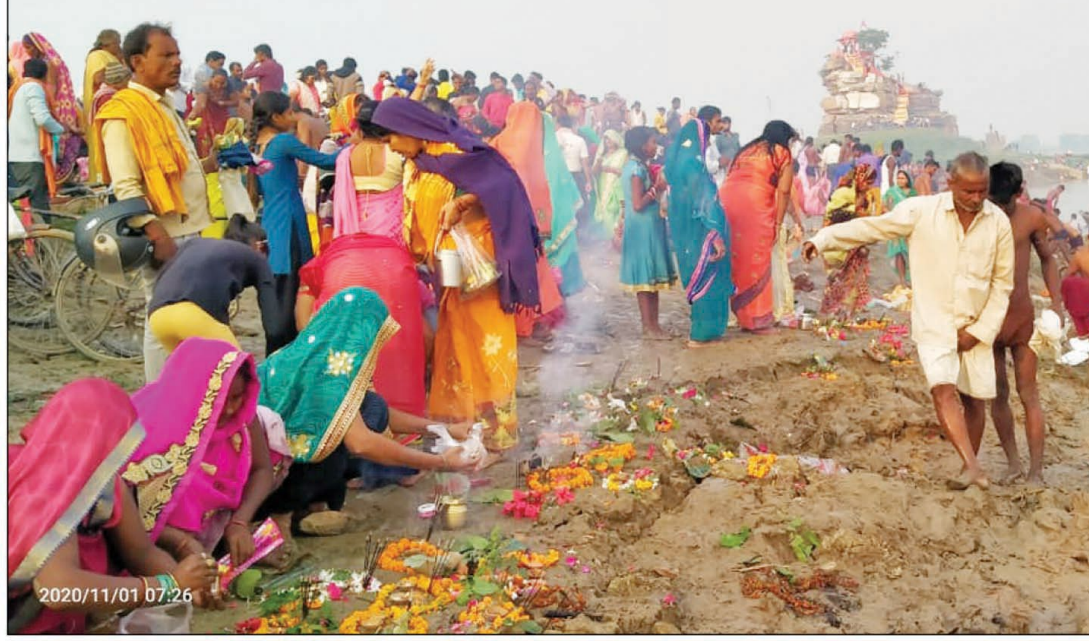
सुजावन देव यमुना घाट पर स्नान के बाद पूजा अर्चना करते श्रद्धालु

धूरपुर। कार्तिक के दूसरे रविवार को धूरपुर के सुजावन देव यमुना घाट पर के श्रद्धालुओं का जन सैलाब उमड़ा यमुना में पुन्य की डुबकी लगा पूजा अर्चना दीपदान कर सुजावन देव मंदिर स्थित भगवान शिव की दर्शन कर दान दक्षिणा कर मोक्ष की कामना की व्थाट पर दूसरे रविवार को भी अव्यवस्थाओं का बोलबाला रहा। कार्तिक मास में यमुना स्नान का विशेष महत्त्व है। कार्तिक मास के द्वितीय रविवार के दिन स्थानीय क्षेत्र सहित बारा, करछना तहसील के अंतर्गत हजारों श्रद्धालु यमुना स्नान के लिए भीर चार बजे से ही ऐतिहासिक धार्मिक आस्था के केंद्र सुजावन देव यमुना घाट पर श्रद्धा का सैलाब उमड़ने लगा जो दोपहर तक चलता रहा। हजारों श्रद्धालुओं ने यमुना में पुन्य की डुबकी लगा पूजा अर्चना दीपदान कर सुजावन देव