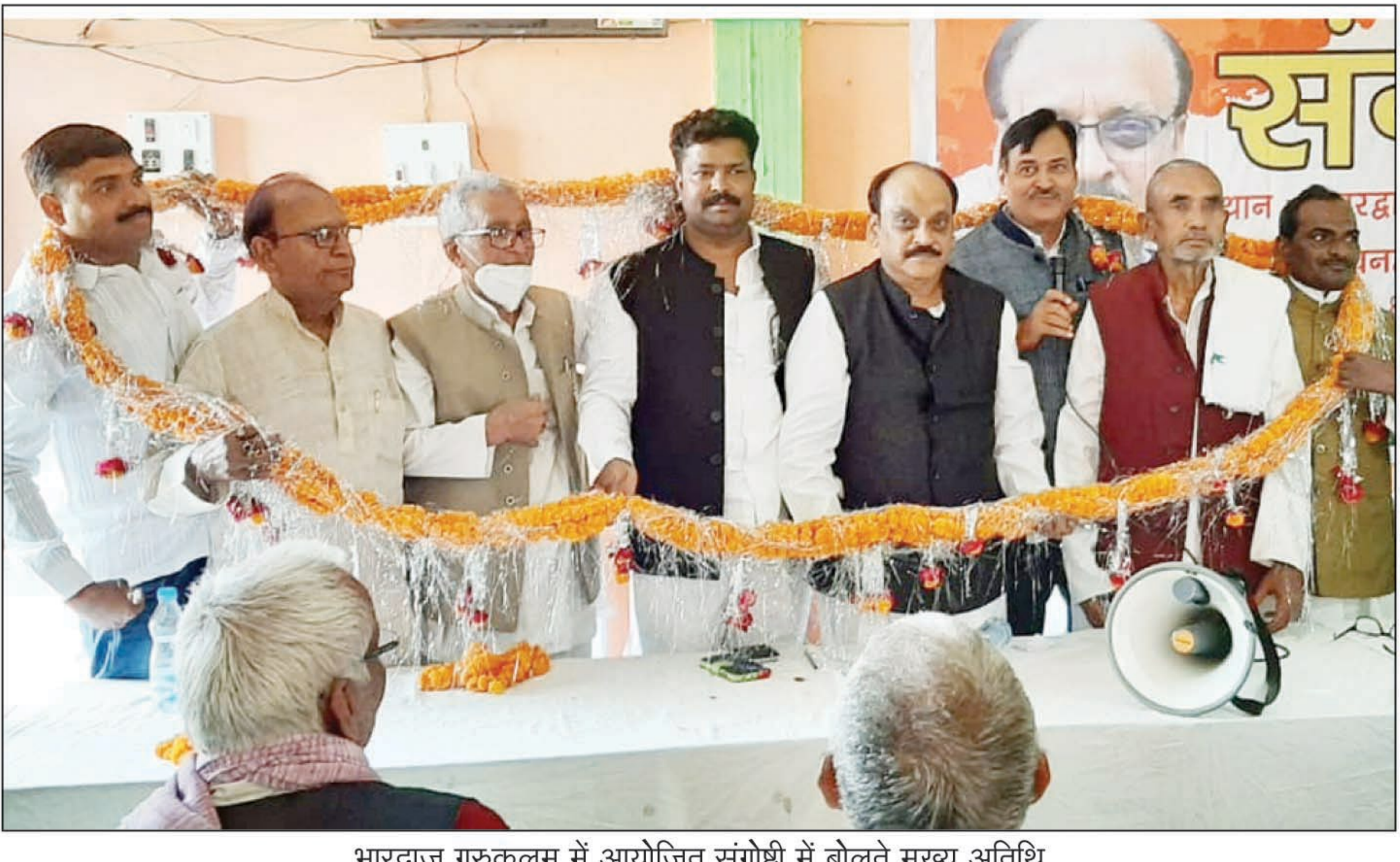
भारद्वाज गुरुकुलम में आयोजित संगोष्ठी में बोलते मुख्य अतिथि