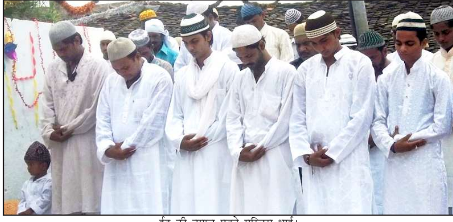
ईद की नमाज पढ़ते मुस्लिम भाई।

गुरुवार को सबेरे शहर के ईदगाह मैदान में मुल्क की सलामती की दुआ मांगी गई। सभी ने रमजान माह को विदा कर सन्तानों पर चलने का संकल्प लिया। सबेरे से नये कपड़े पहनकर मुस्लिम भाईयों ने उत्साह