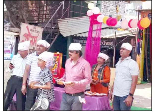
प्रसाद बांटते सिंधी समाज के लोग।

शाम को पुरानी बाजार डाक घर के सामने से शोभायात्रा निकली। शोभायात्रा मन्दाकिनी नदी में जाकर समाप्त हुई। इसमें समाज के युवक