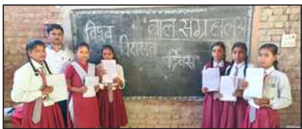
बाल संग्रहालय में मौजूद विद्यालय की छात्राएं।