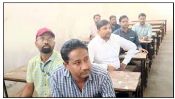
बैठकर प्रशिक्षण देखते डीएम।

गुरवार को जिलाधिकारी ने प्रशिक्षण कक्ष में बैठकर मतदान बाबत मास्टर ट्रेनर्स के दिये प्रशिक्षण को बारीकी से समझा। उन्होंने निरीक्षण करते हुए मास्टर ट्रेनर्स से कहा कि मतदान कर्मियों