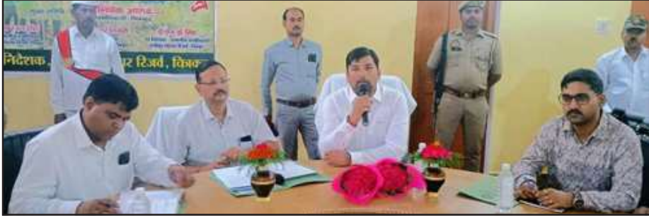
वनकर्मियों को फोन व किट बांटते डीएम आदि।

रानीपुर टाइगर रिजर्व के कर्मचारियों को फोन व पेट्रोलिंग किट गुरवार को जिलाधिकारी ने मयूर वन सभागार में बांटी। उन्होंने वन कर्मियों से कहा कि रानीपुर टाइगर रिजर्व वन गया है। पहले ये वन्य जीव विहार के नाम से जाना जाता था। केन-बेतवा लिंक का कार्य शुरू हो गया है। मानिकपुर