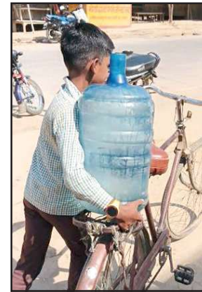
साइकिल से पानी का डिब्बा लेकर जाता बच्चा।