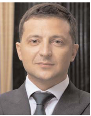
बीते दिनों पोलेंड बॉर्डर के पास स्थित बेलारूस में दूसरे दौर की वार्ता हुई थी। इस वार्ता को लेकर राष्ट्रपति व्लादिमीर पुतिन के

जल्द होगी तीसरे दौर की वार्ता-यूक्रेन और रूस के बीच जल्द ही तीसरे दौर की वार्ता होगी।