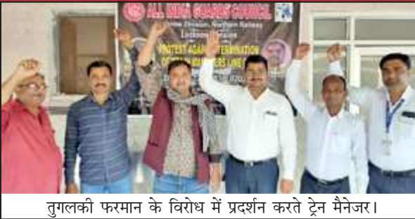
तुगलकी फरमान के विरोध में प्रदर्शन करते ट्रेन मैनजर।

के साथ टिन(लोहा) का एक बड़ा सा बक्सा होता है। इसको रेल भी भाषा में लाइन बॉक्स कहते हैं। इसमें गाई ट्रेनों के संचालन में काम आने वाली सेपटी सी जुड़ी चीजे जैसे झंडी, लाइट, लोहे के बोर्ड के साथ