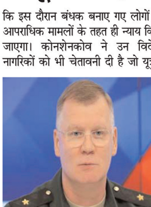
कि इस दौरान बंधक बनाए गए लोगों पर आपराधिक मामलों के तहत ही न्याय किया जाएगा। कोनशेनकोव ने उन विदेशी नागरिकों को भी चेतावनी दी है जो यूक्रेन

उन्होंने सीधे तौर पर इस बयान में पश्चिमी देशों की सेनाओं पर निशाना साधा है। अपने बयान में उन्होंने साफ कर दिया है