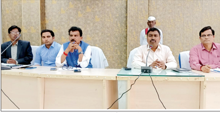
मतगणना के संबंध में बैठक करते डीएम

मंझनपुर तहसील क्षेत्र के विभिन्न ग्राम सभाओं में सरकारी जमीन को कब्जा कराने की आड़ में व्यवसाय बना कर लाखों की रकम वसूलने वाला भ्रष्ट लेखपाल ने मंझनपुर तहसील क्षेत्र के खुर्मापुर बजह और रसूलपुर सोनी सहित कई गांव में तैनाती के दौरान सरकारी जमीनों में कब्जा कराने के मामले में बदनाम हो चुका है आला अधिकारियों को भी लेखपाल बराबर झूठी सूचना देकर अपना बचाव करने का प्रयास कर रहा है यदि खुर्मापुर बजह गांव की बात करें तो