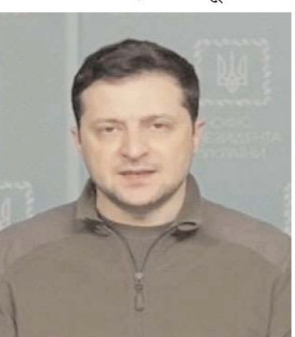
राष्ट्रपति वोलोदिमीर जेलेंस्की ने दावा किया है कि रूसी सेना ने परमाणु प्लांट पर हमला किया है। जेलेंस्की ने ट्वीट कर कहा कि यूरोप का सबसे बड़ा परमाणु प्लांट खतरे में है। इससे पहले यूक्रेन के विदेश मंत्री दिमित्री कुलेबा ने कहा था कि रूस परमाणु प्लांट पर लगातार गोलीबारी कर रहे हैं।

बड़े परमाणु प्लांट के रिपेक्टों में आग लग गई है। यूक्रेन के