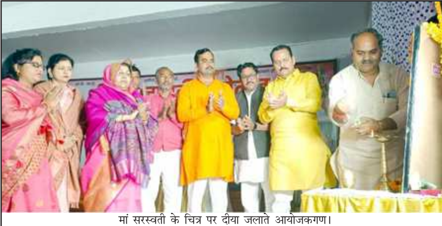
मां सरस्वती के चित्र पर दीया जलाते आयोजकगण।