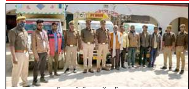
पुलिस की गिरफ्त में अभियुक्तगण।

बाजार प्रयागराज ले जा रहे थे, वहां पर हम लोगों के व्यापारी फिक्स रहते हैं वे इन्हे बिहार होते हुए बंगाल ले जाते हैं। इस संबंध में थाना लालगंज पर मु0अ0स0 77/