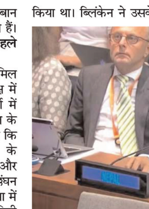
टिवट में बताया था कि उन्होंने देउबा से यूक्रेन पर हमले की चर्चा की और इस