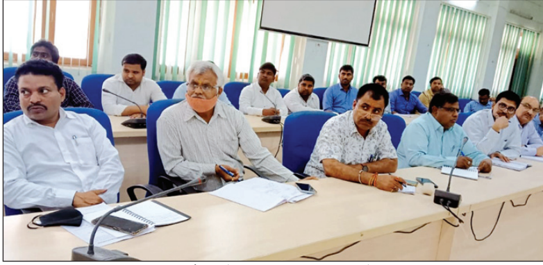
मतगणना की बैठक में उपस्थित विभिन्न विभाग के अधिकारी