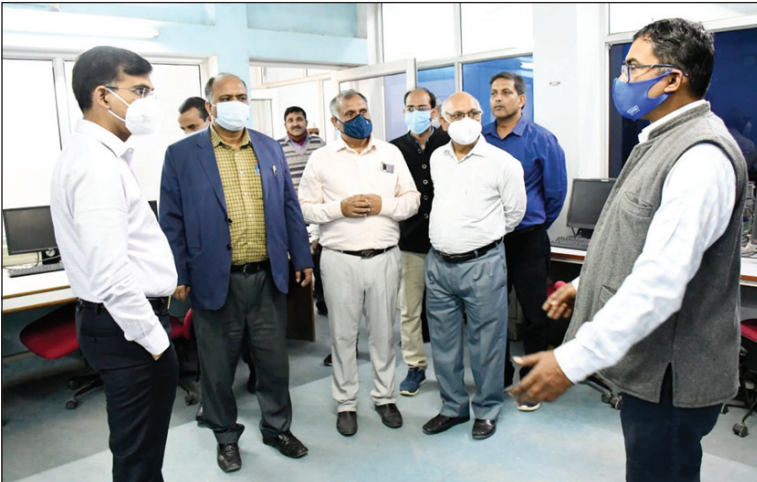
आईआईआरटी के अध्यक्ष के साथ मण्डलायुक्त संस्थान में जानकारी लेते