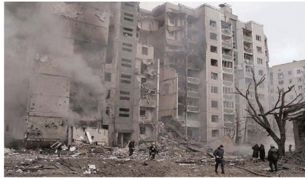
'फर्जी' जानकारी फैलाने पर यूक्रेन के साथ युद्ध के बीच रूसी संसद के निचले सदन ने