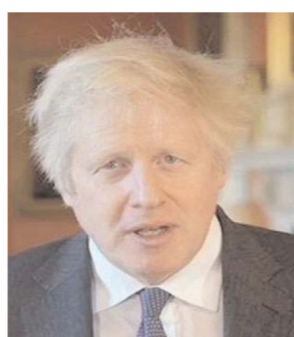
जानसन ने न्यूक्लियर प्लांट की घटना पर चिंता जाहिर की है। जानसन ने जेलेंस्की से कहा कि रूस के राष्ट्रपति व्लादिमीर पुतिन की लापरवाह कार्रवाई अब सीधे तौर पर यूरोप की सुरक्षा के लिए खतरा हो सकती है।

बड़े परमाणु प्लांट के रिपेक्टों में आग लग गई है। यूक्रेन के