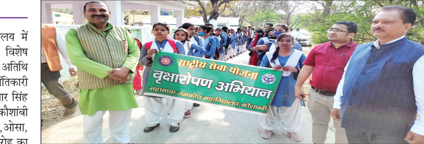
पर्यावरण रैली निकालती स्कूली छात्राएं और शिक्षक