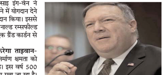
महाने का वेतन दान करने की घोषणा की है। दरअसल यूक्रेन पर रूसी हमले के बाद ताइवान को लग रहा है कि चीन भी उसके खिलाफ रूस जैसा कदम उठा सकता है। गौरतलब है कि चीन ताइवान को अपना हिस्सा बताता है।

यूक्रेन को मानवीय मदद करेगा ताइवान ताइवान की राष्ट्रपति साई इंग-वेन, उप राष्ट्रपति विलियम लाई व प्रधानमंत्री सु सेंग-चांग समेत कई दिग्गजों ने यूक्रेन में राहत कार्यों के लिए एक-एक