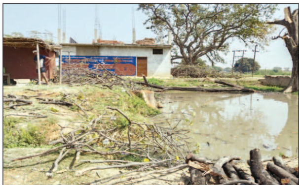
अवैध लकड़ी कटान

कौशाम्बी। पिपरी थाना क्षेत्र के मंडवारा गांव में लकड़ी माफियाओं ने आधा दर्जन से अधिक हरा फलदार महुआ का पेड़ काटकर धराशाही कर दिया है। लकड़ी माफिया हरे पेड़ों को काटकर आरा मशीन पर पहुंचाकर उसके बदले मोटी रकम अर्जित कर रहे हैं। जिम्मेदार अधिकारी कोई कार्यवाही करे उसके पहले ही जिम्मेदार अधिकारियों तक लकड़ी माफियाओं के द्वारा मोटी रकम की गड्डी पहुंचा दी जाती है जिससे शिकायत के ब्यवजूद लकड़ी माफियाओं के विरुद्ध जिम्मेदार अधिकारी शिकंजा नहीं कसते हैं जिसके चलते लकड़ी माफिया बेखौफ तरीके से हरियाली को सफाफट करने में लगे हुए हैं और अधिकारियों की मिलीभगत से अपने काम को अंजाम देने में सफल हो रहे हैं। लगातार दो दिनों से मंडवारा गांव में बेखौफ लकड़ी माफिया हरे पेड़ों पर इलेक्ट्रॉनिक मशीन एवं कुल्हाड़ी चलाकर हरे पेड़ों की धराशाही करने के बाद अवैध तरीके से संचालित हो रही क्षेत्रीय आरा मशीन पर