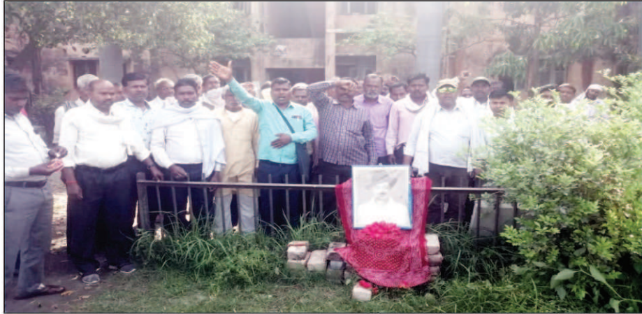
शहीद भगत सिंह को श्रद्धांजलि अर्पित करते इफको ठेका मजदूर संघ के कार्यकर्ता

शहीद भगतसिंह के शहादत दिवस पर लिया गया उनके सपनों का भारत बनाने का संकल्प