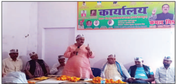
पंचायत परिवार के एमएलसी प्रत्यासी का कोरांव में चुनाव कार्यालय का उद्घाटन समारोह