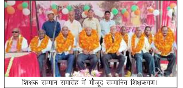
शिक्षक सम्मान समारोह में मौजूद सम्मानित शिक्षकगण।

उन्होंने कहा कि वे स्वयं भी इस विद्यालय के छात्र रहे हैं। उन्होंने शिक्षकों का आह्वान किया कि वे विद्यार्थियों में विषयगत ज्ञान के साथ