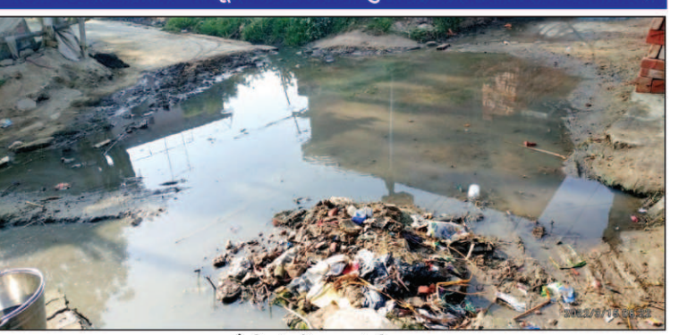
चलौली गांव में व्याप्त गंदगी का दृश्य

विभागीय उपेक्षा से मजबूर गांव के लोग खुद कर रहे हैं नालियों की सफाई