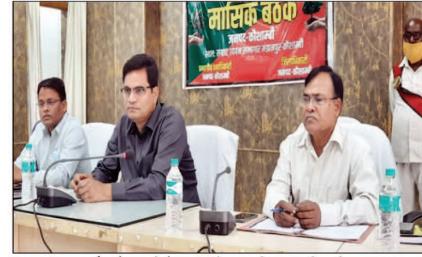
पौधारोपण की बैठक करते मुख्य विकास अधिकारी