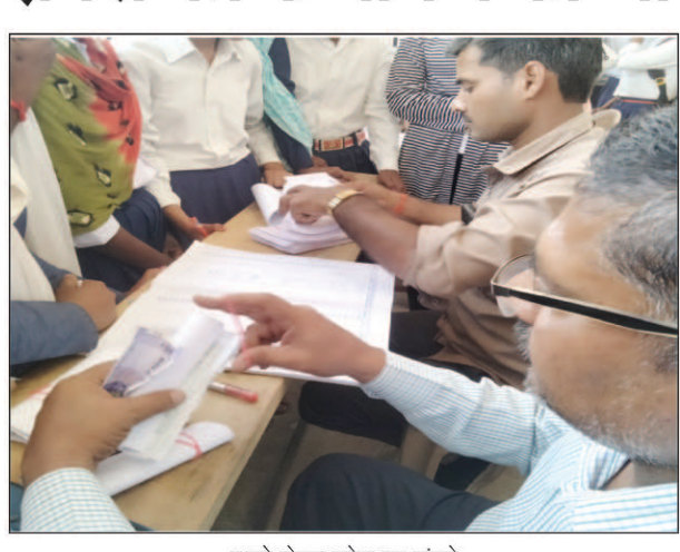
रुपये लेकर प्रवेश पत्र बांटते

अखंड भारत संदेश लेडियारी। कोरांव तहसील अन्तर्गत शिव जियावन इन्टर कालेज में हाईस्कूल एवं इन्टर के बच्चों एवं बच्चियों से मनमाने तौरके एवं जबर्न वसूली की जा रही है 100 रुपये के दर मैनेजमेंट एवं