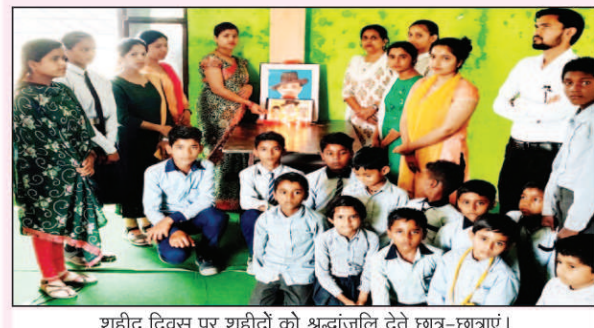
शहीद दिवस पर शहीदों को श्रद्धांजलि देते छात्र-छात्राएं।