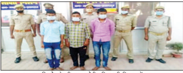
किशोर के तीन हत्यारोपी पुलिस की गिरफ्त में