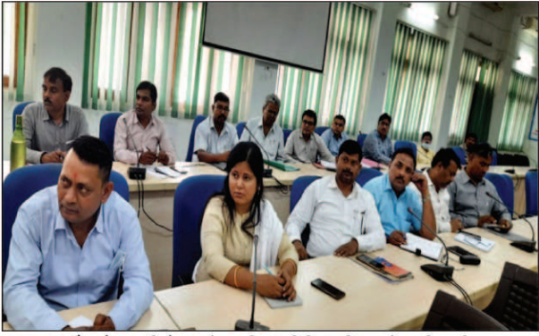
पौधारोपण की बैठक में उपस्थित विभिन्न विभाग के अधिकारी