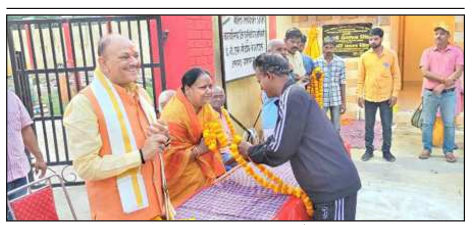
नगर पालिकाध्यक्षा का स्वागत करते रामराम चौराहे के लोग।