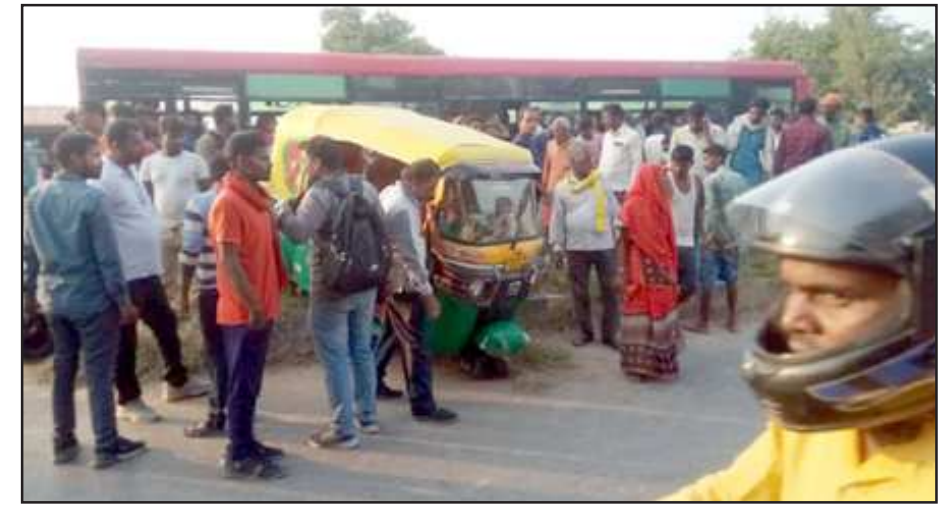
अनियंत्रित पल्टी अप्पे सवारी वाहन को देखते राहगीर व ग्रामीण।