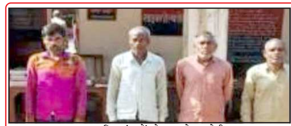
शान्ति भंग में जेल जाते आरोपी।