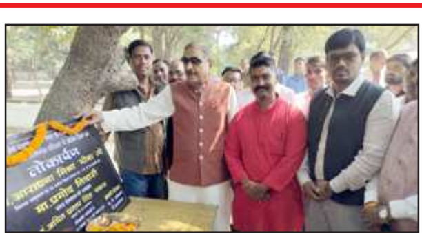
ग्रामीण विकास योजना का लोकार्पण करते सांसद प्रमोद तिवारी।

समारोह को संबोधित करते हुए बतौर मुख्य अतिथि राज्यसभा सदस्य प्रमोद तिवारी ने कहा कि ब्लाक द्वारा जनकल्याणकारी योजनाओं के साथ जिस तरह से ग्रामीण विकास से जुड़ी योजनाओं में तेजी आ रही है उससे लालगंज ब्लाक भी जिले का आदर्श ब्लाक का दर्जा हासिल कर सकेगा।