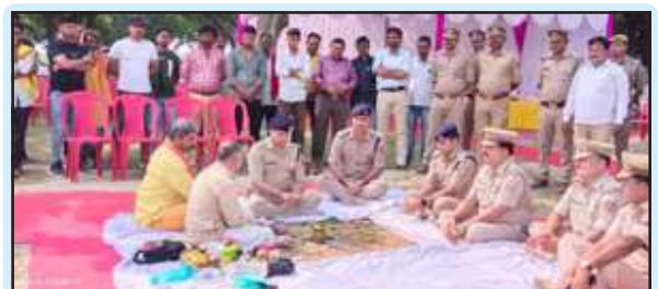
पुलिस चौकी भूमि का पूजन करते एसपी साथ में मौजूद अन्य पुलिस अधिकारी

से किसी भी प्रकार की हानि दुर्घटना हो सकती है सीडीओ ने निरीक्षण के दौरान पाया कि करार जा रहे कार्यों में कुछ जगह पर खराब सामग्री का प्रयोग किया जा रहा है जिस पर संबंधित ठेकेदार और विभागीय अधिकारियों को सीडीओ ने कड़ी चेतावनी देते हुए गुणवत्ता में सुधार लाने का निर्देश दिया है उन्होंने कहा कि डॉ0पी0आर0 के अनुसार प्राविधानित सामग्री प्रयोग किया जाय। अन्यथा इस सम्बन्ध में कठोर कार्यवाही की जायेगी। कार्य की प्रगति धीमी पाए जाने पर सीडीओ ने कहा कि यह नितान्त खेद का विषय है।