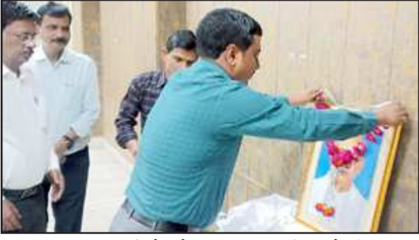
सरदार वल्लभ भाई पटेल के चित्र पर माल्यार्पण करते डीएम।

डीएम ने कलेक्ट्रेट के अधिकारियों कर्मचारियों को राष्ट्रीय एकता की दिलाई शपथ