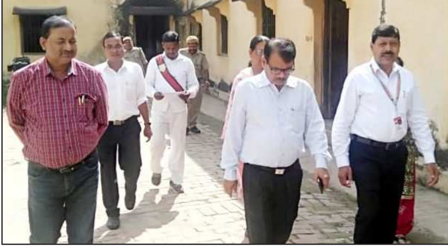
परीक्षा केन्द्रों का निरीक्षण करते अधिकारी।

प्रथम पाली की परीक्षा दस से बारह बजे तक थी। प्रातः आठ बजे से ही परीक्षार्थी परीक्षा केन्द्र पर पहुंचने लगे थे। परीक्षा केन्द्रों में