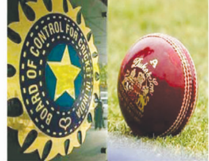
एजीएम से पहले प्रदेश ईकाइयों को भेजी गई रिपोर्ट में कहा गया- आईसीसी का अगला बड़ा टूर्नामेंट आईसीसी विश्व कप 2023 में अक्टूबर नवंबर में भारत में होना है। बीसीसीआई को अप्रैल 2022 तक आईसीसी