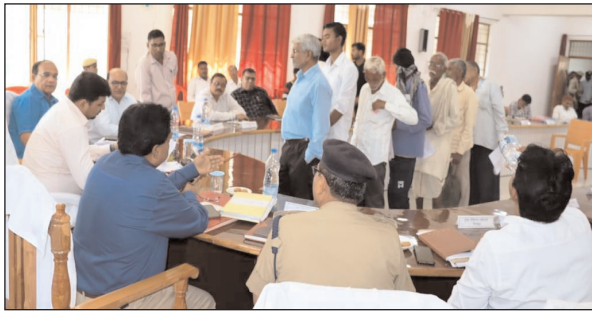
का निस्तारण गुणवत्तापूर्ण ढंग से न होने से तहसील, थाना, ब्लाक स्तर व जिला मुख्यालय में पीड़ित प्रार्थना पत्र लेकर आते हैं। गुणवत्तापूर्ण निस्तारण होने पर लोग नहीं आयेगी।