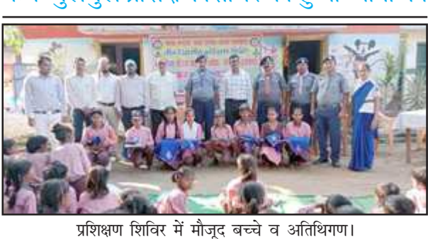
प्रशिक्षण शिविर में मौजूद बच्चे व अतिथिगण।