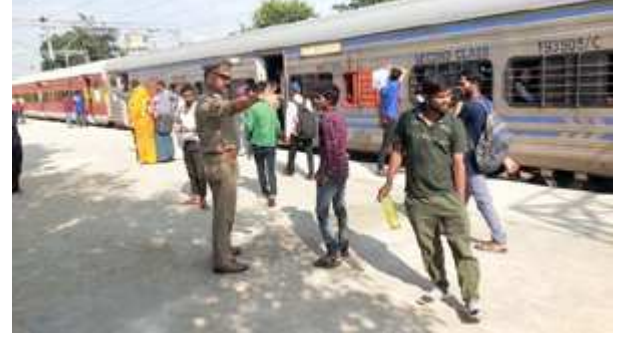
रेलवे स्टेशन पर निगरानी करते पुलिस के जवान।

पैक नजर आई काशी विश्वनाथ, पदमावत और अर्चना एक्सप्रेस में नहीं थी जगह