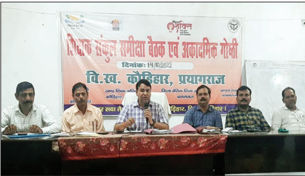
कौड़िहार बीआरसी में शिक्षक संकुल की बैठक को संबोधित करते

कौड़िहार ब्लाक के शिक्षक संकुलों की मासिक बैठक में डीजी के यूट्यूब सत्र पर की गई चर्चा, शिक्षक संकुलों के सत्र विभाजन एवं पंचसूत्र पर की गई बात, शिक्षक संकुलों की बैठक को सभी एआरपी ने किया संबोधित