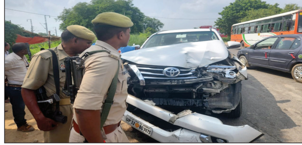
अखंड भारत संदेश

साथ में चल रही स्काट गाड़ी के सामने वाइक सवार को बचाने में अचानक ब्रेक लगाने से काफीले की गाड़ियां आपस में भीड़ गयी