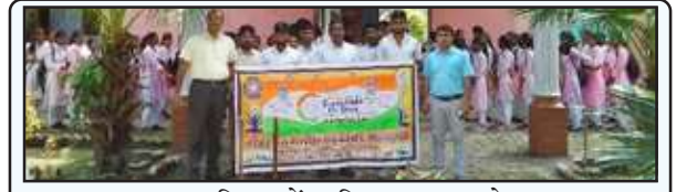
स्वच्छता अभियान में शामिल एनएसएस के छात्रगण।