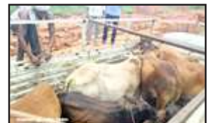
नगर पालिका द्वारा पकड़े गये छुट्टा पशु।

प्रतापगढ़। भद्र पूर्णिमा पर भारत की महान विद्या विपरशयना ध्यान साधना को पूरे विश्व में स्थापित करने वाले पूज्य गुरु सत्य नारायण गोयनका की 10वीं पावन स्मृति में जनपद में सुगतानन्द बुद्ध विहार पर आचार्यों, साधकों के सानिध्य में सामूहिक ध्यान साधना व दीपदान का आयोजन गुरुवार की शाम 5 बजे से आयोजित किया गया है।