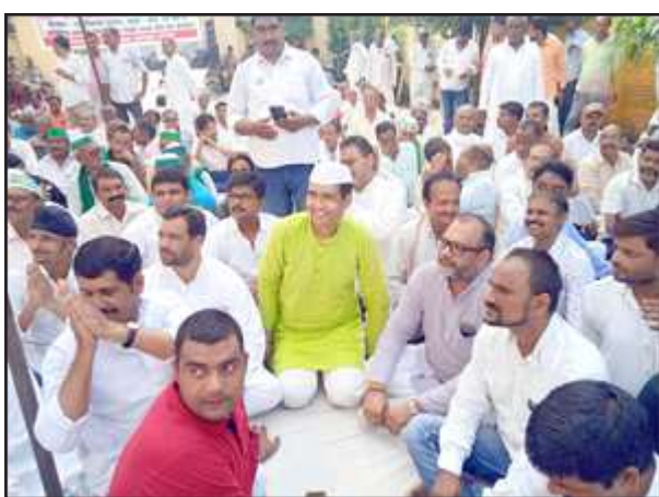
अमेठी के सीएमओ कार्यालय पर धरना देते बेल्ला के कांग्रेसी।