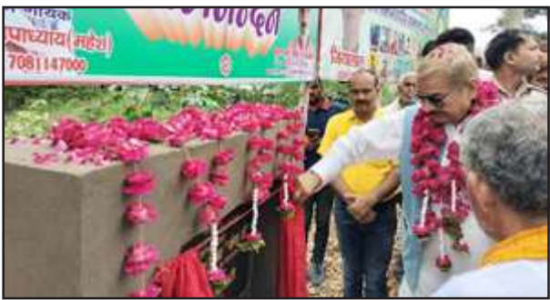
सड़क परियोजना का शिलान्यास करते सांसद प्रमोद तिवारी।

लालगंज, प्रतापगढ़। राज्य सभा में विपक्ष के उपनेता, स्टीयरिंग कमेटी के सदस्य प्रमोद तिवारी ने मोदी सरकार पर संसदीय परम्पराओं तथा संविधान में लोकतंत्र की आत्मा को लगातार चोट पहुंचाने को लेकर कड़ा हमला बोला है। शनिवार को रामपुर खास के एक दिवसीय दौरे पर पहुंचे राज्यसभा सदस्य प्रमोद तिवारी ने लालगंज में मीडिया से रूबरू होते कहा कि संसद सत्र के दौरान प्रधानमंत्री मोदी तथा उनके मंत्री राष्ट्रीय मसलों पर जबाबदेही से बच रहे हैं। वहीं उन्होंने नौती के कैथन