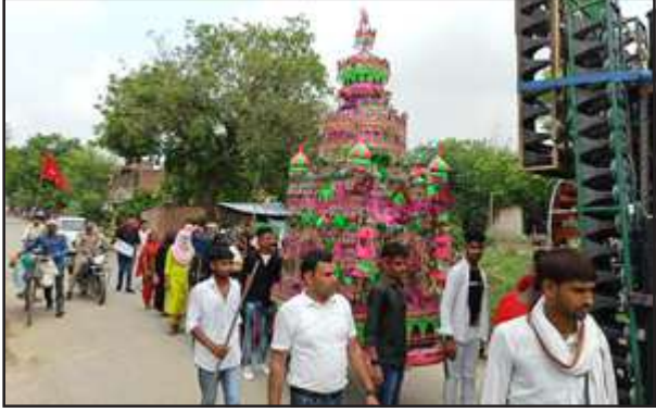
नगर में ताजिया निकालते अकीदतमद।

मोहर्रम की दसवीं पर जुलूस निकालने व करतब दिखाने के लिये सभी अखाड़ों ने अपनी-अपनी झांकियां निकालीं। मक्के और मदीनों तथा दुलदुल घोड़े की झांकी को भी पूरे मनोयोग से सजाया गया था। अखाड़ों में करतब दिखाने वाले युवाओं ने लाठी, भाला, तलवार व