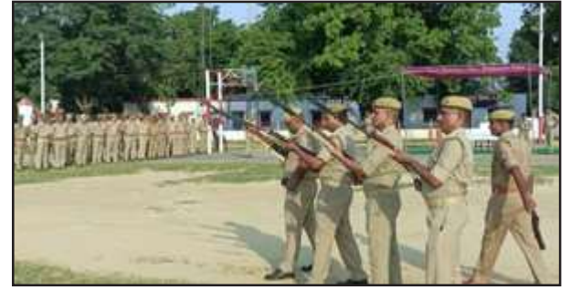
बलवा टेजडिंग के दौरान फायरिंग करते पुलिस कर्मी।

युवकों द्वारा जांबाजी के करतब का भी प्रदर्शन किया गया। खासकर युवाओं में लाठी, भाला, तलवार और चाकू के प्रदर्शन करने को लेकर खासा उत्साह दिखा। सुरक्षा व्यवस्था के लिये पुलिस प्रशासन द्वारा पूरी तरह से सुरक्षा व्यवस्था चेकस रही।