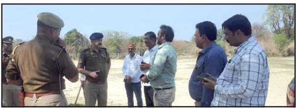
भूमि का निरीक्षण करते कार्यवाही संस्था के अधिकारी।

बता दें कि जिले को उत्तर प्रदेश सरकार द्वारा एक जनपद, एक उत्पाद की योजना के तहत आंवला के उत्पादक जनपदों की श्रेणी में रखा गया है। प्रतापगढ़ के छह विकास खंडों को आंवला फलपट्टी के रूप में लगभग तीन दशक पहले ही घोषित किए जाने के बावजूद भी आंवला किसानों को विशेष सुविधाएं न मिलने के कारण उनको उनके उत्पादन का समुचित लाभ नहीं मिल पा रहा था। इन्हीं