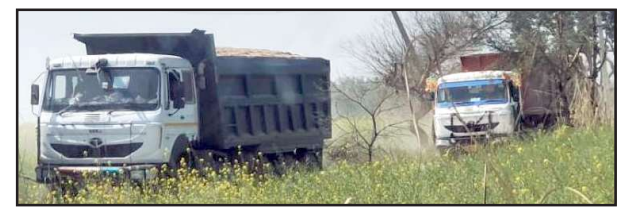
अवैध मौरंग भरे ट्रक।