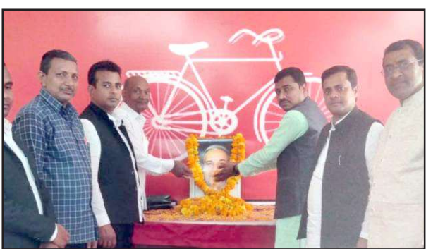
कांशीराम के चित्र पर माल्यार्पण करते पदाधिकारी।