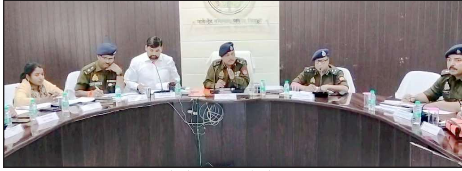
पुलिस ने लोस चुनाव कराने को कसी कम्पन।