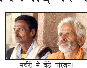
मर्ची में बैठे परिजन।