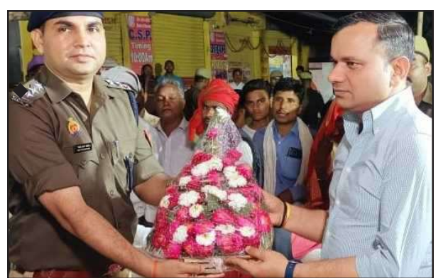
पुलिस अधीक्षक को सम्मानित करते पुलिस कर्मी।

लेकर स्थापित किए जाने वाले वाला पैक हाउस के संबंध में कार्यवाही संस्था के अधिकारियों तथा राजस्व की टीम को निर्देशित कर गोडे गांव में शुरूवार को वाला पैक हाउस का निर्माण कार्य आरंभ कराये जाने के निर्देश दिए गए। जिला अधिकारी के निर्देश के क्रम में अधिकारियों द्वारा स्थल पर लेआउट तैयार कर शुरूवार को ही निर्माण कार्य का शुभारंभ कर दिया गया। इस संबंध में कार्यवाही संस्था के अभियंता द्वारा बताया गया कि मात्र लगभग 3 महीने के अल्पकाल में ही आंवला पैक हाउस को मूर्त रूप देने की कार्य योजना तैयार की गई है, जिसे युद्ध स्तर पर प्रत्येक दशा में पूर्ण कर किसानों को तथा समूह की महिलाओं को आंवला से संबंधित परियोजनाओं के संचालन हेतु समर्पित कर दिया जाएगा।