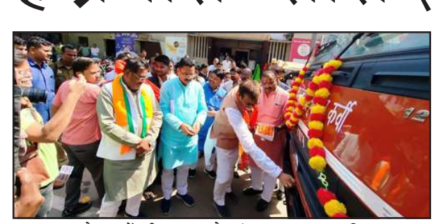
नये वाहनों की पूजा करते सांसद व अध्यक्ष आदि।