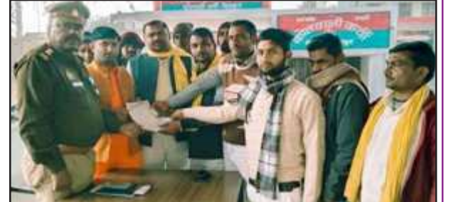
कर्वा कोतवाल को तहरीर देते यादव समाज के लोग।