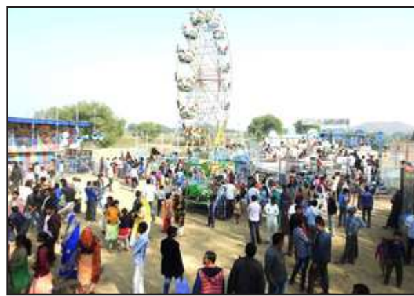
भरतकूप मेले का लुफ लेते श्रद्धालु।

सोमवार को शीतलहर के बीच मकरसंक्रान्ति पर्व पर मन्दाकिनी में डुबकी लगाने लाखों श्रद्धालु पहुंचे।