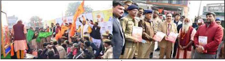
यात्रा का स्वागत करते व मौजूद अधिकारीगण।