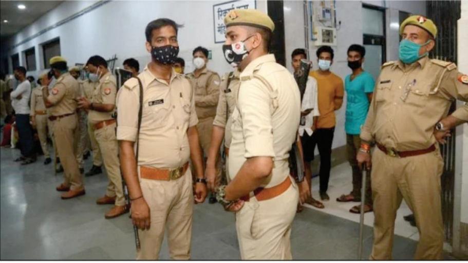
एसआरएन हास्पिटल में हंगामे के दौरान भारी संख्या में तैनात पुलिस बल

अनके पात्रों में जल एकत्रित था, उसमें अधिक मात्रा में लावा पाए गए। वहां पानी की निकासी बेहतर न होने से जल जमाव की स्थिति बनी हुई है। इसमें भी लावा पाए गए। इस पर वहां एटी लावा का छिड़काव कराया गया। इस्माइलगंज की स्थिति को देखते हुए डीएम ने मंगलवार को सीडीओ को स्थलीय निरीक्षण के निर्देश दिए हैं। इसके साथ सामुदायिक स्वास्थ्य केंद्र सोरांव और मलेरिया विभाग की ओर से संयुक्त रूप से अभियान चलाने को कहा है। इसके अलावा जागरूकता के लिए हैंड बिल भी बांटे गए। इधर, शहर में सोमवार को शहर के कसारी-मसारी, चौफटका, दारागंज, मेडिकल कॉलेज क्षेत्र, तेलियरगंज, शंकरघाट, बैंकरोड टीचर कॉलोनी में एंटी लावा और चकिया, चौफटका के 68 घरों में, दारागंज के 47 घरों में पैराथ्रम स्प्रे का छिड़काव कराया गया।