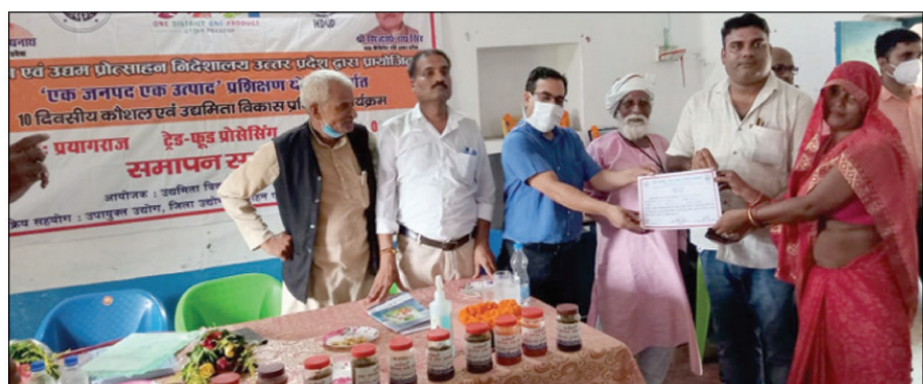
खाद्य प्रसंस्करण के दस दिवसीय समापन अवसर पर समापन अवसर पर प्रशिक्षुओं को प्रमाण पत्र सौंपते।