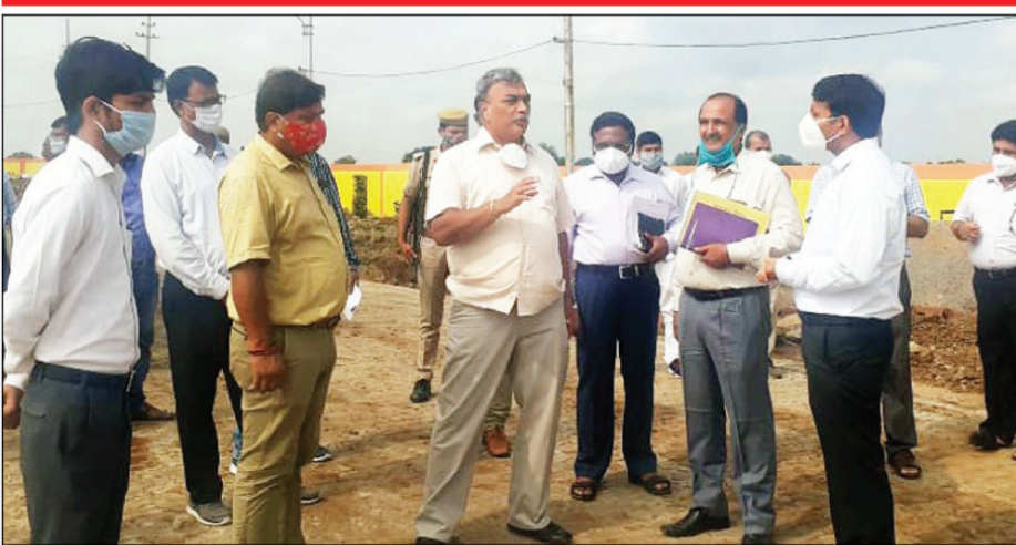
शंकरगढ़ के जनवा में कान्हा गौशाला, बकशी बांध के पास निर्माणधीन पानी की टंकी व पराग डेयरी प्लांट का निरीक्षण करते प्रमुख सचिव

टीकाकरण करा लिया गया है। चारा, भूसा का पर्याप्त मात्रा में स्टॉक उपलब्ध है। नोडल अधिकारी ने मुख्य पशु चिकित्सा अधिकारी को निर्देशित करते हुए कहा कि कान्हा गौशाला में निराश्रित गौवशों के गोबर से गमले का निर्माण किये जाने की कार्य योजना बनायें। उन्होंने कहा कि गोबर के गमले से पर्यावरण शुद्ध