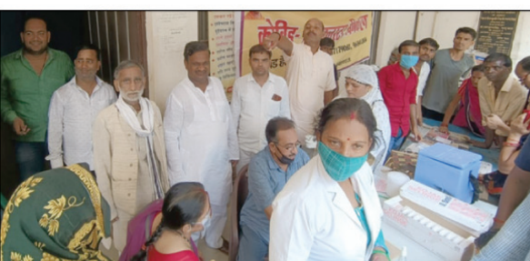
बेदौली में लोग टीकाकरण कराते

मेजा रोड। विकास खंड उरुवा के न्याय पंचायत बेदौली में कोरोना से बचाव का टीका लगवाने के लिए ग्रामीणों की भारी भीड़ जुटी रही। सोमवार को बेदौली गांव के प्राथमिक विद्यालय में वैक्सीन लगवाने के लिए ग्रामीणों की भारी भीड़ सुबह से ही जुट रही। देखा जाए तो टीका लगवाने पहुंचे लोग बौर मामूक तथा सोशल डिस्टेंस का पालन करते देखे गए, भीड़ इतनी जबरदस्त थी कि लोग एक दूसरे पर चढ़ते नजर आए। वहीं कुछ ग्रामीणों का आरोप है कि प्रधान के द्वारा अपने चहेतों को टोकरा दिया जा रहा है जिससे कि उन्हें पहले वैक्सीन लगाई जा सके। जबकि स्वास्थ्य विभाग के द्वारा 200 लोगों को टीका लगवाने का लक्ष्य रखा गया है।